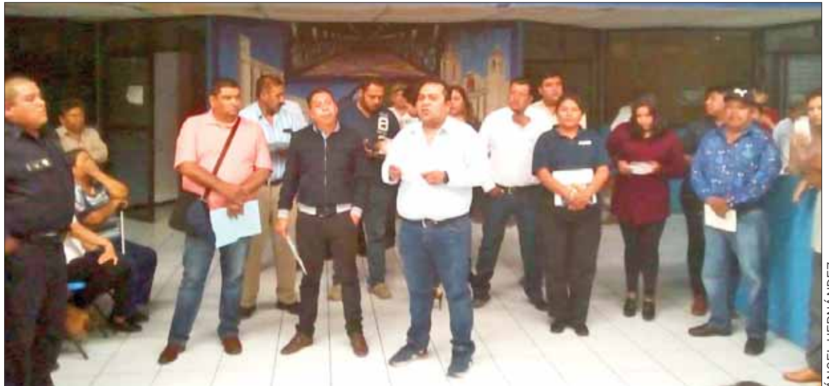
PRETEXTOS. Argumentó el alcalde que el problema delincriminal deriva de lucha contra huachicoleo.