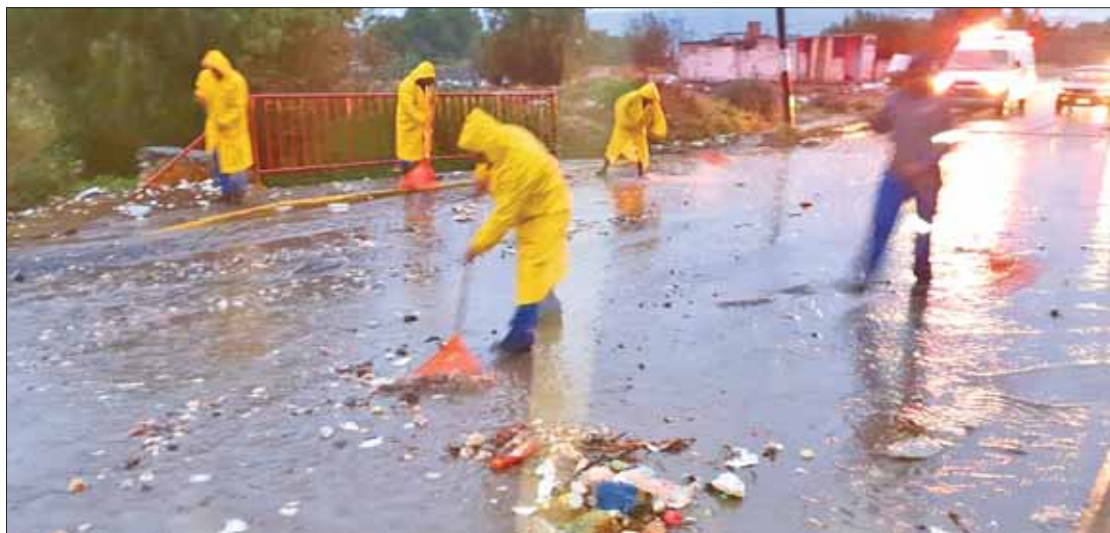
Calles de Pachuca y Mineral de la Reforma repletas de basura arrastrada por el agua de recientes lluvias, lo que ocasionó taponamientos en coladeras y encharcamientos.

Aseveró que la entidad trabaja firmemente la estrategia diseñada por el gobernador Omar Fayad. .3