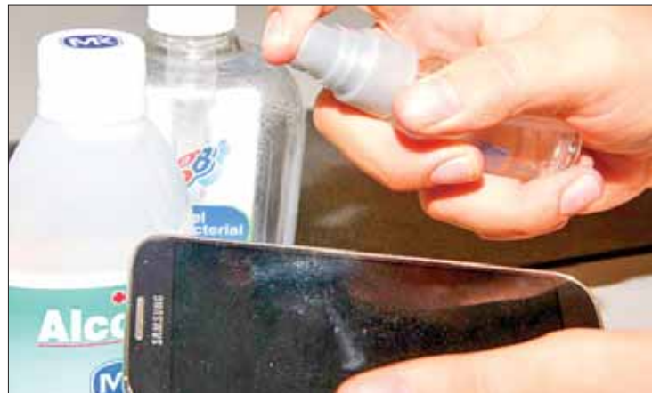
HÁBITOS. Expuso que mucha gente acude al sanitario con el móvil.

Comentó que uno de los problemas más comunes, que por lo general la mayoría de personas realiza, es acudir al baño con el teléfono, lo que genera un contacto entre el artefacto y