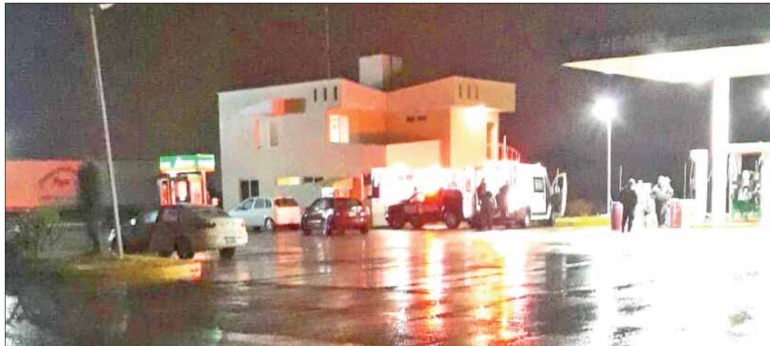
DENUNCIAS. Robos de autopartes, a casa habitación y asaltos ya son el pan de cada día.

Por último manifestaron que también el pasado jueves un hombre recibió un disparo de arma de fuego cuando lo asaltaron