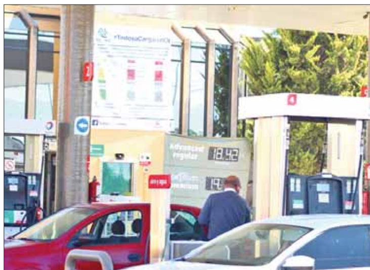
CIFRAS. Ciudadanía deberá costear 4.06 pesos por litro para Premium.

En tanto, para la gasolina Magna o "verde", el estímulo continuará; sin embargo, con monto menor, pues hasta esta semana tenía apoyo del 29.27 por ciento del IEPS y pasará al 22.85 por ciento, con lo cual deberán pagarse 3.71 pesos por cada litro, por concepto de impuestos. El apoyo para diésel continuará, al ser de 19.75