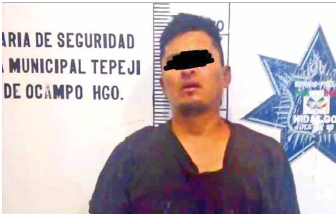
GOLPES. Pese a todo varios oficiales sufrieron las agresiones por parte de la turba, así como sus patrullas.

graron separarlo del resto y que el maleante huyó hacia el domicilio de un familiar, de donde un grupo aproximado de 50 personas pretendían sacarlo por la fuerza; no obstante, al sitio llegaron elementos de la Secretaría de Seguridad Pública Municipal, así