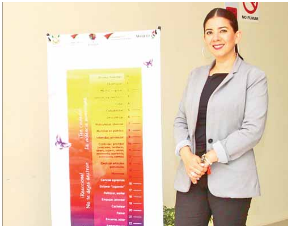
DIFUSIÓN Determinó la alcaldía colocar avisos relativos a dicho instrumento, para alertar.

Se considera una escala menor de violen-