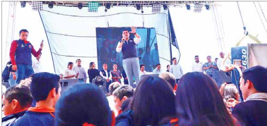
RELACIÓN. Apuntó secretario que el partido mantiene este trabajo, de cara al conteo de adeptos en Hidalgo.