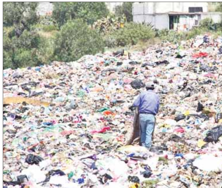
TAREAS. Indicó que el objetivo es llegar a la población y convencerla.

Sostuvo que iniciarán en las dos centrales de abasto para que la gente evalúe por sí misma las ventajas de separar sólidos y a pequeña escala, debido a que en la