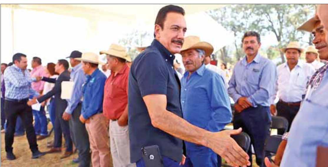
Compromiso del gobernador es incorporar más y mejor tecnología a favor de la producción agropecuaria en Hidalgo.

Así como se usa la tecnología en Hidalgo para los rubros de seguridad y salud... 3