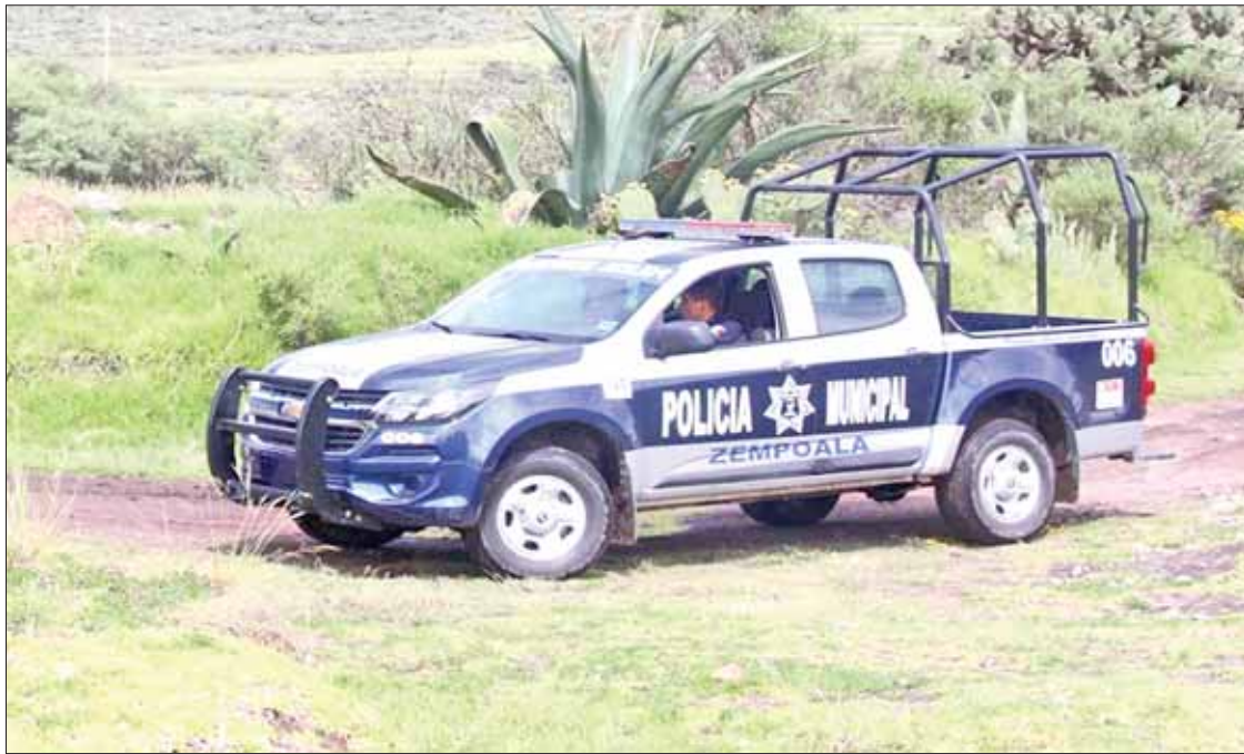
ESTRATEGIAS. Subrayaron emprendedores de la región las posibilidades con que ahora cuentan gracias a la seguridad.

► Para la llegada de más inversiones y la instalación de empresas que fomentan la creación de empleos