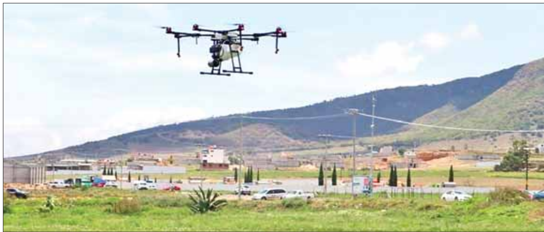
BENEFICIO. Utilizarán campesinos estas herramientas para facilitar su trabajo en tierras de cultivo de la zona.

Esta toma no ha podido ser instalada debido a que la Comisión de Agua Potable y Alcantarillado de Ixmiquilpan (Capasmi) no tienen jurisdicción dentro del barrio de San Antonio, que cuenta con su propio sistema de agua potable para suministrar el servicio a lugareños. (Hugo Cardón)