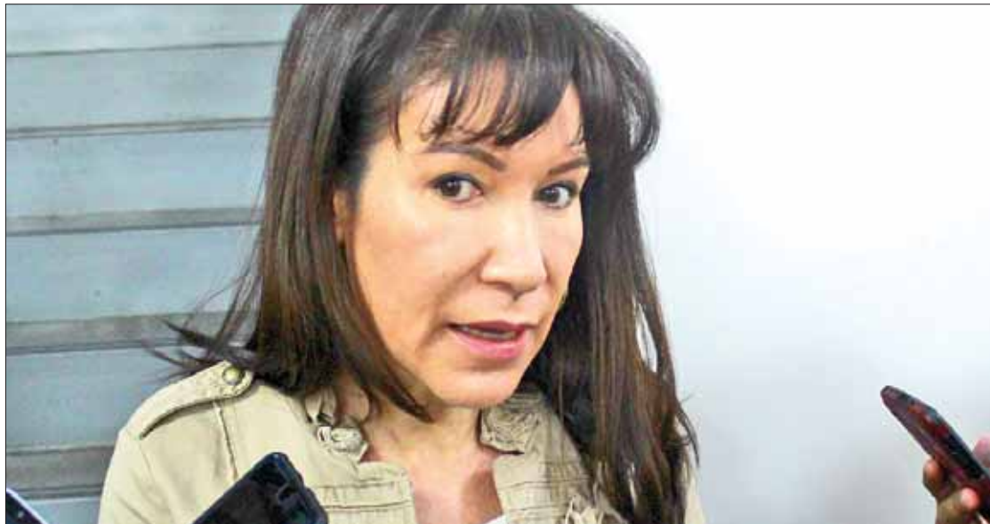
EJEMPLO. Recordó que los morenistas pusieron a disposición del Patronato Universitario recursos por 300 mdp.