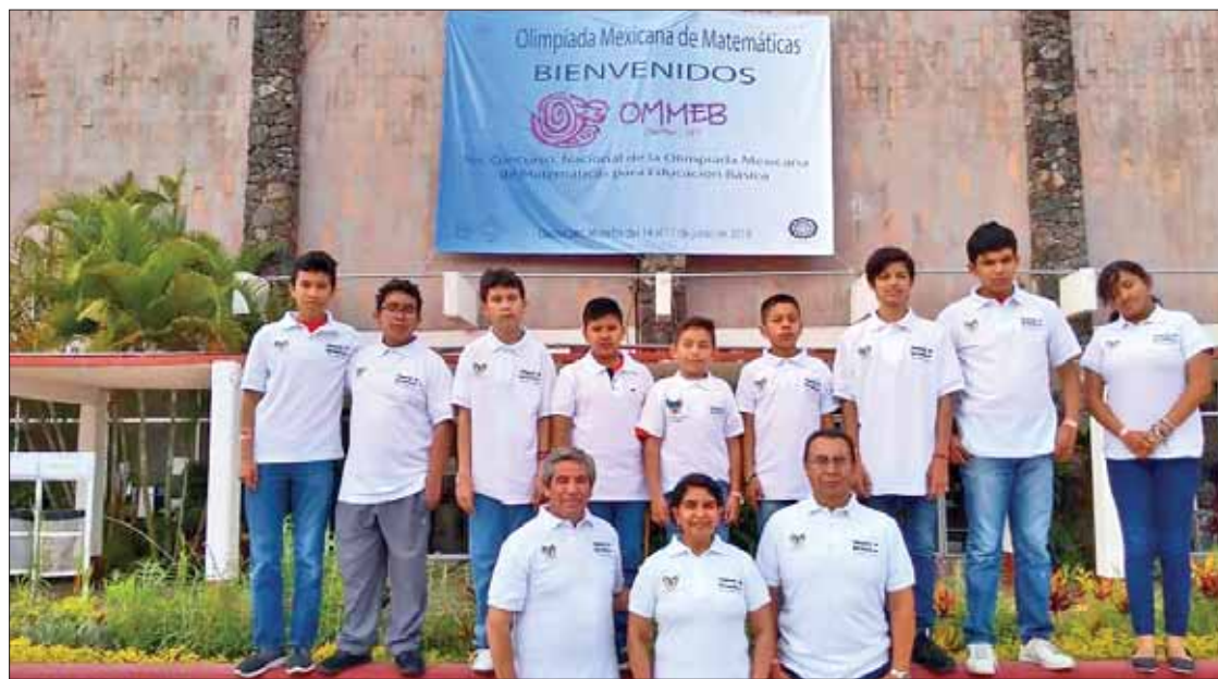
DESAFÍOS. Recordó que su administración seguirá apoyando a la juventud para que alcance sus metas.

Finalmente reconoció que algunas obras proyectadas como el puente de La Romera no serán concretadas en este periodo. (Ángel Hernández)