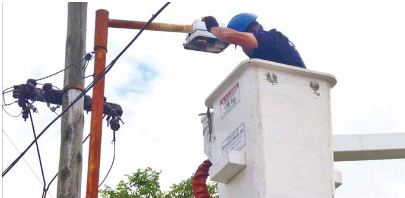
FLUJO. Autorizaron a este ayuntamiento celebrar contrato de asociación público privada en la modalidad de apoyo a la prestación de servicios de alumbrado público municipal.

Específica que será para remplazar 3 mil 223 luminarias, servicios de mantenimiento y conservación, mientras que para la fuente de pago, la alcaldía puede solicitar ingresos de libre disposición como son impuesto, productos, derechos o participaciones federales del ramo 28.