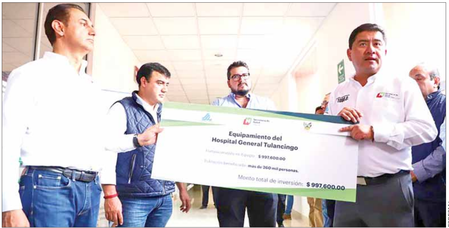
PAUTAS. Descartan que se construyan edificios nuevos de salud.

De acuerdo con una de las afectadas Leslie Robles, quien es originaria de Huichapan, a ella y a su esposo los estafó al ofrecerles permisos de trabajo, además en otros casos ofrecía tramitar la ciudadanía. (Jocelyn Andrade)