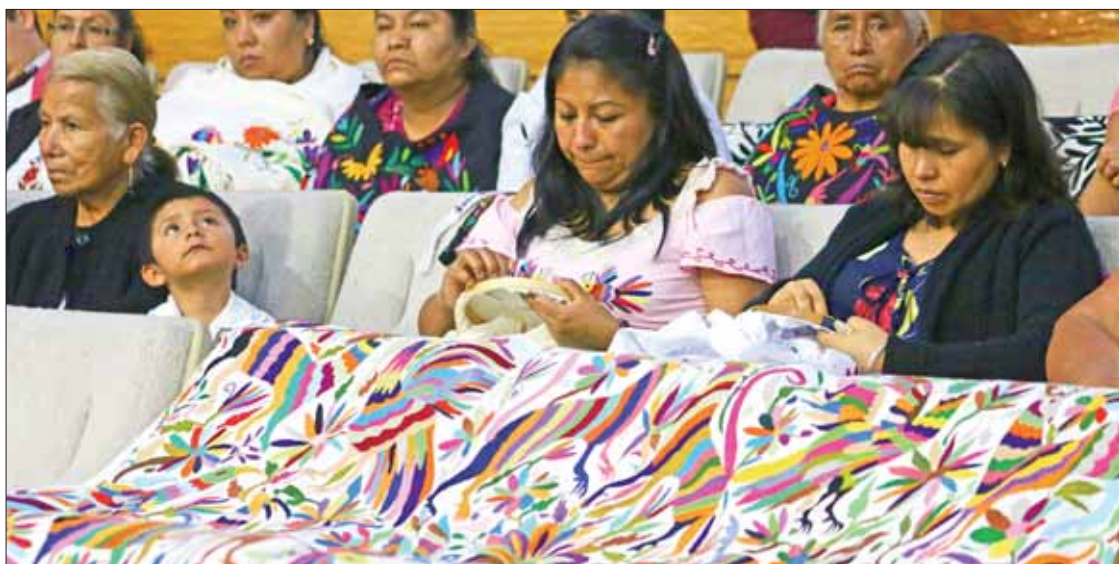
Acudieron artesanos de Tenango de Doria al Congreso local, donde demandaron apoyo de diputados para evitar más plagios por grandes compañías.