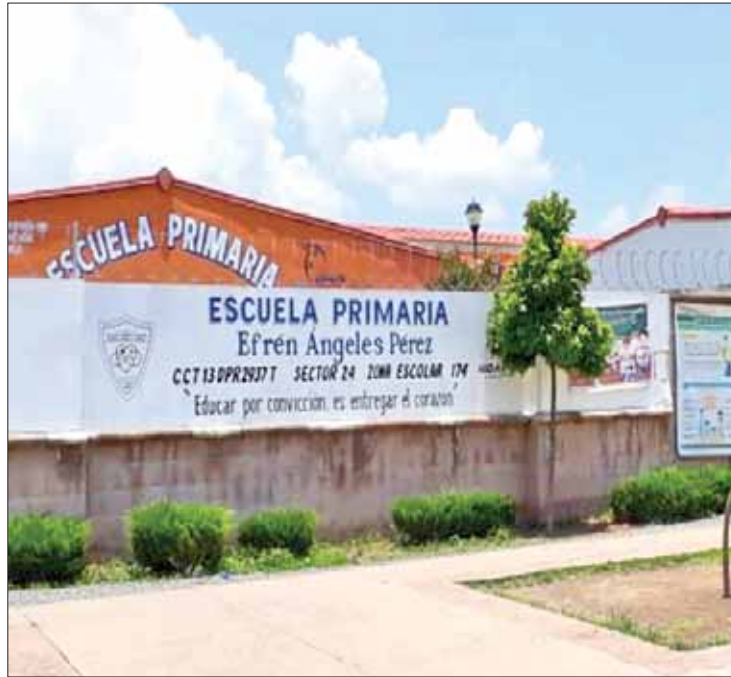
RESPUESTA. Acudió personal de Seguridad Pública y de la SEPH ante situaciones.

Debido a que los ánimos se calentaron, personal del colegio tuvo que solicitar una patrulla de la Secretaría de Seguridad Pública Municipal en las inmediaciones para evitar un connato de bronca, pues padres y madres de familia estaban vi-