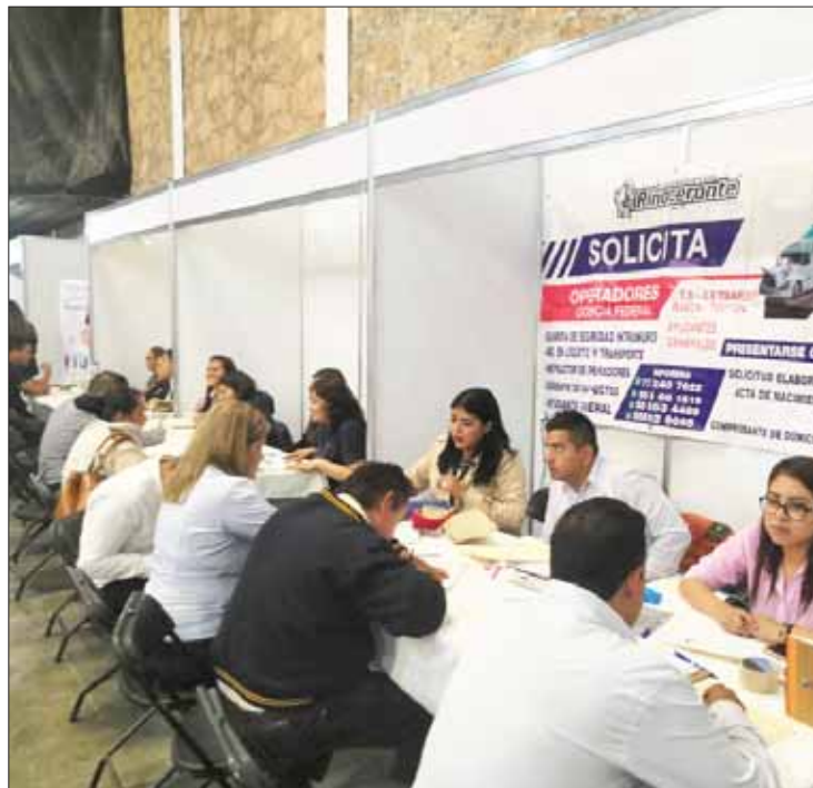
POSTURA. Resulta de vital importancia para el municipio contar con ferias del empleo exclusivas para acercar ofertas a los jóvenes recién egresados e insertarlos a la vida productiva cuando están frescos, destaca alcaldesa.

También refirió que es una excelente oportunidad para aquellas personas que ya no son tan jóvenes, pero que son emprendedores y que desgraciadamente no cuentan con empleo porque mediante la Secretaría del Trabajo y Previsión Social (STPS), aquellas personas pueden obtener un financiamiento para poner un