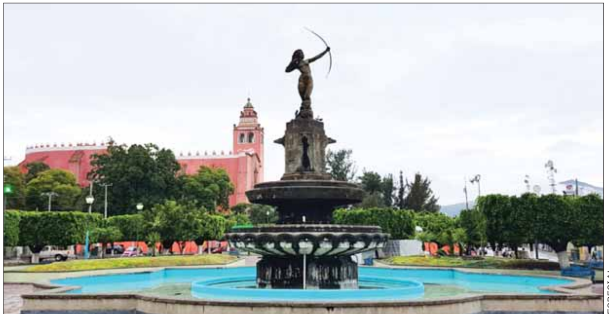
PANORAMA. Autoridades no han definido hasta dónde llegan sus territorios y en ambos casos se acusan de invadir predios.

Dejó en claro que el tema no ha quedado en el olvido; no obstante, el contexto social ha impedido que los dos municipios, a través de sus asambleas, puedan sentarse para darle seguimiento. Cabe mencionar que Cardonal e Ixmiquilpan tienen varias comunidades colindantes sobre las cuales existen dudas sobre sus límites territoriales.