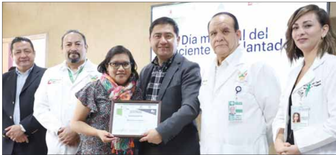
ESTILOS. Reconocimiento público a quienes de manera desinteresada entregan parte de su vida a otras personas.