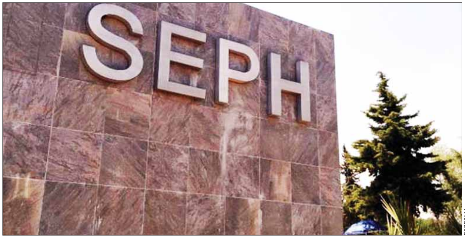
PORMENORES. Expuso la dependencia a través de sus redes sociales que llevarán a cabo este examen en conformidad con el calendario.

Las categorías del curso serán: kids de seis a 10 años; robótica de siete a 10 y de 11 a 15 años. (Adalid Vera)