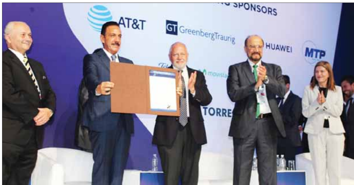
Adelantó el gobernador llegada de más inversiones al estado en materia de telecomunicaciones.