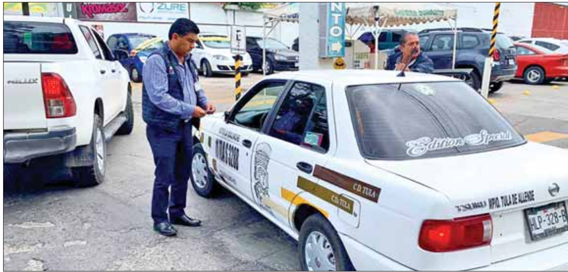
SEGUIMIENTO. Acciones para resolver de manera inmediata y directa las distintas quejas ciudadanas presentadas durante las audiencias públicas que se han llevado a cabo en aquella región.

Según información oficial, estas denuncias coincidían en que