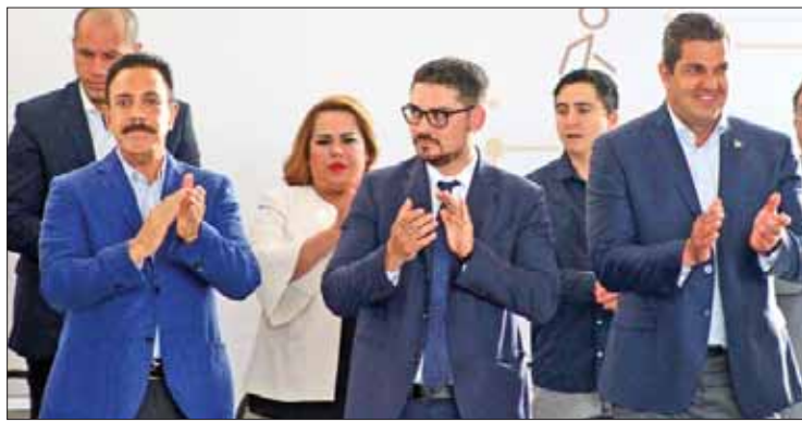
ESPACIOS. Desarrollan en Hidalgo mesa regional de trabajo como parte del Proceso Nacional de Armonización Normativa, en materia de Movilidad.