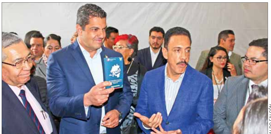
Realizaron en Hidalgo mesa regional de trabajo como parte del Proceso Nacional de Armonización Normativa, en materia de Movilidad: contribuirá en la consolidación de un desarrollo integral y en elevar la calidad de vida de las familias mexicanas.

El titular de la Secretaría de Desarrollo Agrario, Territorial y Urbano (Sedatu), Román Meyer Falcón, presidió el inicio de los trabajos acompañados por el subsecretario de Gobernación, Ricardo Peralta Saucedo; el gobernador, Omar Fayad; la senadora, Patricia Mercado Castro, presidenta de la Comisión de Zonas Metropolitanas y Movilidad; y demás personalidades. .3