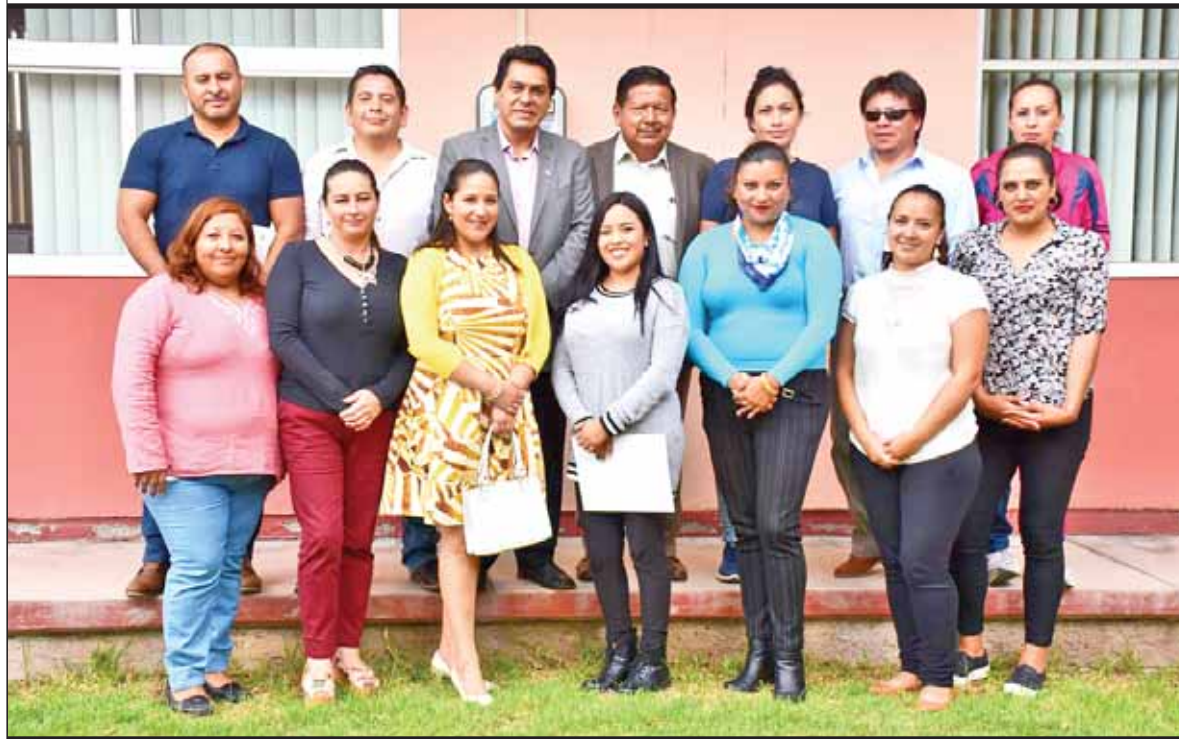
PROCESO. Al regresar a Hidalgo compartirán experiencia y conocimientos adquiridos en aquel país.