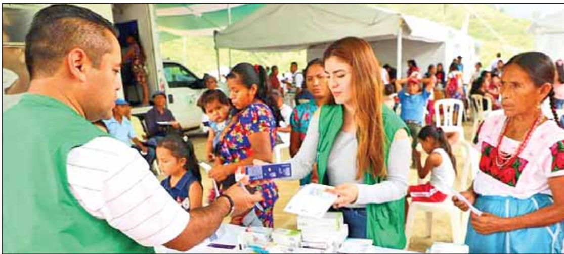
ESPECIALIDADES. Medicina general, neurocirugías, oftalmología, ginecología y obstetricia, así como traumatología y ortopedia, pediatría, cirugía general y medicina interna, entre otros servicios.

Con todo este despliegue de profesionales, se espera un aforo de entre mil a mil 3 personas.