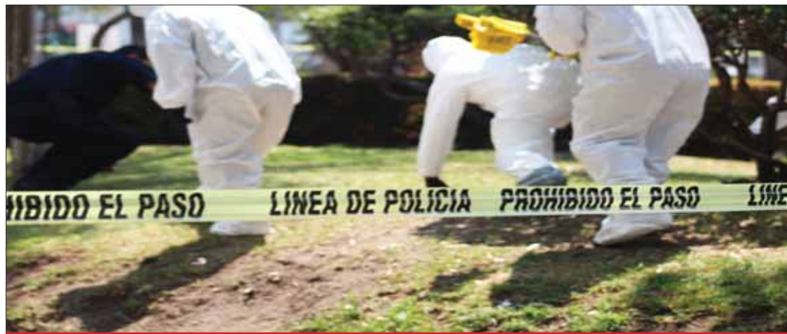
PROTOSCOLOS. Arribaron elementos de Ministerio Público a fin de iniciar la carpeta correspondiente para dar con el o los responsables.

Aunque se desconoce el móvil del asesinato, peritos y la Policía de Investigación recabaron indicios para anexarlos a una Carpeta de Investigación que permita conocer detalles de lo ocurrido.