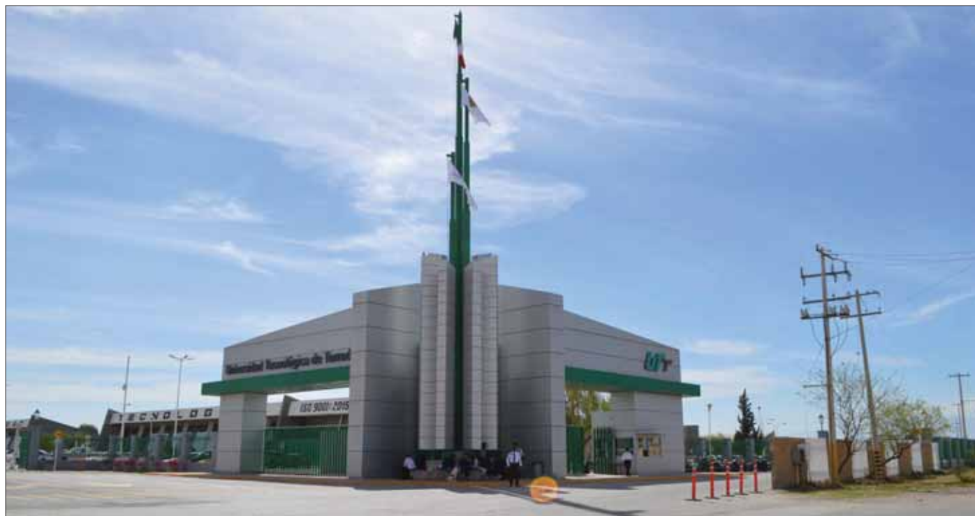
CATEGORÍAS. Proyectos sociales, emprendimiento tecnológico, innovación en productos y servicios, así como energías limpias y sustentabilidad ambiental.

para el primer lugar de cada categoría, de 25 mil para el segundo puesto y de 20 mil en el caso del tercer lugar.