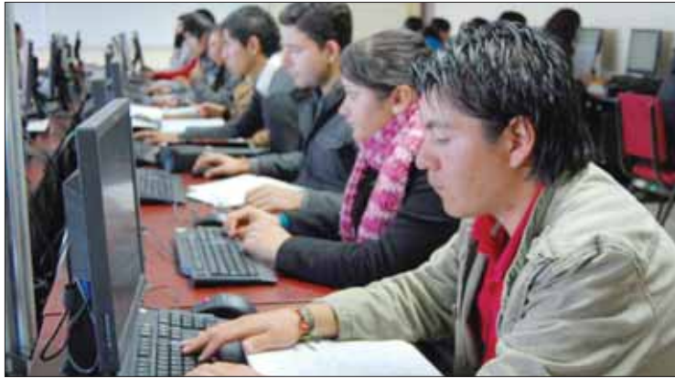
PLATAFORMAS. Consultar la página oficial de la SEPH, así como en cada organismo descentralizado o dependiente de la secretaría.

► Difundirán nombre de quienes tendrán beca Miguel Hidalgo ; objetivo es que los jóvenes no trunquen su preparación académica por falta de recursos económicos