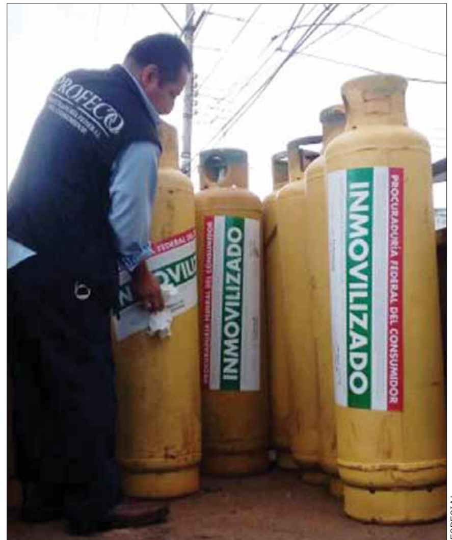
PISTAS. En lo que va del año en Hidalgo, la Profeco sólo ha encontrado una gasera con irregularidades en el municipio de San Salvador, que es Fibra gas, además de una que se negó a ser revisada Gas de Provincia, con domicilio en Pachuca.

Cabe resaltar que las verificaciones a las empresas gaseras se realizan tanto a las plantas, los vehículos que se encuentran en ellas, así como los que se encuentran en la vía pública, con la finalidad de contar con datos más precisos y todo se concentra en una base nacional, que puede ser consultada a través de internet.