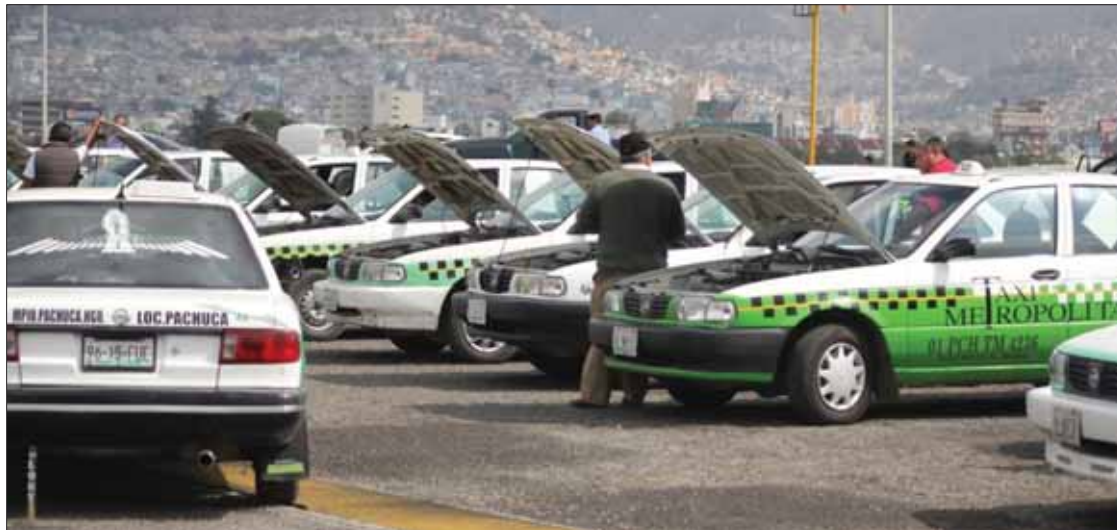
EJEMPLOS. El trabajo seguirá de manera continua con los operativos "sorpresa" en cada una de las zonas del estado, para que los usuarios reciban un servicio de calidad.

Indicó el titular de la Semot que cada una de las acciones son para transformar y revolucionar la movilidad del transporte pú-