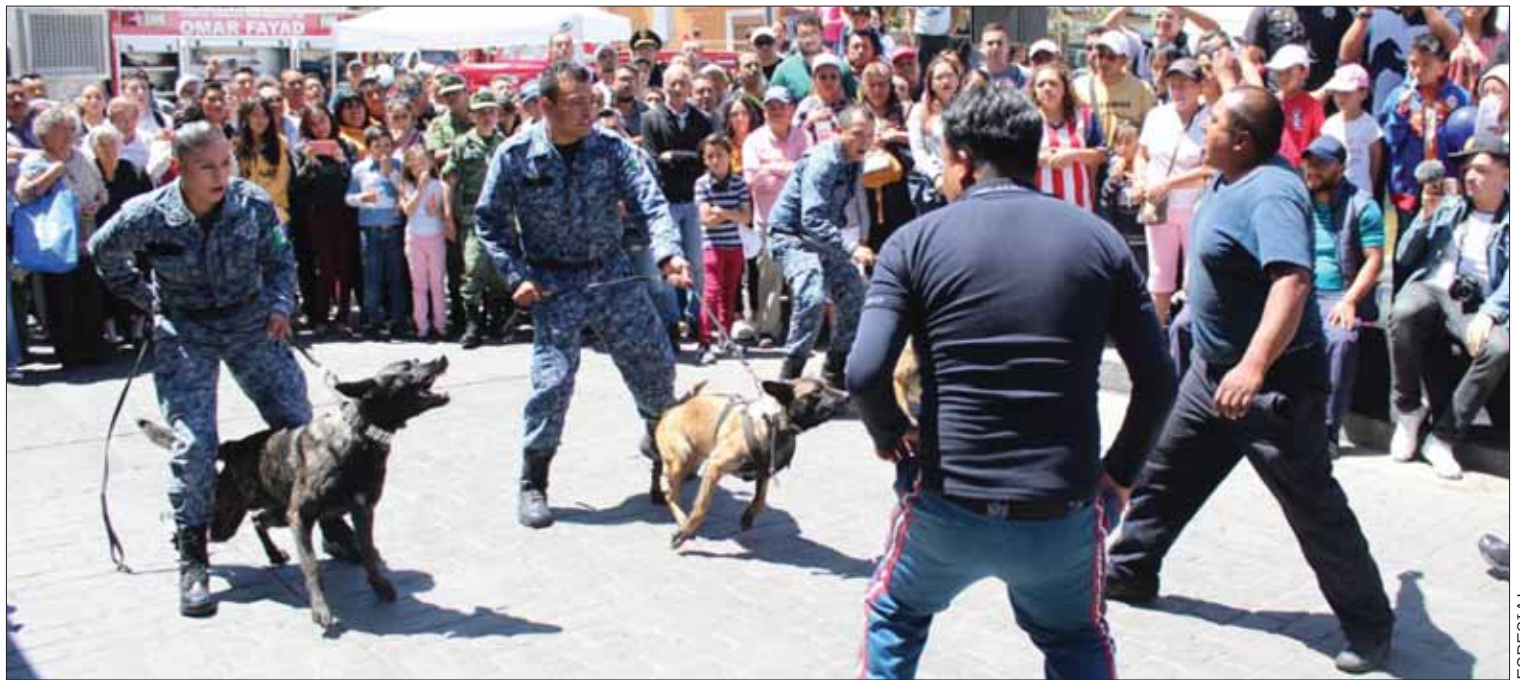
COORDINACIÓN. Solicitó el secretario que población coadyuve como ojos y oídos de la dependencia estatal en el combate a la delincuencia.