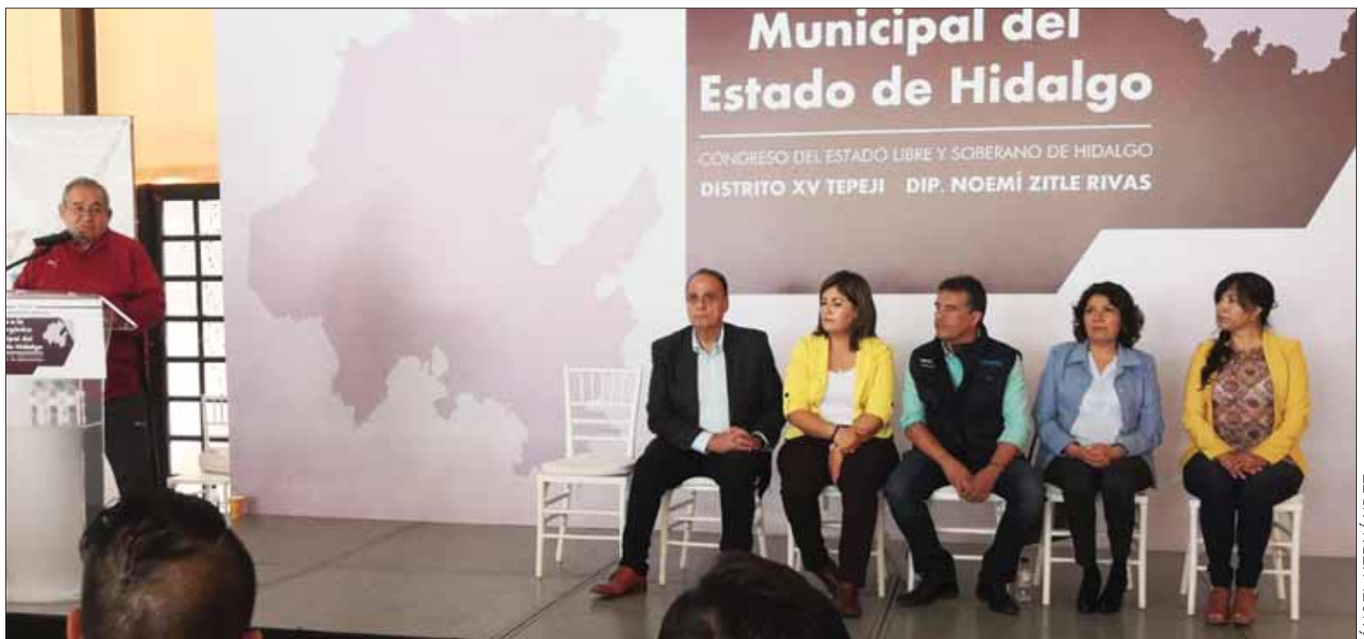
ACTUALIZACIONES. Una de las metas principales es terminar con el centralismo y adecuar tiempos y acciones al diario acontecer, expresó el diputado.

Además sostuvo que también el llamado fue para que se clarifique la forma de operar de las cámaras de video-vigilancia del programa Hidalgo Seguro, las cuales fueron puestas en marcha el pasado 8 de mayo. "En el evento inaugural vino el Presidente de la República, Andrés Manuel López Obrador, pero no sabemos si realmente funcionan o en qué porcentaje y bajo qué esquema lo hacen". (Ángel Hernández)