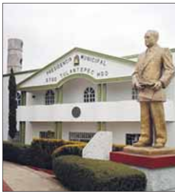
MANDOS. Buscó La Crónica al superdelegado para corroborar o desmentir, pero sin atención.