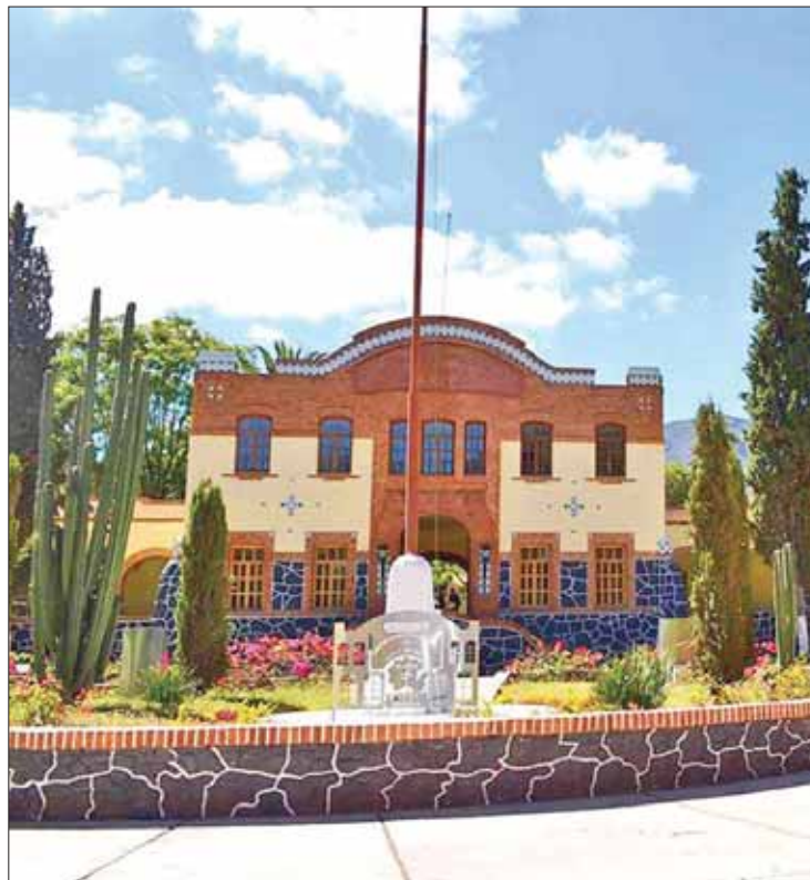
CLASES. Inició enseñanzas pero todavía sigue en la pugna por espacios.

Sin embargo, la escuela también conocida como "El Mexe"