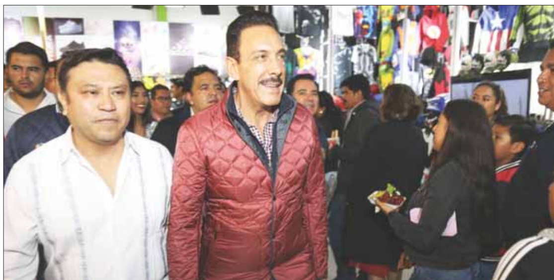
Invitó mandatario hidalguense a disfrutar de todo lo que ofrecen las tradicionales ferias del estado, como la de Actopan.

Omar Fayad, invitado de honor de la tradicional festividad, exhortó a las familias hidalguenses a visitar Actopan y disfrutar del Concurso de la Barbacoa, que cumplió 48 años de vida con uno de los platillos más representativos de Hidalgo. "Invito a las familias de Hidalgo y de todo México a visitar esta feria, vengan a disfrutar de nuestras riquezas culturales y gastronómicas, como la barbacoa, o la exposición 'Mensajes Divinos, Manos que los Revelan'". 3