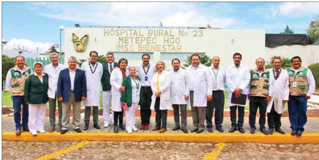
DELEGACIÓN. Ofrecieron cirugías a menores de edad con diversos padecimientos, informó el organismo.

Por último los directivos señalaron que todos aquellos interesados en participar en las diferentes convocatorias para egresados, participarán en distintos procesos de reclutamiento.