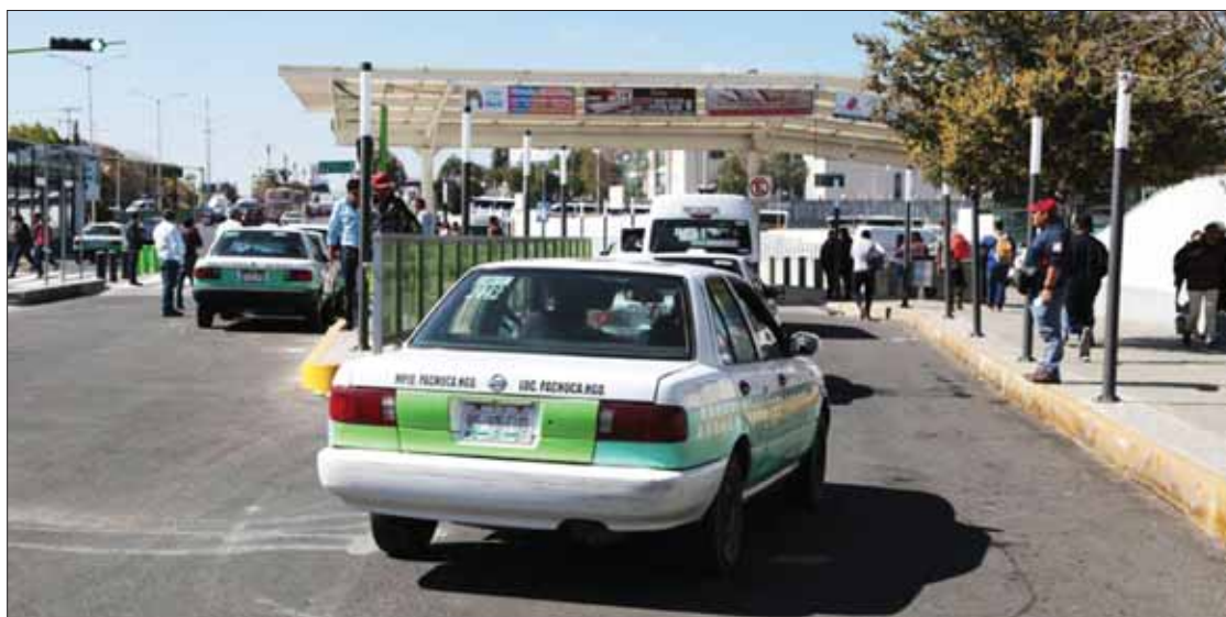
NORMATIVAS. Invitaron a la población a realizar sus denuncias para castigar a quien así lo merezca.

"Versiones pueden existir y en todos sentidos, pero no ayuda en nada que se culpe a compañeros de esos puntos de situaciones que representan señalamientos graves en Pachuca, no es justo, de lo contrario la autoridad competente ya habría tomado cartas en el asunto", afirmaron.