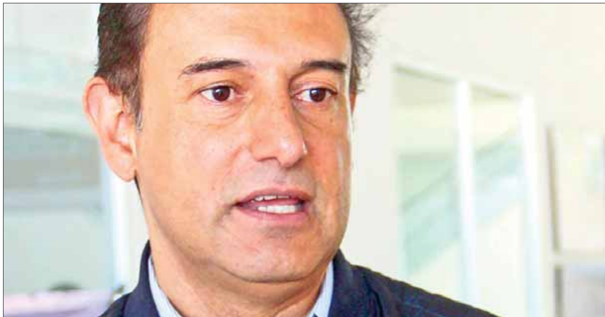
DESTINO. Casi millón y medio de pesos fueron empleados para cumplir estas demandas.

El desarrollo de las obras a entregarse fue por un bimestre, cumpliendo puntualmente las especificaciones del expediente técnico.