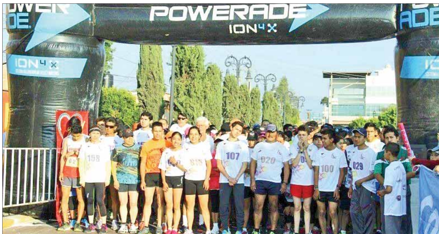
FORMATOS. Implica Expo Tulancingo un calendario con los eventos a desarrollar, durante los días que dura la celebración.

La administración municipal 2016-2020 pone a disposición el número de Protección Civil y Bomberos para cualquier emergencia 1164043 o bien pueden acudir a la estación ubicada en libramiento Santiago-Ventoquipa en la colonia Centro, a un costado de DIF municipal. (Redacción)