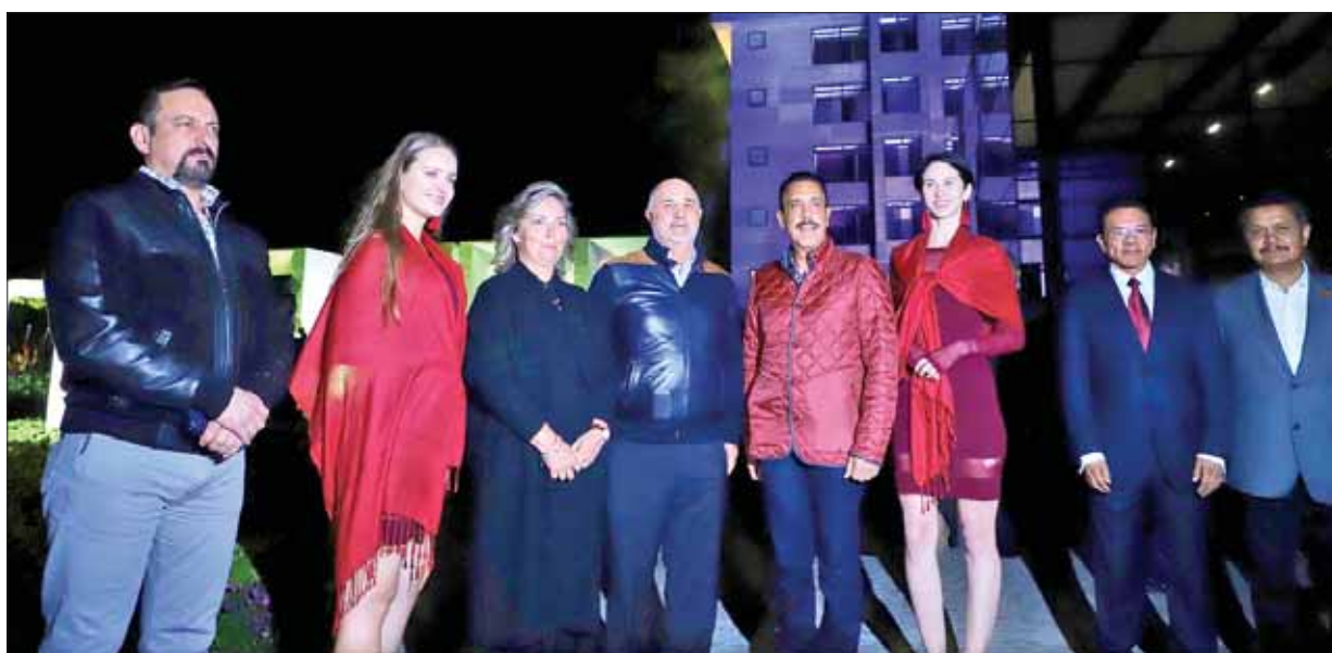
Anunció gobernador Fayad calificación de AAA estable, que coloca a Hidalgo como entidad con certeza para inversiones.

Zurutuza, entre otros "priistas" que aparecen en el listado validado por el Instituto Nacional Electoral (INE). Según el último acuerdo publicado por la Comisión Nacional de Procesos Internos son 6 millones 764 mil 615 militantes en todo México dados de alta para sufragar en la contienda interna; en Hidalgo son 161 mil 439 afiliados. Hasta enero de 2019, el INE reveló que el PRI tenía poco más de 6.5 millones de militantes. .3