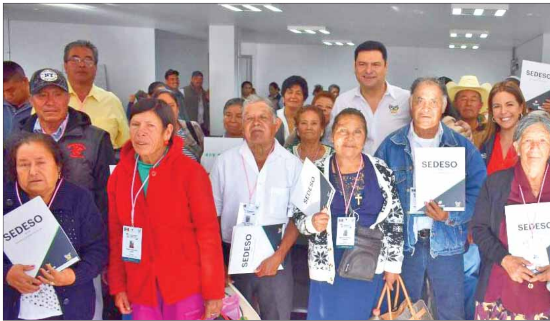
FORTALEZA. Recordó el titular de la dependencia la participación de clubes migrantes en aquella nación.

La resolución del TEEH fue ordenar al órgano electoral cambiar su respuesta, toda vez que para considerar una reelección debe hacerse por el mismo cargo y en el cuestionamiento de Acción Nacional se especificó que era para un cargo diferente y por ende no son las mismas funciones, además que enfrentarán a una nueva elección.