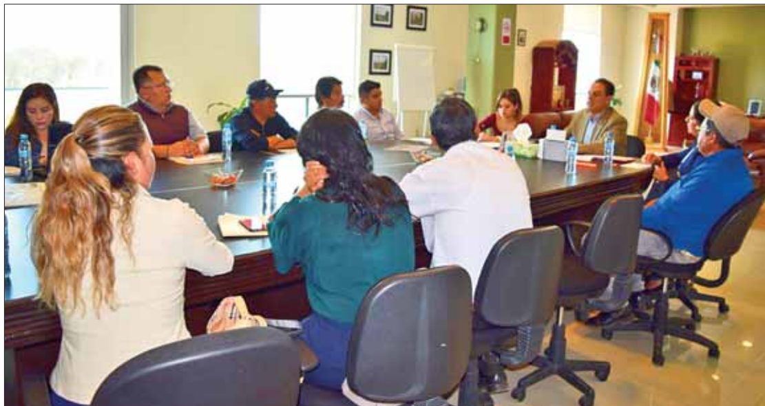
ALCALDE. Habrá un cambio importante en esta colonia y para garantizar que así suceda, realizarán constante revisión y evaluación al alcance y respuesta que tengan los compromisos signados.

También se explicó la diferencia entre un delito y una falta administrativa, de tal manera que se