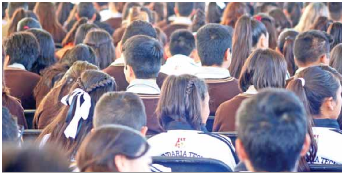
OPORTUNIDAD. Ya lanzó la licitación para definir qué empresas producirán estos productos en la entidad.

De acuerdo con la experiencia que compartirán a través de sus videos, los participantes deberán elegir alguno de los diversos temas. (Adalid Vera)