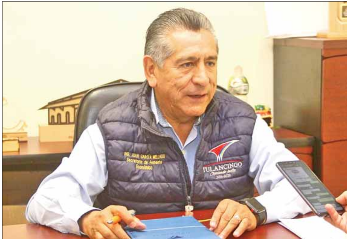
DETALLES. Evento tiene todo para ser una de las más importantes del centro del país.

Dentro de las 20 atracciones de la expo se encuentran: torneo de charros, exposición equina, ca-