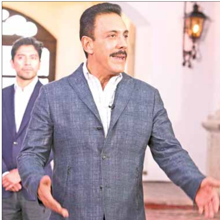
PANORAMA. Reiteró Omar Fayad confianza de quienes ven en la entidad un territorio para negocios.

A mil días de su gobierno, Omar Fayad reiteró que su administración está cada vez más cer-