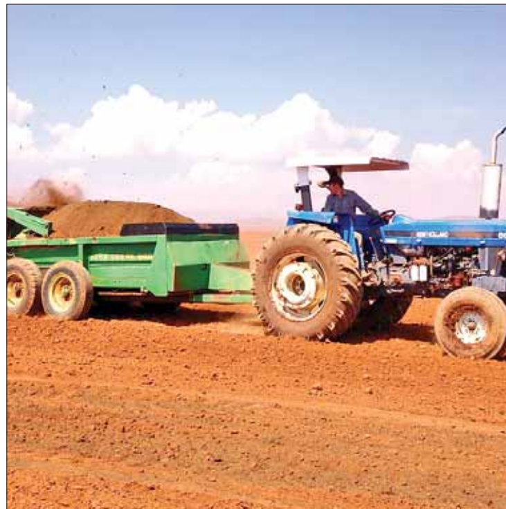
TRAZOS. Las acciones aplicadas en el estado son parte de la política del gobernador Omar Fayad.

Las fotografías georeferenciadas permitirán observar grandes extensiones de cultivos, sus características visuales y topográficas que se tienen en las zonas de