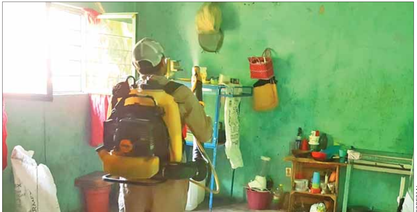
MALES. Entre los padecimientos a evitar están diarreas, enfermedades en la piel como dermatitis, así como las respiratorias en la niñez y los adultos mayores

La SSH recomienda seguir dichas medidas de prevención propias de la época de lluvias y de calor que concluyen el 30 de noviembre, además de estar pendientes de los reportes de Gobierno, Protección Civil, del Servicio Meteorológico Nacional y de Conagua.