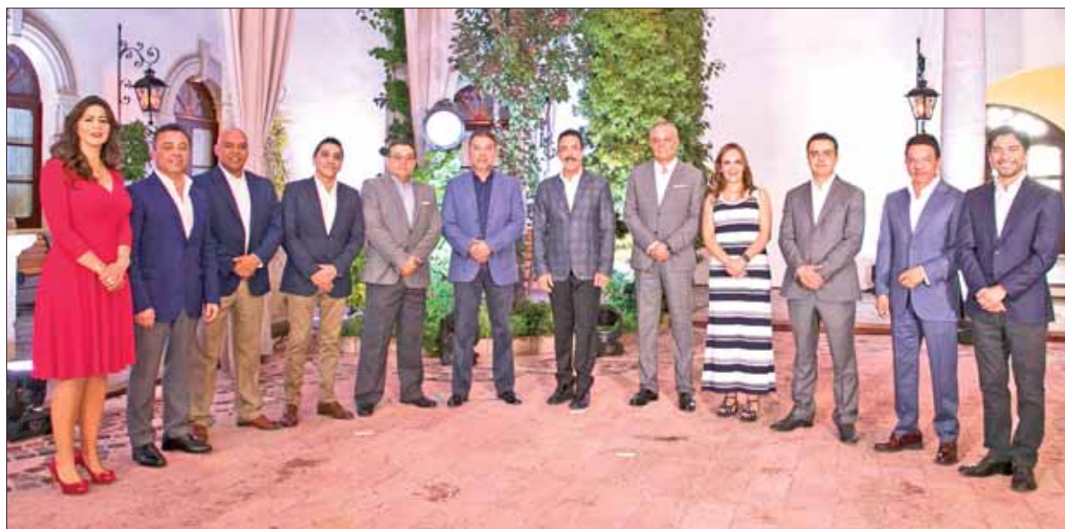
Junto con integrantes de su gabinete y representantes de negocios, el gobernador hizo el anuncio formal del arribo de nuevas inversiones al estado.