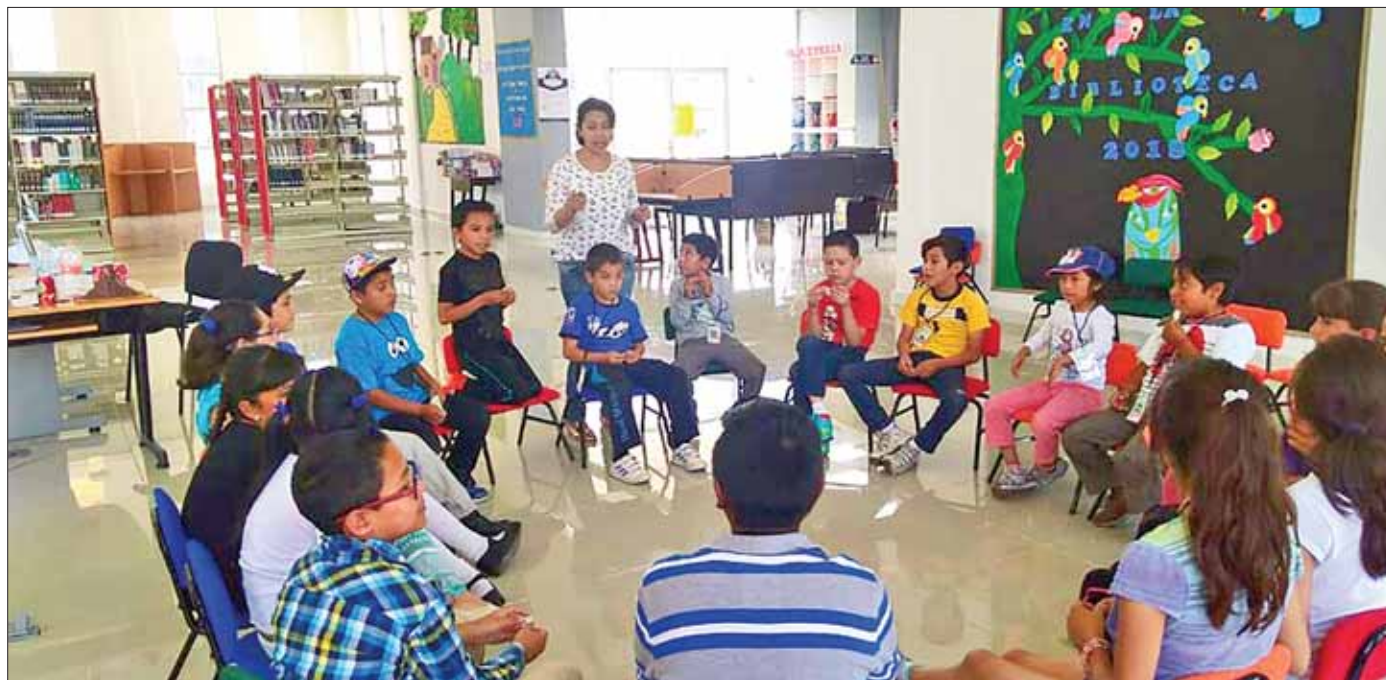
PERIODO. Cursos serán del 15 de julio al 9 de agosto, en horario de cada uno de los espacios que conforman la red en el estado.

Puntualizó que los talleres serán: "El diario de Robinson Crusoe", "Moby Dick", "Paco y José Luis: un mundo compartido", "Yo te bendigo vida", "Leonardo Da Vinci" y "El juego de las emociones", además de "El taller de Patolli de cuentos" el cual en su edición 35 tiene la finalidad de promover la diversidad cultural y lingüística del país.