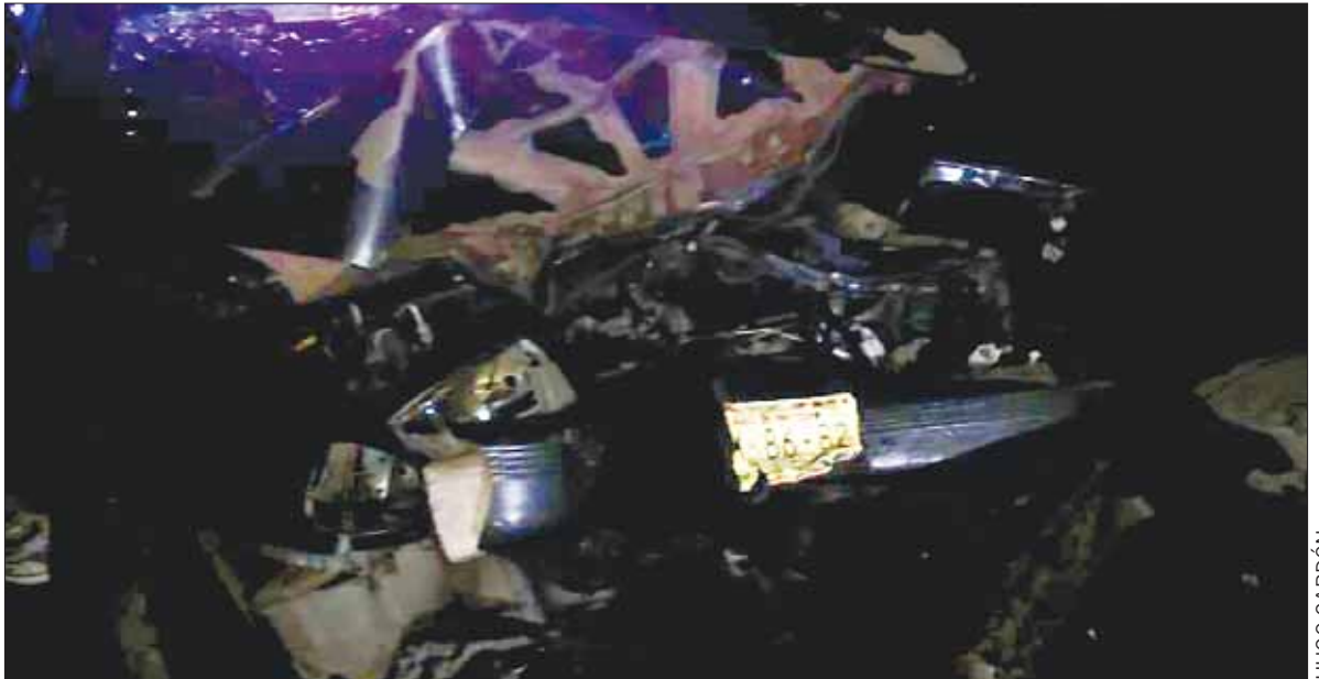
VIAJE. Fueron trasladados al hospital para recibir la atención médica y deslindar responsabilidades.

Hasta el momento se desconoce si derivado de este percance habrá detenciones, ya que primero se iniciarán las averiguaciones correspondientes, pues hasta el momento solamente se tienen datos de testigos oculares, por lo que se debe corroborar si el alcohol tuvo que ver con este accidente.