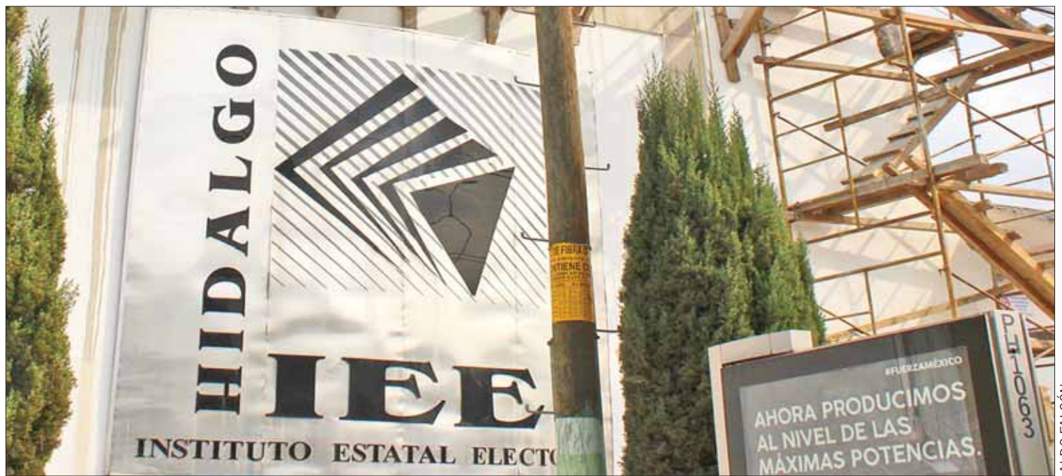
EQUÍVOCOS. Además recordó Hernández que la resolución del TEPJF determinó la realización de consulta a pueblos, no mediante reuniones

Cabe destacar que quienes lograron obtener concesiones debieron pasar por evaluaciones: un examen teórico con los temas relacionados a la normatividad de Establecimientos de Consumo Escolar, Lineamientos Generales para Autorizar la Instalación de Establecimientos de Consumo de Alimentos y Bebidas, Acuerdo mediante el cual se establecen los lineamientos generales para expendio y distribución de alimentos y bebidas.