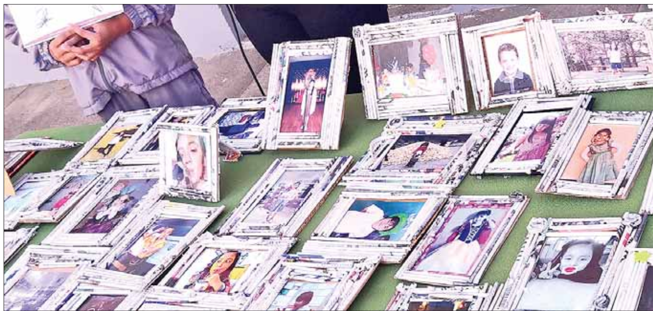
PAUTAS. El objetivo del taller es que todos aquellos que sean partícipes, observen que se puede brindar un uso diferente a ciertos materiales que muchos consideran como inservibles, y que podemos reducirlos, reutilizarlos y aprovecharlos empleando la transformación de los mismos.

Finalmente Monroy Ortiz mencionó que la CAAMT será el encargado de proporcionar todos los materiales a utilizar en cada una de las actividades.