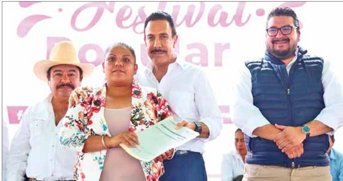
RECORRIDO. Realizó el mandatario estatal visita sorpresa para evaluar avance en construcción de clínica.

ción brinda becas a jóvenes universitarios para seguirlos apoyando, para que concluyan sus estudios satisfactoriamente.