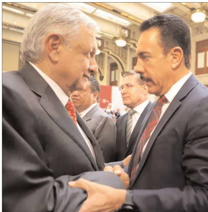
Participó el gobernador Fayad en la XLIV Sesión Ordinaria del Consejo Nacional de Seguridad Pública e Instalación y Primera Sesión Ordinaria del Consejo Nacional de Protección Civil, donde agradeció al presidente López Obrador su respaldo al pueblo de Hidalgo.

"Vamos a buscar apoyo del Instituto Nacional de Salud para el Bienestar para poner en marcha este nosocomio". 3