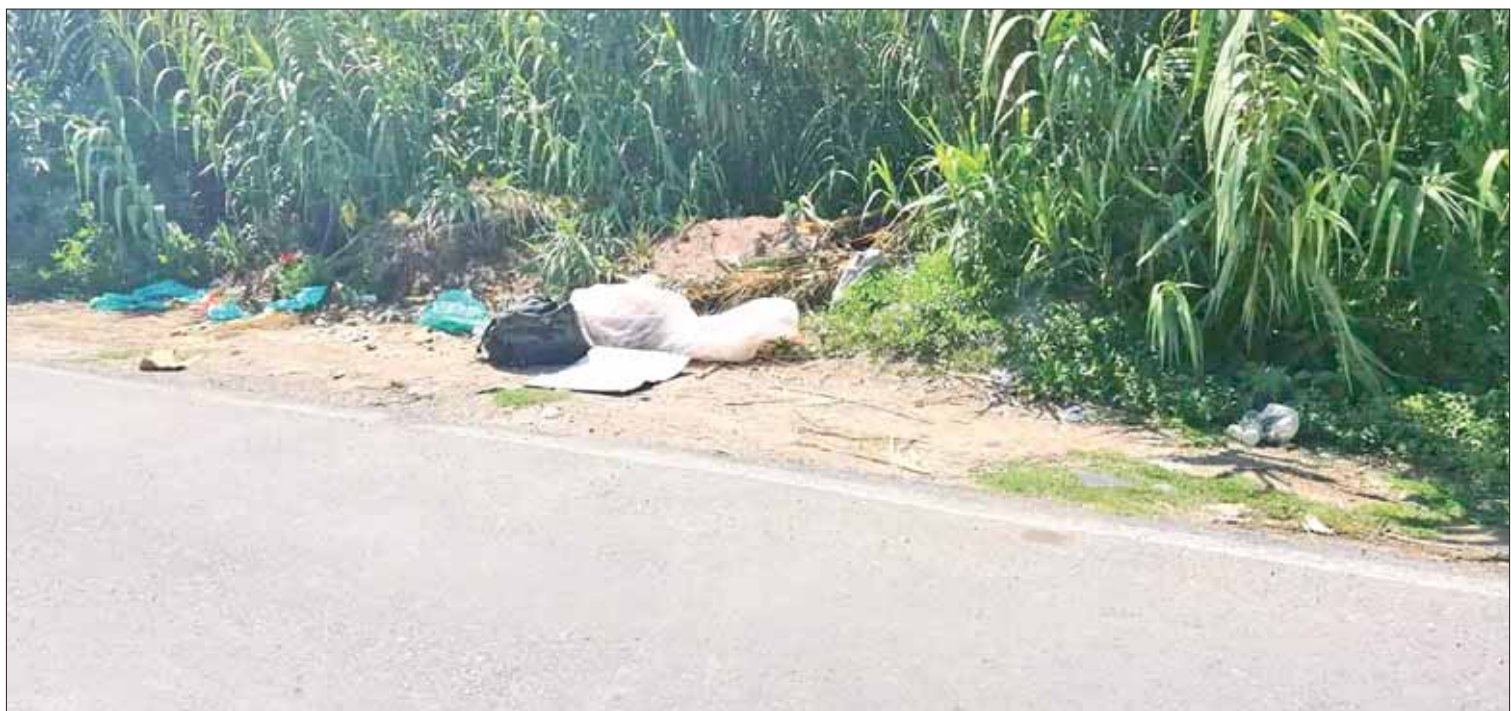
IMPARNABLES. El cadáver fue hallado en el Barrio de San Nicolás, a pesar de la presencia de los elementos de Guardia Nacional.

Asimismo, personal del Servicio Médico Forense (Semefo) realizó el levantamiento de los restos y llevará a cabo la necropsia de ley, así como la verificación de que todos los restos localizados correspondan a una misma persona, aunque hasta el momento se presume que sí es un solo cuerpo.