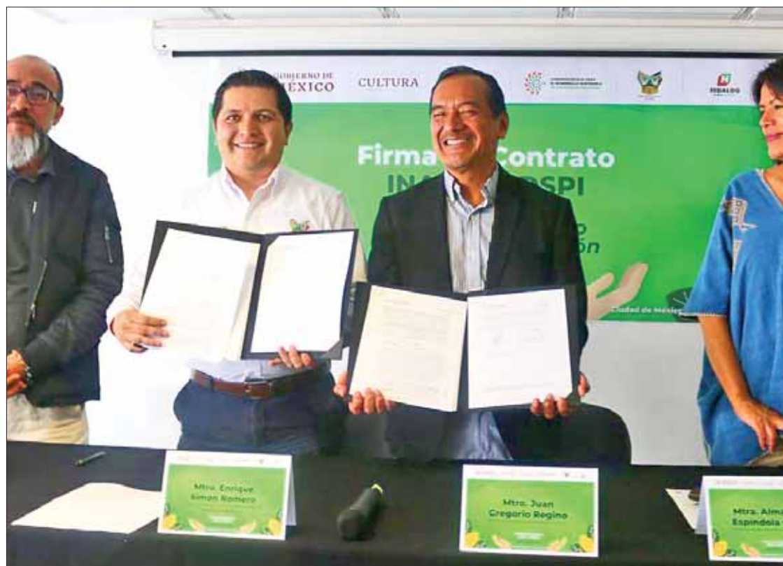
FINES. Auxiliará organismo en los procesos de certificación de competencias de candidatos a intérpretes.