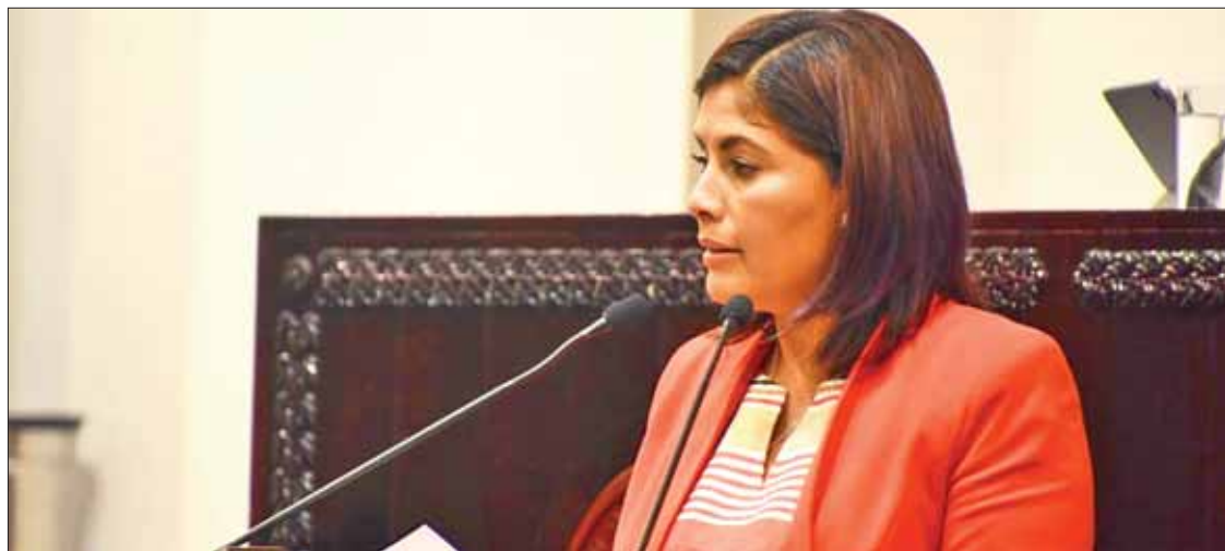
CUIDADOS. Subrayó legisladora la necesidad de garantizar una vida digna a las especies.

► Con el objetivo de proteger más a los animales, ante cualquier maltrato; incluye peleas de perros