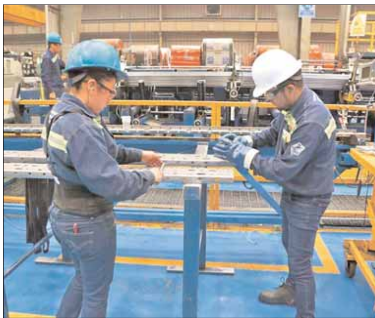
MOTIVOS. Coincidieron dirigencias en llegada de inversiones.

Apuntó que el 2.8% se debe en parte a la llegada de nuevas inversiones al estado, que superan los 53 mil millones de pe-