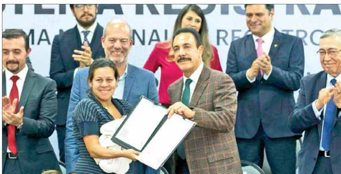
SISTEMA. Es Hidalgo número uno en aplicación de plataforma para registro nacional, destacó el gobernador Fayad.