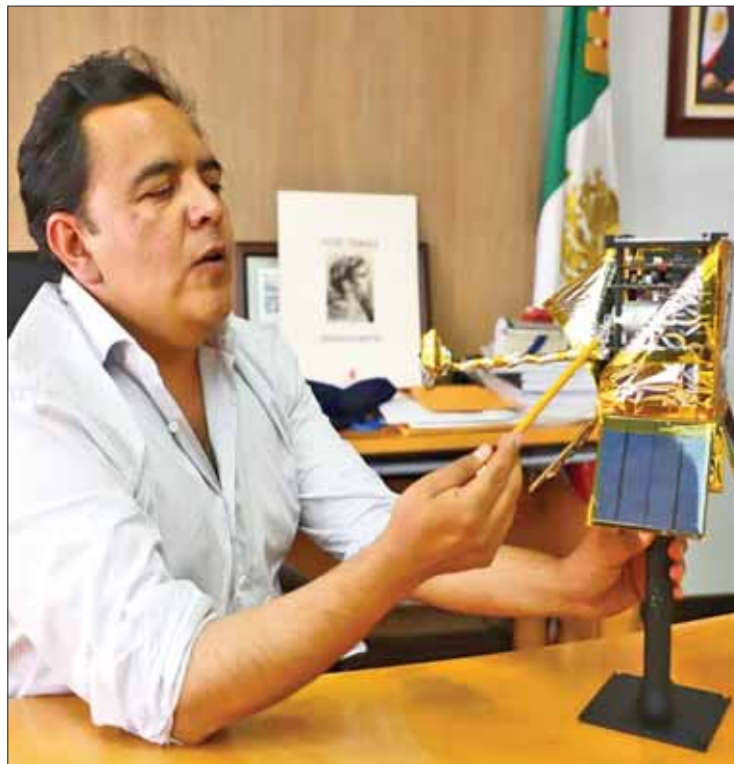
VENTAJAS. Permitiría elevar la investigación científica y tecnológica.

El aparato fue diseñado y construido en el Laboratorio de Instrumentación Espacial (LINX) del Instituto de Ciencias Nucleares