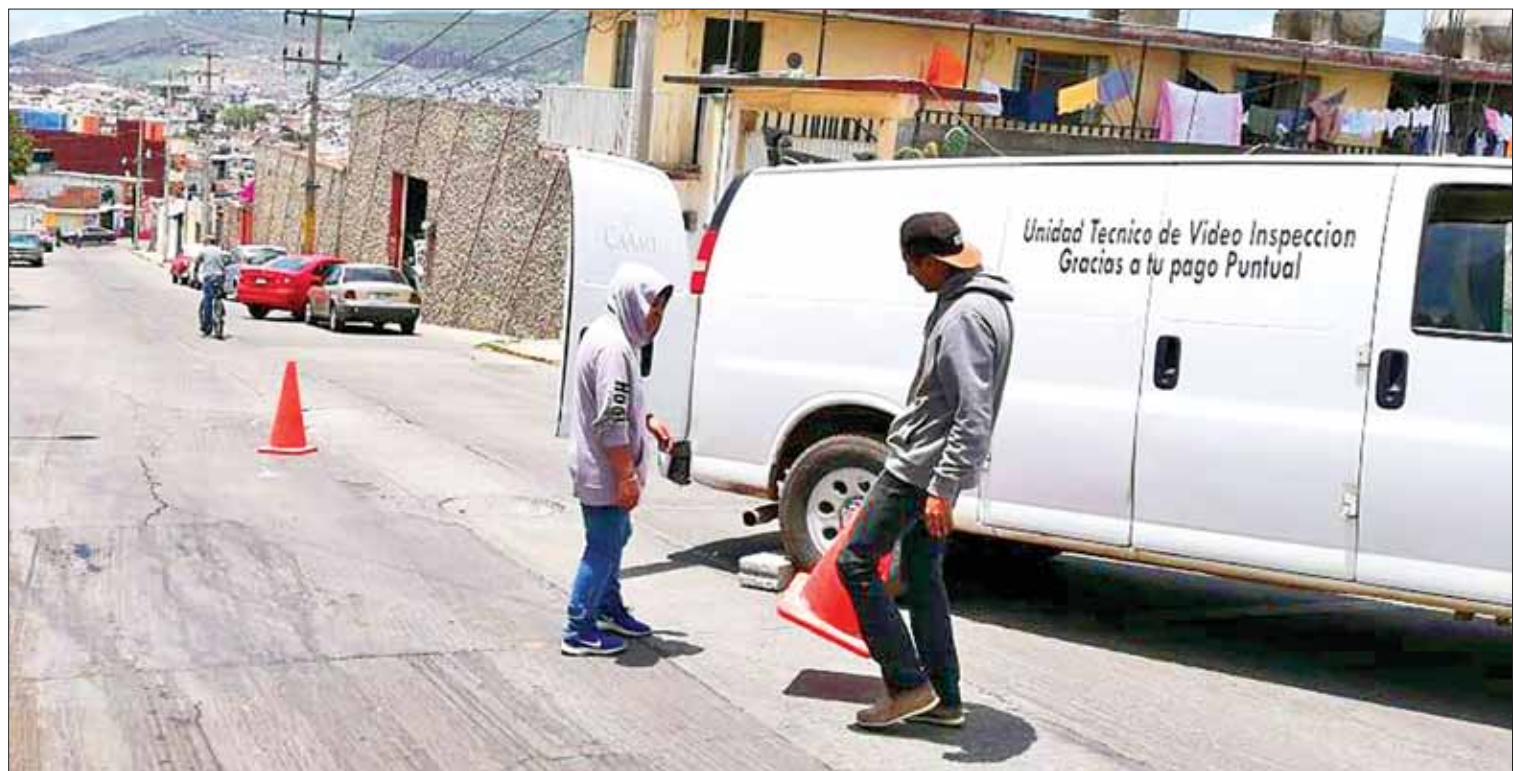
TECNOLOGÍA. Ubica con precisión las fallas en tubería, así como agrietamientos o desgaste en las mismas.

Indicó que los vecinos han externado su malestar ya que muchos consideran que pueden significar un problema de sanidad pero existen diversas formas de erradicar el problema sin recurrir al sacrificio. (Milton Cortés)