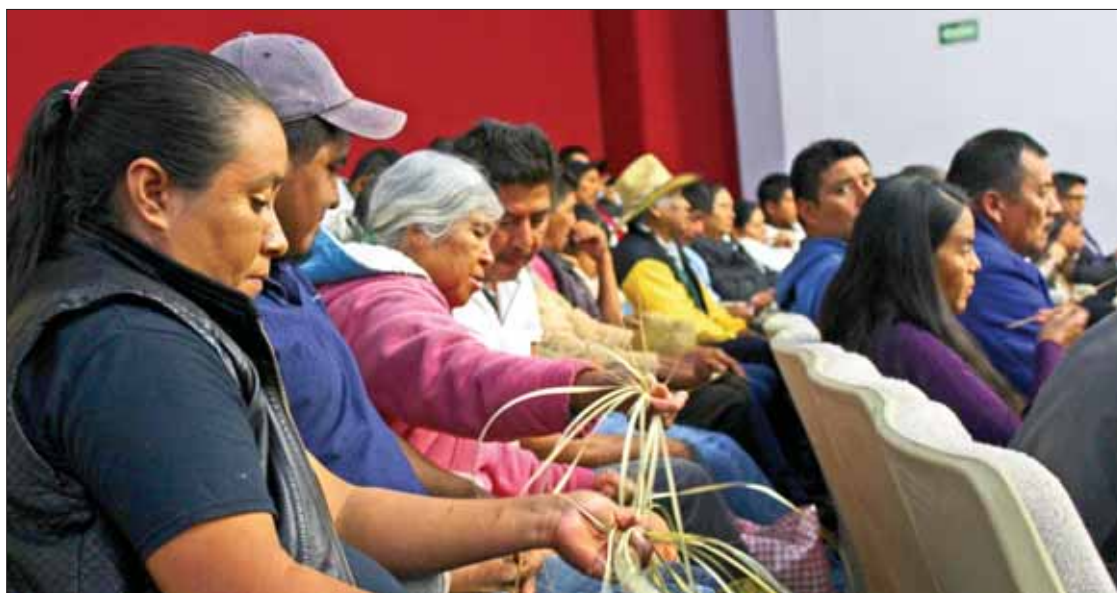
PRESENCIA. Prevalcen en la entidad otros dialectos como el náhuatl, otomí, hñahñu y demás variaciones.

"El gobernador lo anunció como una nueva inversión, no es una nueva inversión como tal, solamente cambió la razón social, por lo que se mantienen fuentes de trabajo, estaba a punto de cerrar, digamos que la inversión es porque debe adquirir la concesión y activos que pertenecían a la empresa Peñoles, la cual ya estaba aquí".