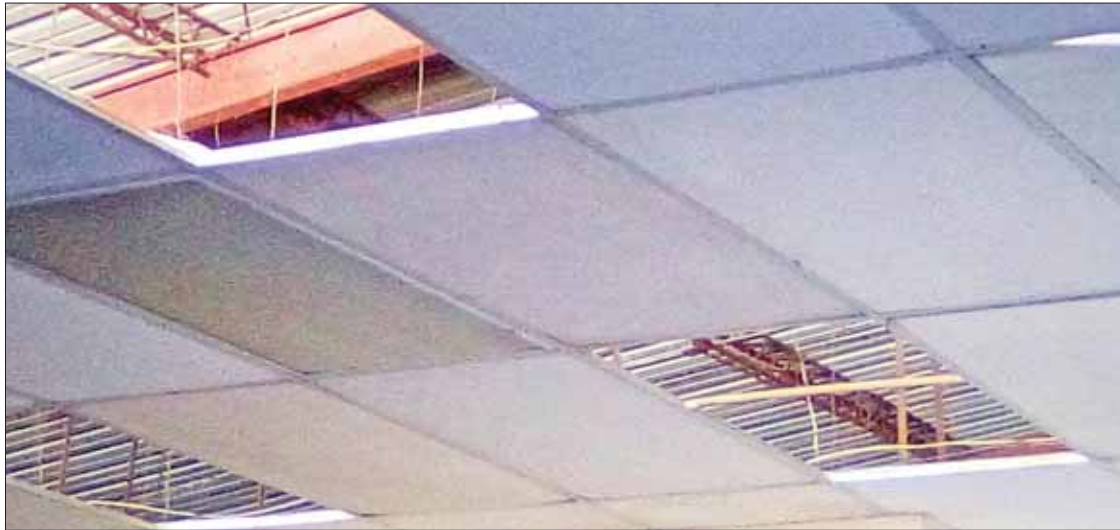
RASGOS. En la Unidad Deportiva de la comunidad San Primitivo invirtieron más de 30 millones de pesos y se edificó en al menos tres etapas.

► A casi cinco años de su terminación sigue como elefante blanco : diputada