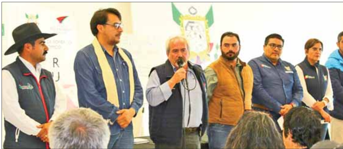
AMBIENTE. Con esta metodología se persigue que el productor esté involucrado en la toma de decisiones y no sólo sea observador de la implementación de programas.