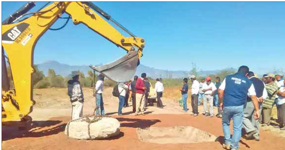
SAN NICOLÁS. Los vecinos dicen sentirse engañados, ya que no ven avances en esta obra, misma que sólo se quedó con la colocación de la primera piedra.

Indicaron que para abril de 2017, en comunidades de San Nicolás, se efectuaron los respectivos pronunciamientos oficiales