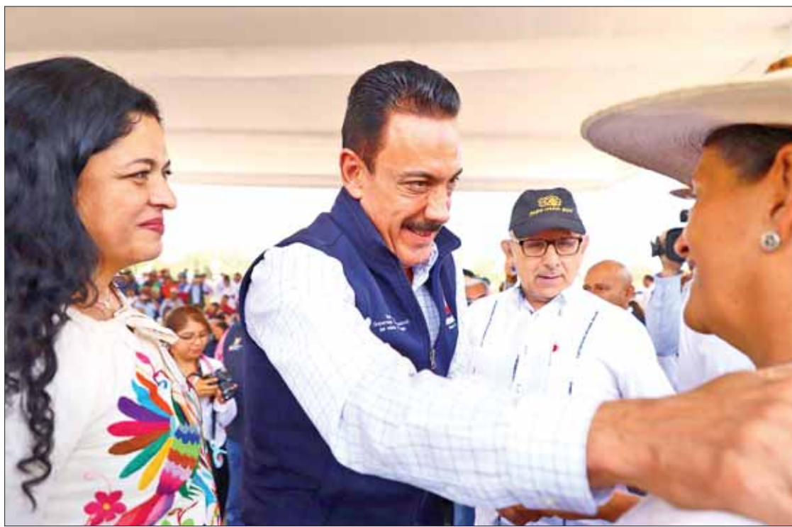
PERSONALIDADES. También acudieron Alejandra Frausto, secretaria de Cultura; y Luisa María Alcalde, secretaria del Trabajo.

AUDIENCIA. Más tarde el gobernador, en la misma jornada de trabajo, estuvo de visita en el municipio de Tepeji del Río, donde