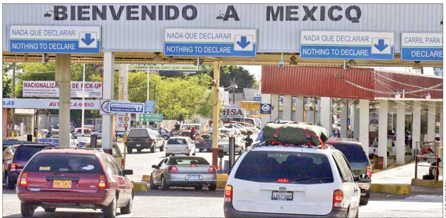
NÚMEROS. Reveló De la Vega que ya van más de mil 900 regresos de hidalguenses al estado desde aquella nación, sólo en este año.

No es la primera vez que migrantes de Nicolás Flores mueren en su intento por cruzar la frontera; el 23 de julio de 2017 otro migrante de esa demarcación pereció al intentar cruzar la frontera de manera ilegal, quien junto con más de 30 migrantes fue abandonado al interior de la caja de un tráiler en Texas, Estados Unidos.