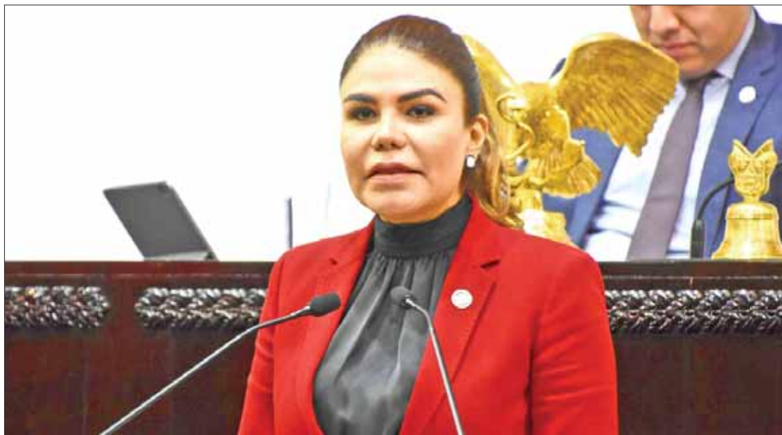
COMPROBACIONES. Recordó que la normativa considera excluir de dicho pago en ciertos supuestos.

Aunque la normativa considera excluir del pago en ciertos