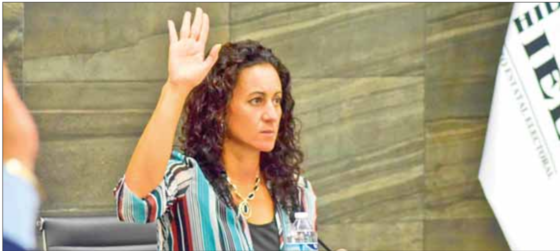
ACLARA. Preciso Vázquez que derechos y obligaciones sobre sufragio ya son consideradas por Constitución.

► Indicó el IEEH que propuesta para castigar a quien no vote debe someterse a discusión, aunque es excesiva