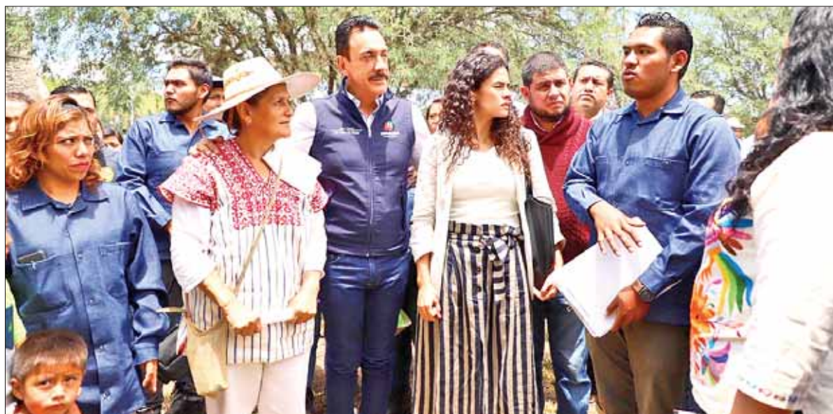
Reconoció Fayad importancia de que el presidente López ponga en marcha programas que beneficien a la juventud mexicana, al tiempo de que participa y contribuye con el rescate de zonas arqueológicas.