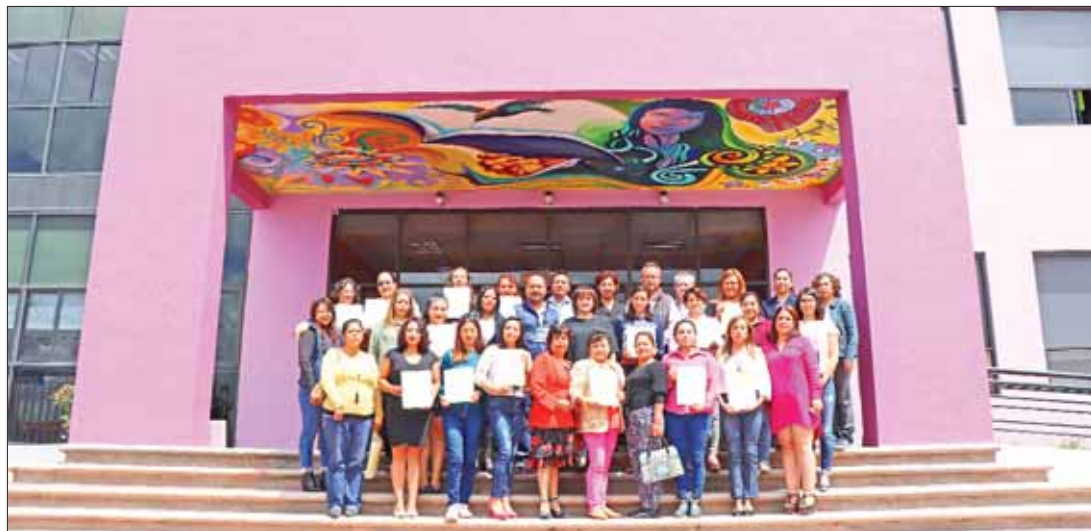
MANERA. Brindan CJMH y Cecati herramientas para desarrollar el emprendimiento.