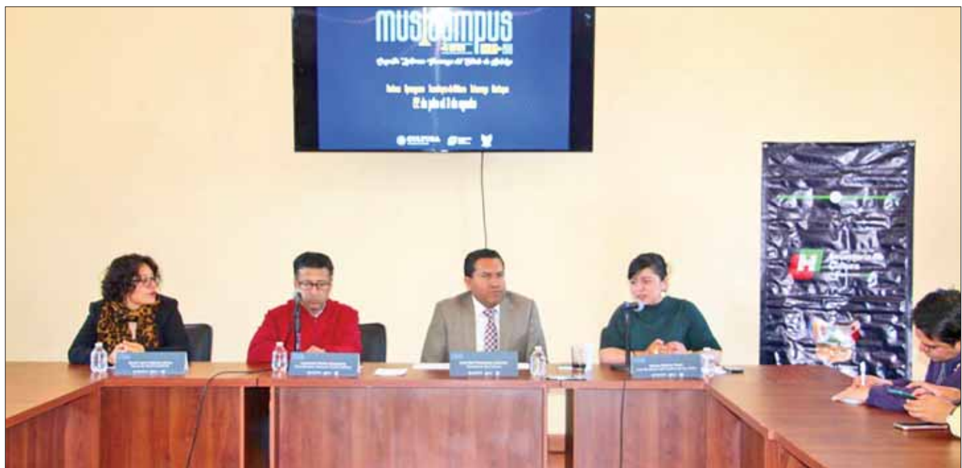
MODELOS. Llama Cultura Hidalgo a Orquestas Sinfónicas Juveniles a participar.

Durante las dos semanas de trabajo, se desarrollarán en promedio de 22 clases diarias de cada uno de los instrumentos que comprenden la orquesta sinfónica, nueve ensayos seccionales, once ensayos tutti y tres ensayos generales; haciendo un total de 176 horas de clase diarias, considerando ocho horas de clase por instrumento y ensayos; haciendo un total de 2112 horas en total por las clases grupales, clases magistrales, ensayos generales de tutti y conciertos, además de recitales con el cuerpo docente y maestros invitados, y conciertos la orquesta integrada por los estudiantes durante el curso.