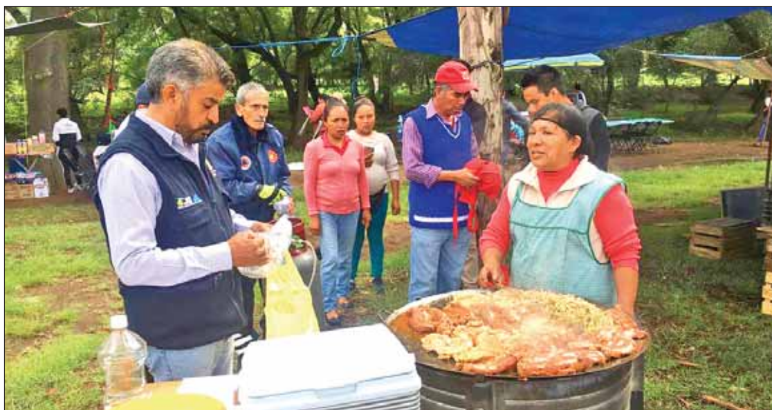
PREVENCIÓN. Mediante la Copriseh resolverá situaciones que pudiesen presentarse durante este recorrido.

En la región del Valle del Mezquital ya son varios los suicidios que se han registrado, tal es el caso de los ocurridos en Actopan, Cardonal y Huichapan, donde también se han reportado varios casos donde personas jóvenes se quitaron la vida.