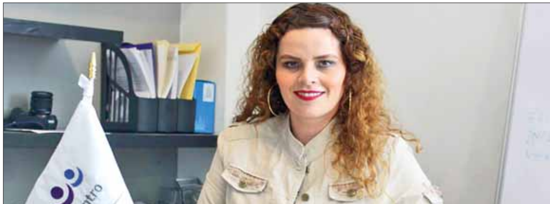
REPUNTE. Indicó Montiel que continúan con el trabajo para fortalecer sus comités municipales.

Por ello la entonces LXIII Legislatura quitó del cargo a la funcionaria, quien recurrió a diferentes instancias jurídicas para ampararse; en febrero de este año resolvieron tal asunto y confirmaron que es facultad soberana y constitucional del Congreso efectuar las remociones y designaciones de consejo. (Rosa Gabriela Porter)