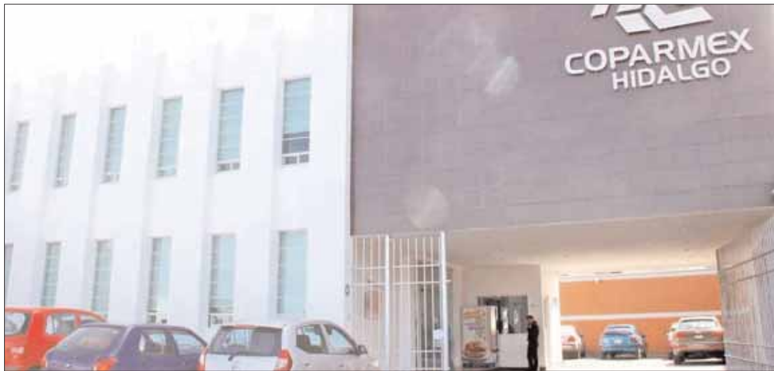
EJEMPLOS. Recordó que organismos como INEGI y Coneval hoy padecen las consecuencias más graves.

Más allá de premisas ideológicas, cualquier toma de decisiones en el ámbito gubernamental debe estar basada en datos y contener un sustento teórico y técnico.