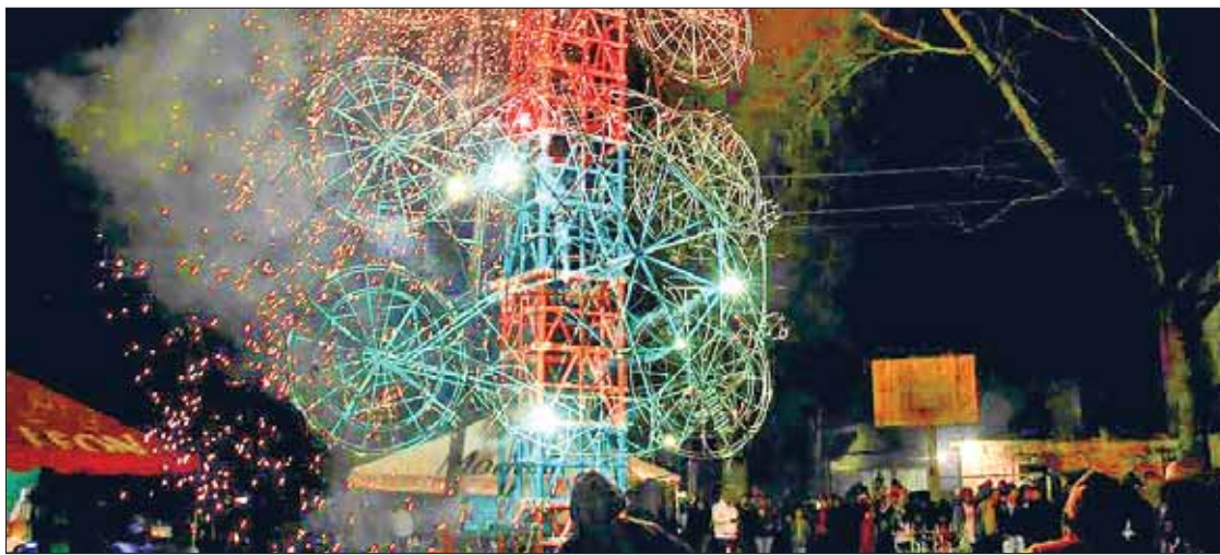
CELEBRACIÓN. Tiene el municipio diferentes atracciones para visitantes locales y foráneos.

► Este sábado participarán artesanos de la pirotecnia en un vasto concurso de castillos en la demarcación