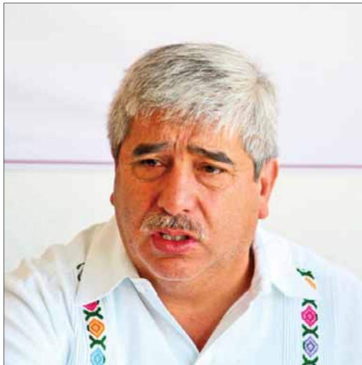
ESTUDIO. Indicó que es una propuesta a definir entre el presidente y el gobernador.