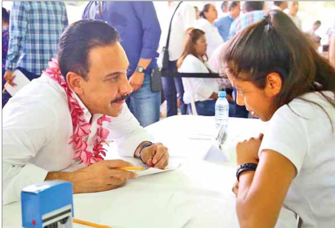
INSTRUCCIONES. Acompañaron al mandatario integrantes del gabinete para dar solución oportuna a varios temas.

En esta ocasión el gobernador Omar Fayad entregó cheques simbólicos por más de 2 millones de pesos para equipamiento y remodelación para el Hospital Integral de Atlapexco, el Hospital General de Huasteca y el Centro de Salud de Zacatipa. Durante la audiencia se ofertaron 919 va-