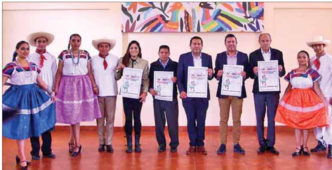
FESTIVAL. Asistirán al encuentro músicos de diversas regiones para demostrar sus habilidades.