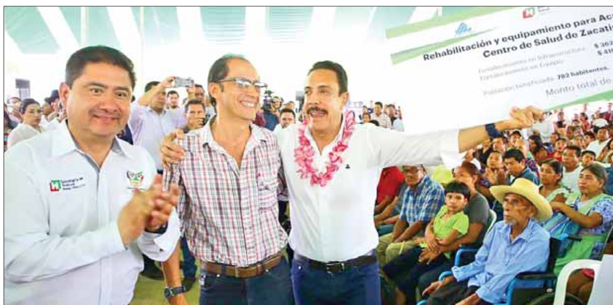
Entregó Omar Fayad diversos apoyos en beneficio de población, durante su audiencia pública.