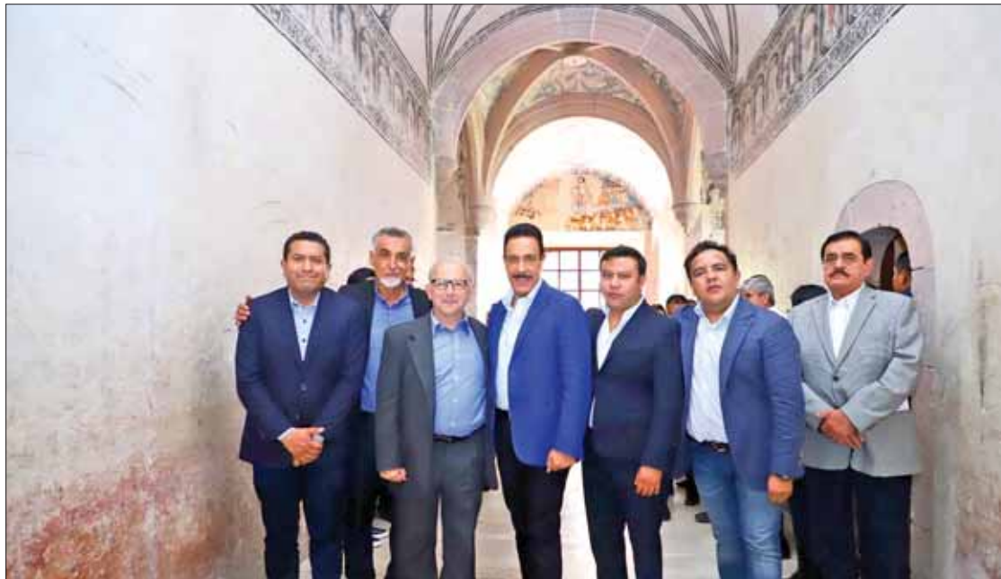
ATENCIÓN. Solicitó el gobernador el respaldo institucional para procurar sitios como Tula, donde están los atlantes.

Hidalgo es pionero en impulsar el turismo religioso con oferta de 52 conventos, pertenecientes a agustinos y a franciscanos principalmente; subrayó la riqueza cultural y religiosa de municipios como Metztlán, Alfajayu-