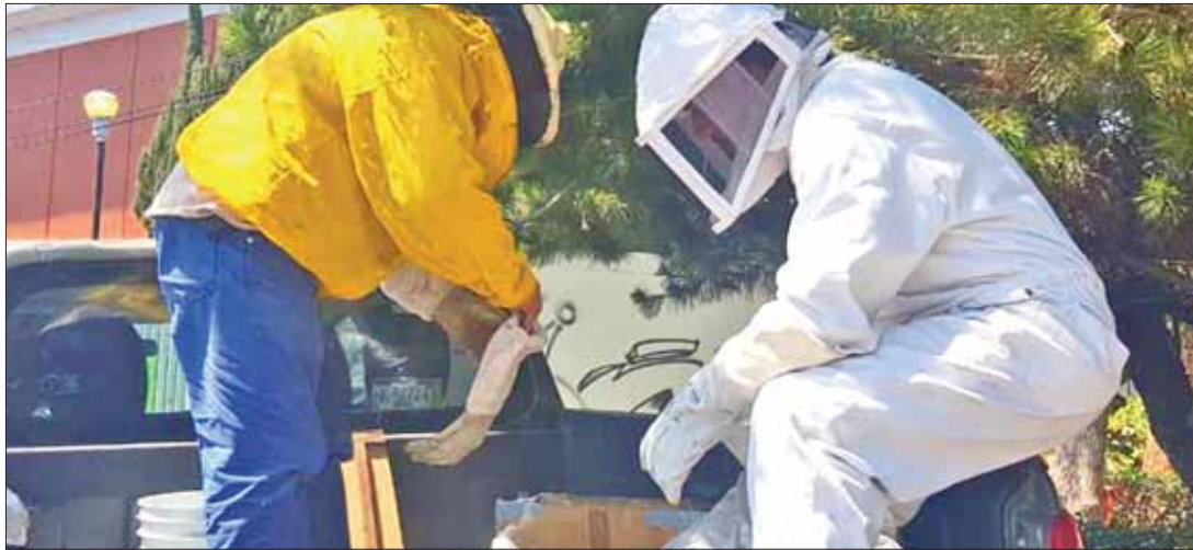
POLINIZACIÓN. Dichas acciones son vistas como ejemplares por otros municipios a favor del tema ecológico.