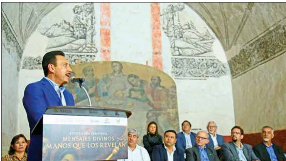
Subrayó mandatario estatal, desde Actopan, la gran riqueza con que cuenta Hidalgo en culturas y legados históricos.

La muestra exhibirá el trabajo realizado para recuperar mensajes, historia y el arte que enriquece los bienes culturales, con intervención de especialistas.