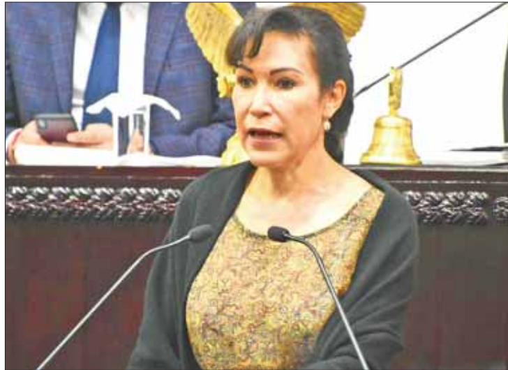
CANALES. Dicho planteamiento fue formalizado ante Congreso de la Unión.

Dentro de los argumentos señaló que el país cuenta con un Sistema Nacional de Salud, empero existen limitaciones en los servicios y coberturas que ofrecen a los derechohabientes.