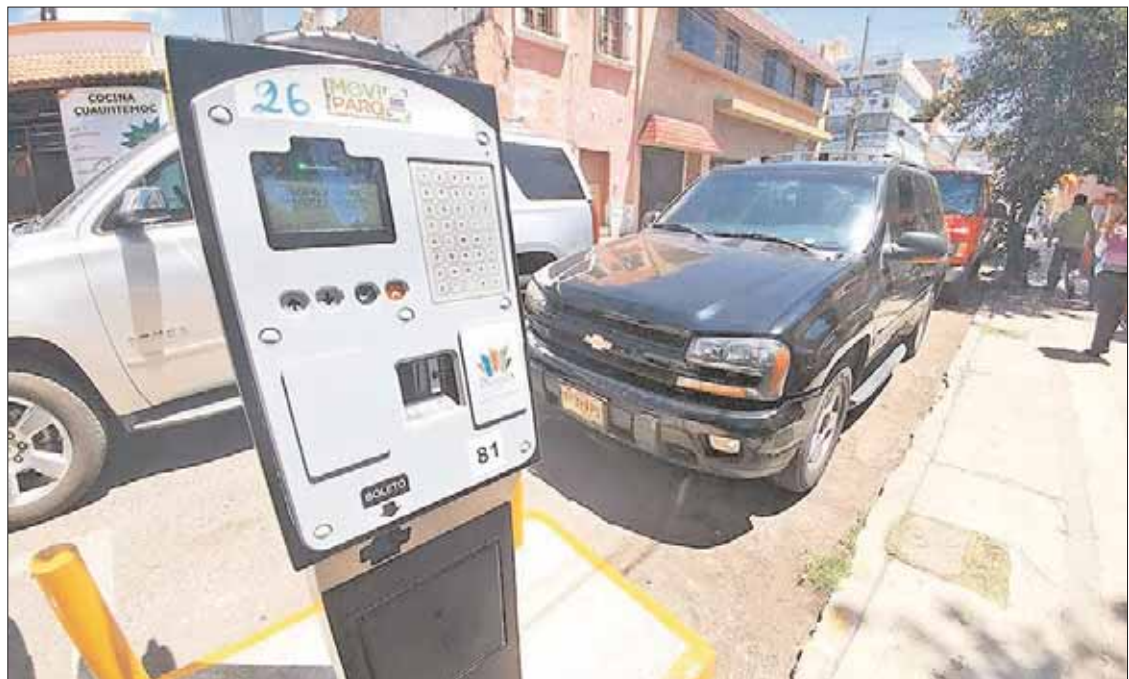
CAMINOS. Habitantes del Centro, así como algunos comerciantes, mantendrán el respaldo a los vecinos de la colonia Periodistas.