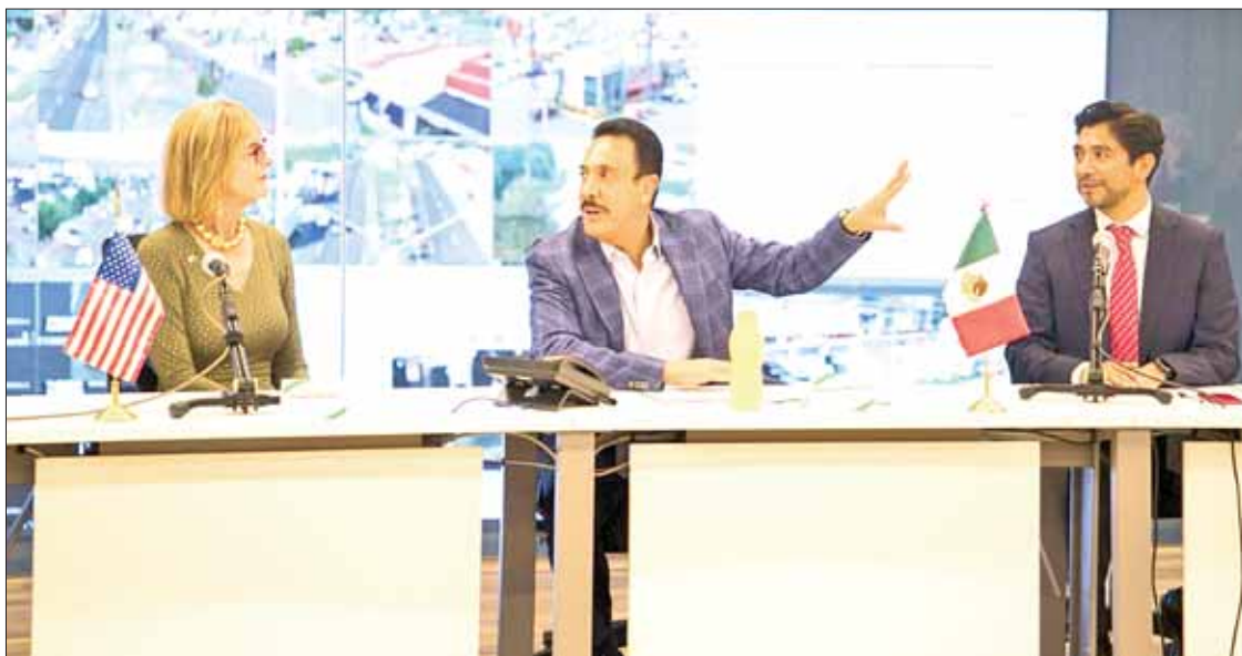
ACIERTOS. Estrategia de Omar Fayad para atraer inversiones y reactivar la economía estatal.

► Colaboraciones en materia agropecuaria, tecnología agrícola, energía y manufactura