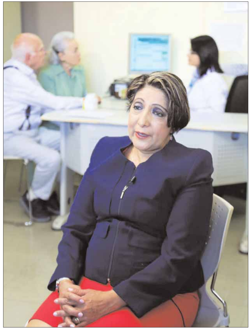
MEDICIÓN. Entre abril de 2017 y el 30 de junio de este año, se ha logrado 95 por ciento de curación en los derechohabientes con este tratamiento

También se padece hepatitis por el consumo excesivo de alcohol y la alta ingesta de los alimentos ricos en grasa; en todos los casos, se produce inflamación del hígado que lleva a fibrosis (cicatrices), cirrosis (destrucción de células), falla hepática e incluso cáncer.