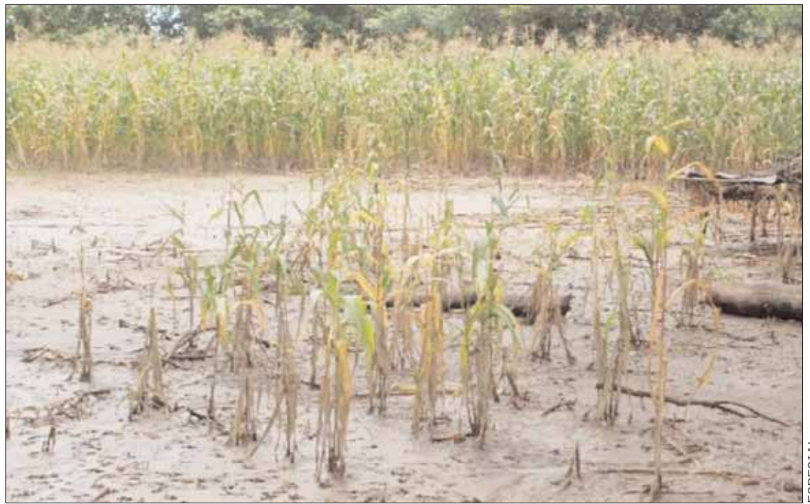
ATENCIÓN. El llamado a los campesinos y productores del estado es que se inscriban a este programa

lluvias registradas, mismas que serán valoradas para el correspondiente pago.