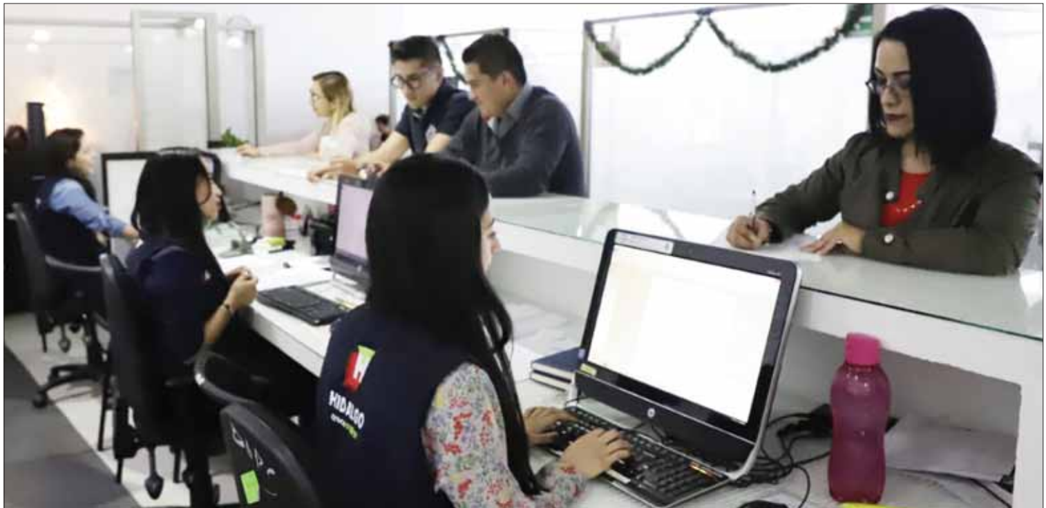
DESTINOS. Una de las premisas es procurar una justicia pronta y sin contratiempos.

La STPSH refrendó el compromiso hacer valer los derechos de las y los trabajadores de la entidad en las distintas instancias del aparato de justicia laboral.