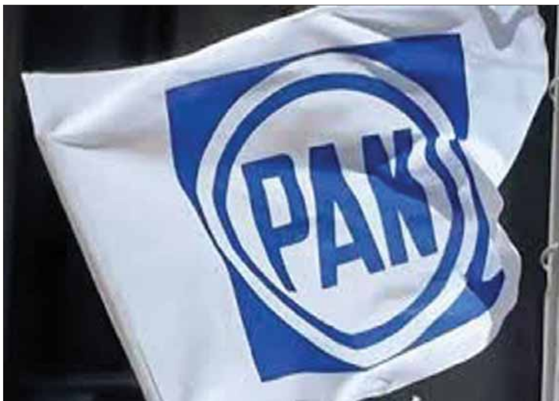
NÚMEROS. Actualmente el Registro Nacional de Militantes pormenorizó 283 mil 205 en todo el país y en Hidalgo, 3 mil 925.

Dicho proceso lo efectuarán todo este año, pues la fecha límite refiere a enero de 2020, cuando el INE verifique y depure los listados de todas las cúpulas con registro nacional.