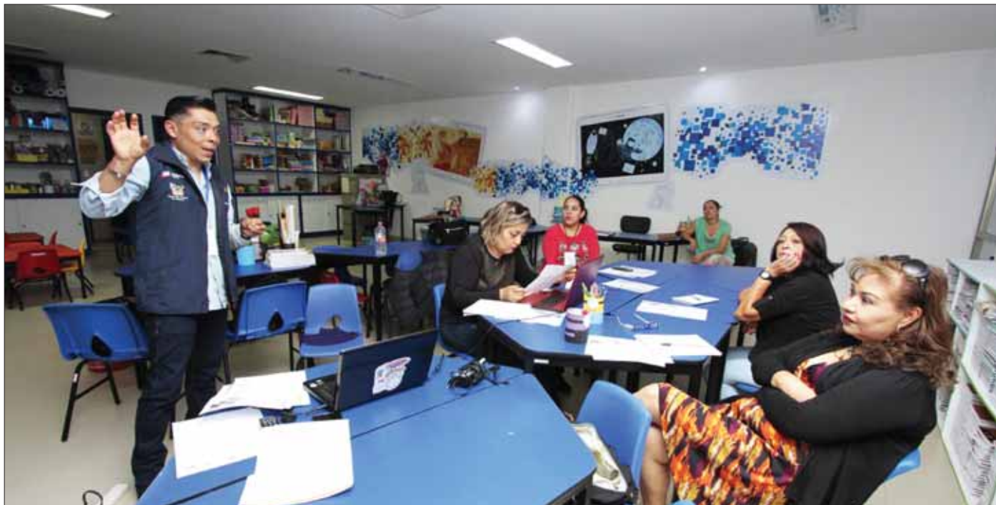
INTEGRAL. A maestras y maestros que forman parte del programa se les brindan cursos para que estén actualizados en los planes y programas educativos.