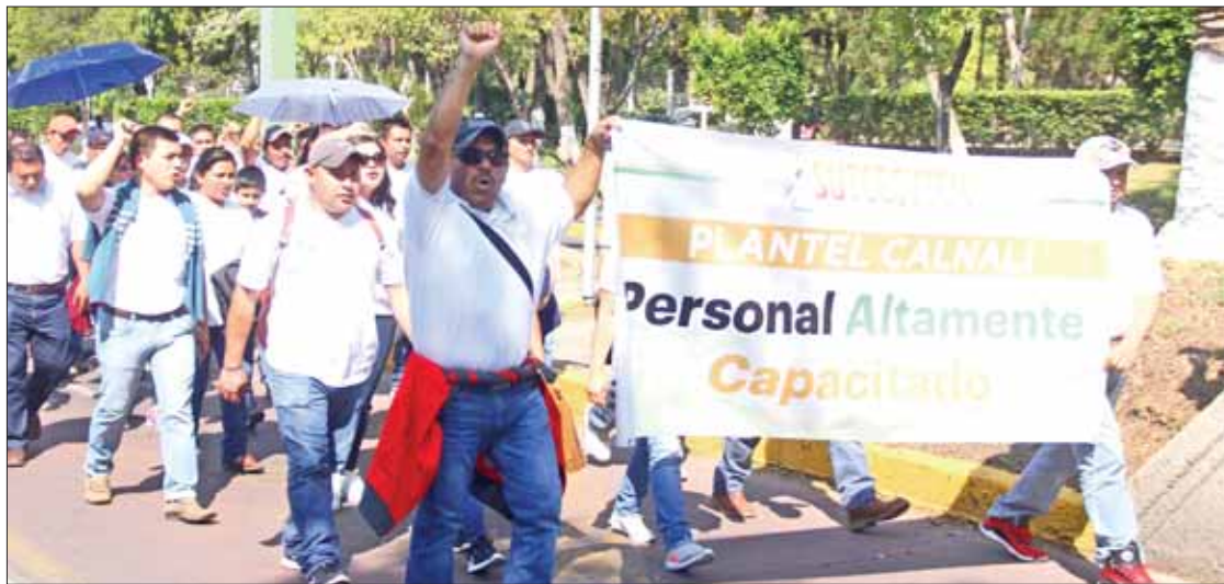
BONOS. Presentes integrantes del sindicato hidalguense en marcha por la defensa de temas laborales.

La UICEH se ha caracterizado por ser una institución que impulsa la movilidad internacional en sus estudiantes a la vez que enfatiza la vinculación con las comunidades. Cuenta con un modelo educativo dinámico para dar atención pertinente a jóvenes tanto de origen indígena como de otros sectores sociales. (Adalid Vera)