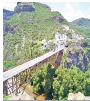
ingeniero Gerardo del Arenal, obra que ya anteriormente había sido ocupada para otras filmaciones. (Hugo Cardón)

Este puente, el cual se localiza sobre la carretera México-Nuevo Laredo, fue una obra federal del periodo presidencial del general Lázaro Cárdenas, diseñado por el