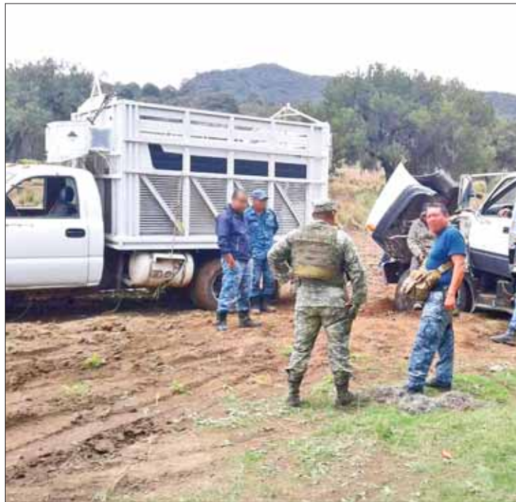
REPORTES. Detalló Ejército situación legal de estas unidades.

En el decomiso incluyeron 77 contenedores con capacidad de mil litros, presuntamente utilizados para traslado del combustible extraído ilícita-