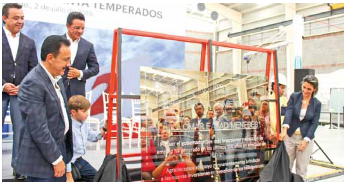
PLATAFORMAS. Notorios temas como el PIB, lucha contra desempleo y facilidades empresariales.

Recordó que cuando llegó al gobierno estatal tenía el reto de propiciar el arribo de nuevas inversiones, hoy es una realidad