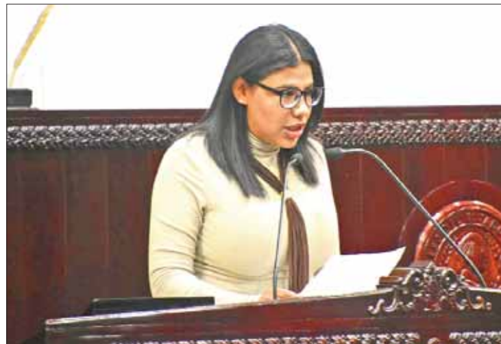
ÁMBITOS. Solicitó Miranda constreñir entrega, realizar exámenes y elevar sanciones.

"Esto es para tener como meta disminuir índices de siniestralidad, crear conciencia en una nueva cultura en seguridad vial,