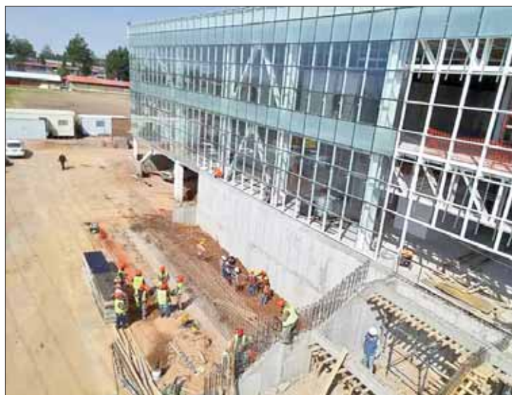
RECONOCE. Informó que con este nosocomio atenderán déficit y sobresaturación.

"El chiste es que con este hospital se subsanen muchas de las deficiencias y sobresaturación, que no es secreto para nadie, en la Clínica 1 estamos sobresatura-