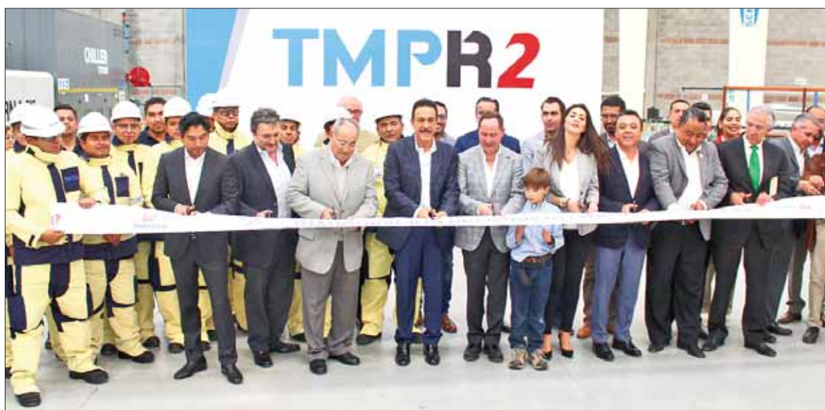
Reiteró mandatario estatal un total de 42 nuevas empresas, que generarán 53 mil empleos para los hidalguenses.