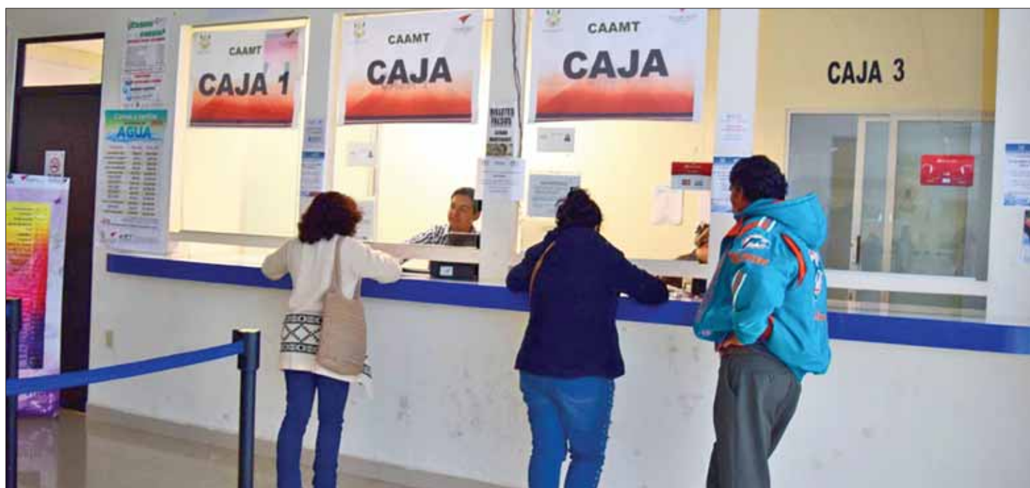
ESTRATEGIA. Informó además que con la caja móvil llegó la dependencia a 55 colonias de Tulancingo, donde recolectó 1 millón 200 mil pesos.

Mientras que la medalla de plata la consiguió en la prueba de 200 metros libres, con un registro de 2:07.09 minutos, el primer lugar fue para la nadadora Logan Watson-Brown de Bermuda, con tiempo de 2:06.33 minutos. (Redacción)