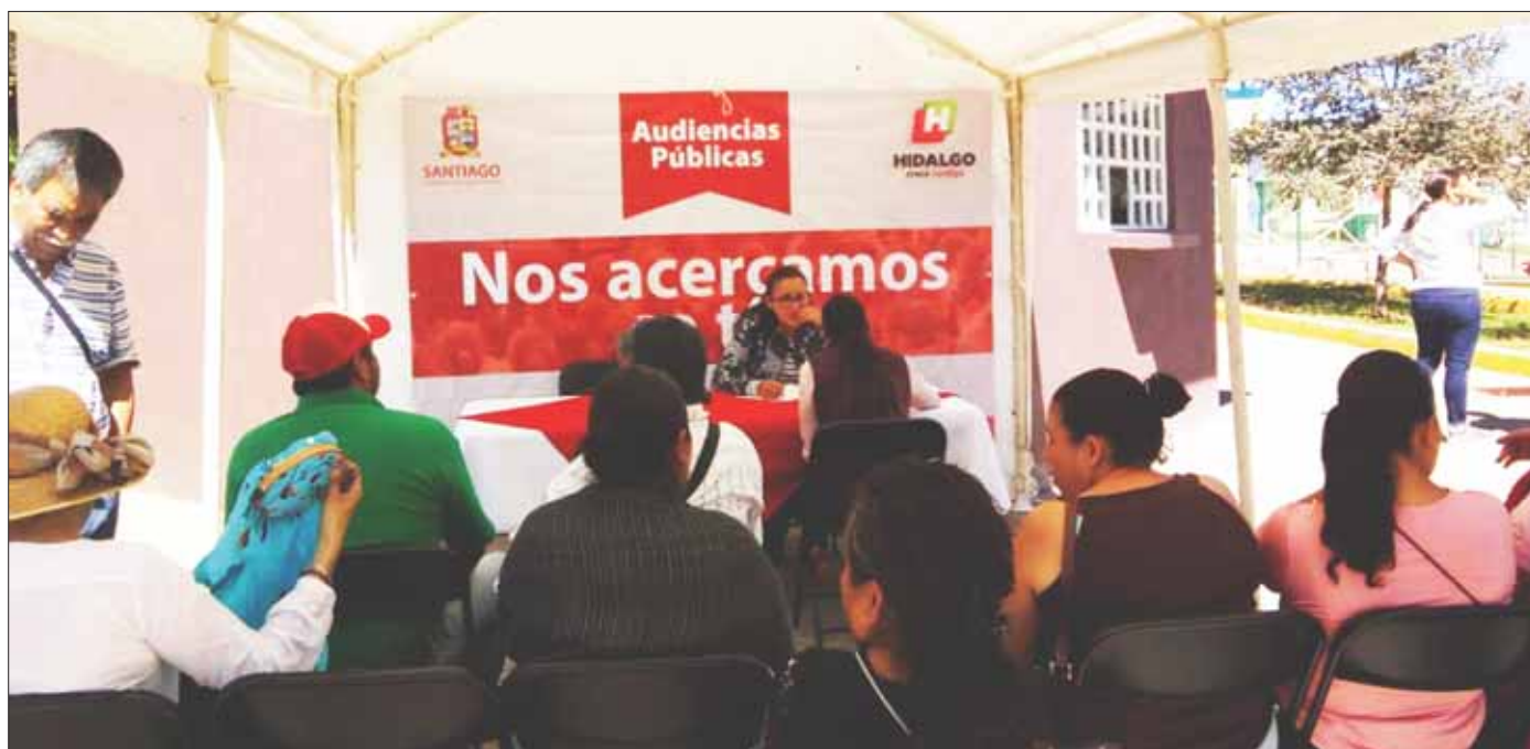
SENTIDOS. Invitan a toda la población a asistir para consolidar un gobierno basado en la participación social.

Sumado a esto, continúan las audiencias públicas en las instalaciones de presidencia municipal todos los martes de 08:30 horas a 16:00 horas y los jueves en las nuevas oficinas de enlace de la colonia Unidades Habitacionales.