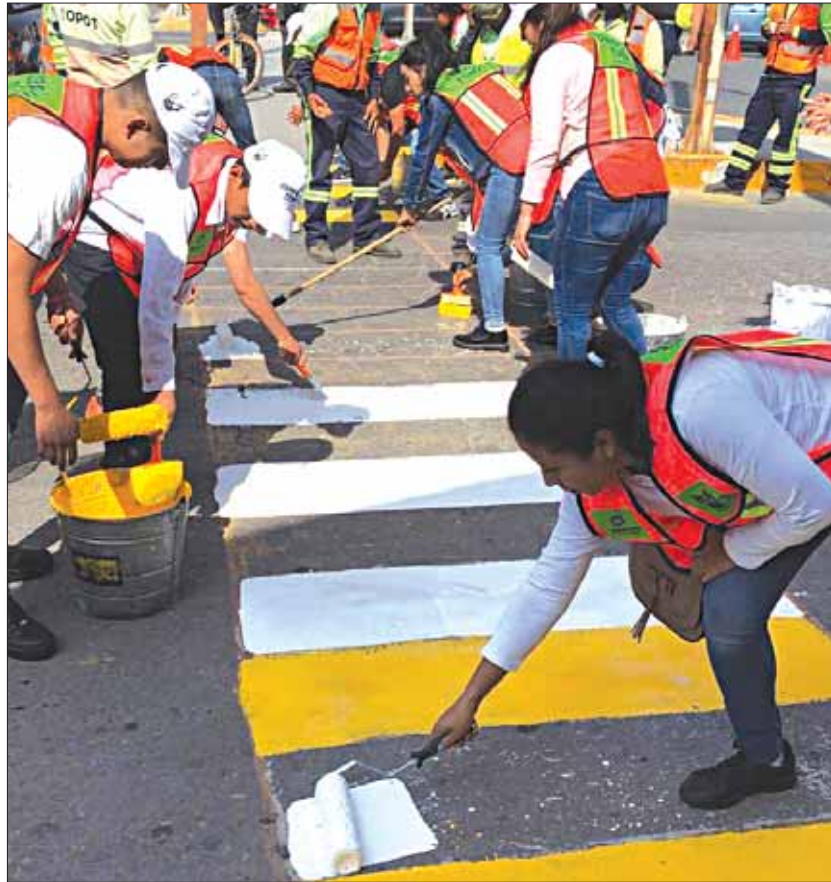
CARACTERÍSTICAS. Tomaron el 17 de agosto, como fecha de arranque, por ser conmemorativo al Día Mundial del Peatón, para presentarlo como una estrategia estatal conjunta.

Actividad forma parte importante en el desarrollo de la Estrategia Integral de Movilidad