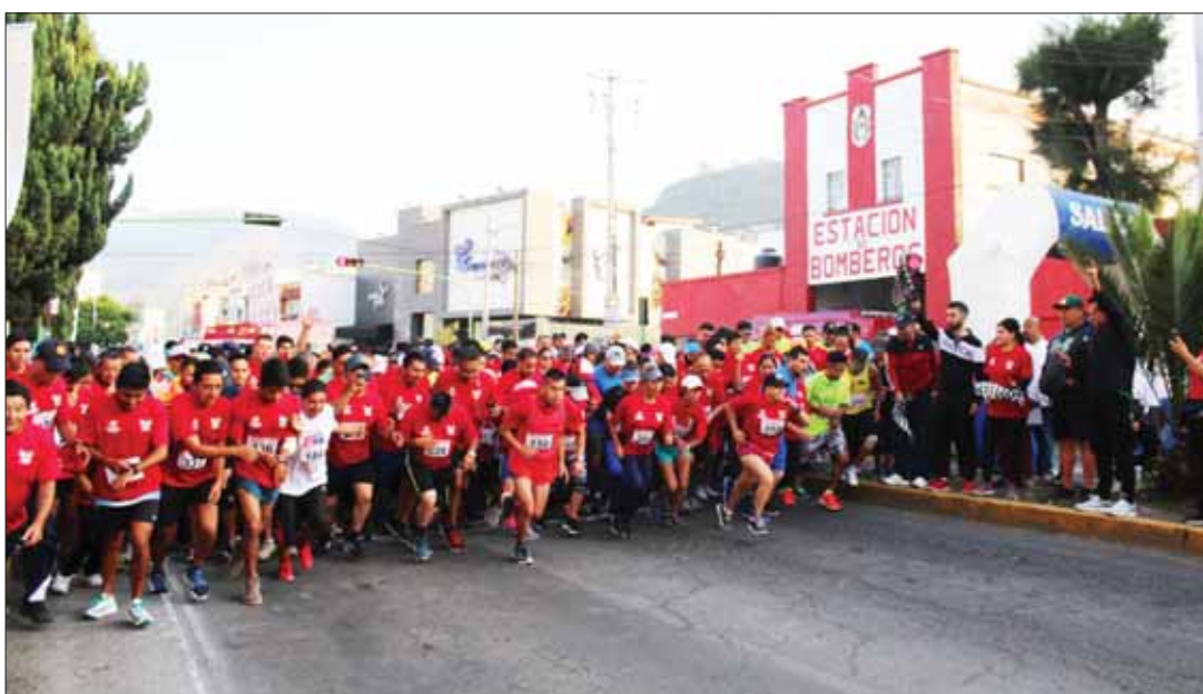
En el marco del Día Nacional del Bombero, se llevó a cabo la tradicional Carrera Atlética 10K del H. Cuerpo de Bomberos de Hidalgo, con la participación de más de 400 competidores.

Para los habitantes de la zona Tula, conformada por al menos nueve municipios más (Ajacuba, Atitalaquia, Atotonilco, Tepetitlán, Tetepango, Tepeji, Tezontepec, Tlahuelilpan y Tlaxcoapan) el gobierno no hizo más que reconocer lo que ya se sabía desde hace décadas, que la antigua Capital Tolteca y su zona de influencia conforman una de las cuencas más contaminadas del planeta. Incluso, en 2008, la Organización de las Naciones Unidas (ONU) la reconoció como tal. .4-5