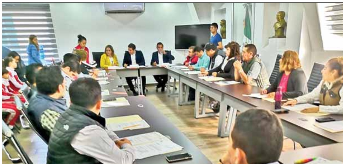
RAZONES. Plantea que el 15 de junio de 2019 pidió copia del Concretado del Presupuesto de Egresos 2019, por unidad administrativa, pero que se le contestó con una negativa por no especificar si quería copia simple o certificada.