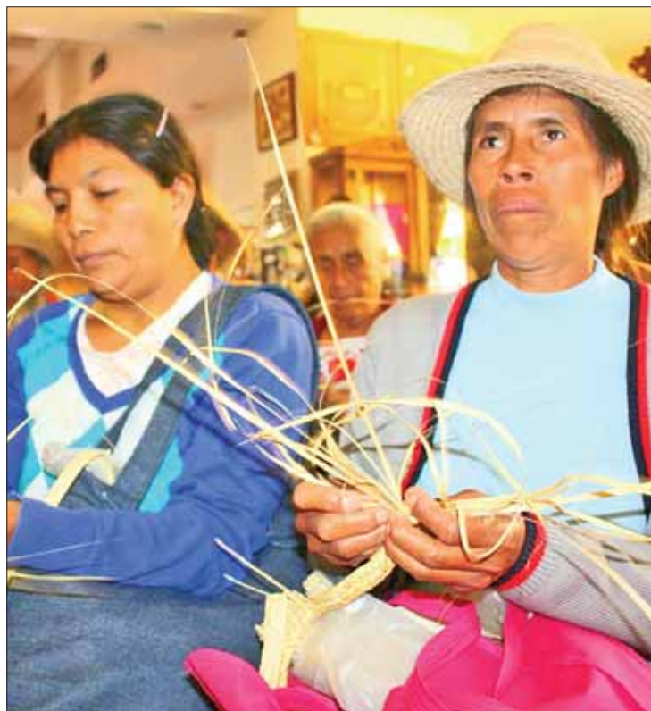
EXPO. Contarán con lugar que permitirá incrementar sus ventas y proyectarse.

Las personas interesadas podrán inscribirse del 19 al 30 de agosto en la Dirección General