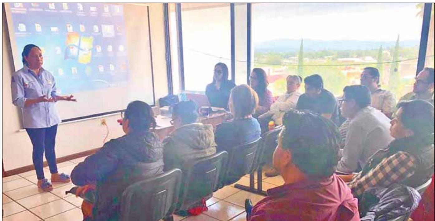
META. Actualizar conocimientos y brindar un panorama a los trabajadores del Primer Nivel de Atención.

PARTICULARIDAD. Sífilis, enfermedad curable y tratable por lo que la incidencia del problema puede reducirse mediante intervenciones eficaces; VIH, se puede transmitir al bebé durante el embarazo, en el nacimiento o durante la lactancia.