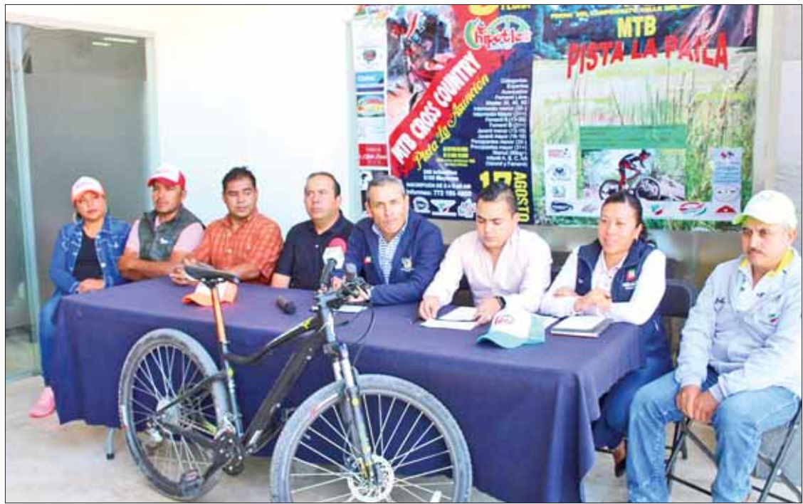
EXPOSICIÓN. Detallaron directivos requisitos a seguir y fechas en que desarrollarán este nuevo serial.

"En ambas rutas podrán apreciarse los lugares turísticos con los que se cuenta"