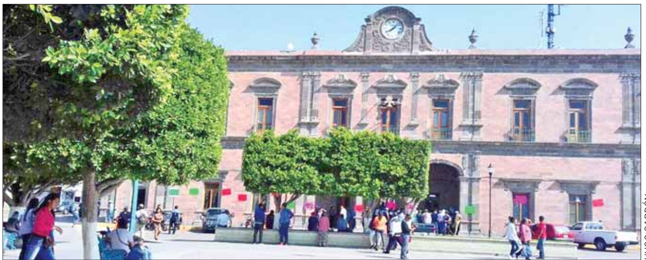
SÍNTOMAS. Tenemos un pueblo que a mí me da pena, opina exregidora al hablar sobre el comercio informal.

Cabe mencionar que al inicio de la actual gestión, el municipio vendía espacios en la vía pública: algunos vendedores se quejaron por las altas tarifas.