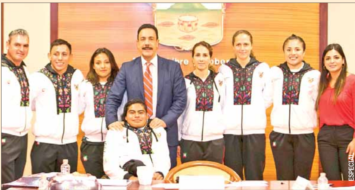
Distinguió mandatario estatal logros de atletas hidalguenses que abonaron al medallero, durante reciente competencia mundial.