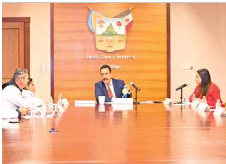
REUNIÓN. Ganadores acudieron a encuentro con el mandatario estatal en la capital del estado.

El Ejecutivo estatal exhortó a deportistas hidalgenses a man-