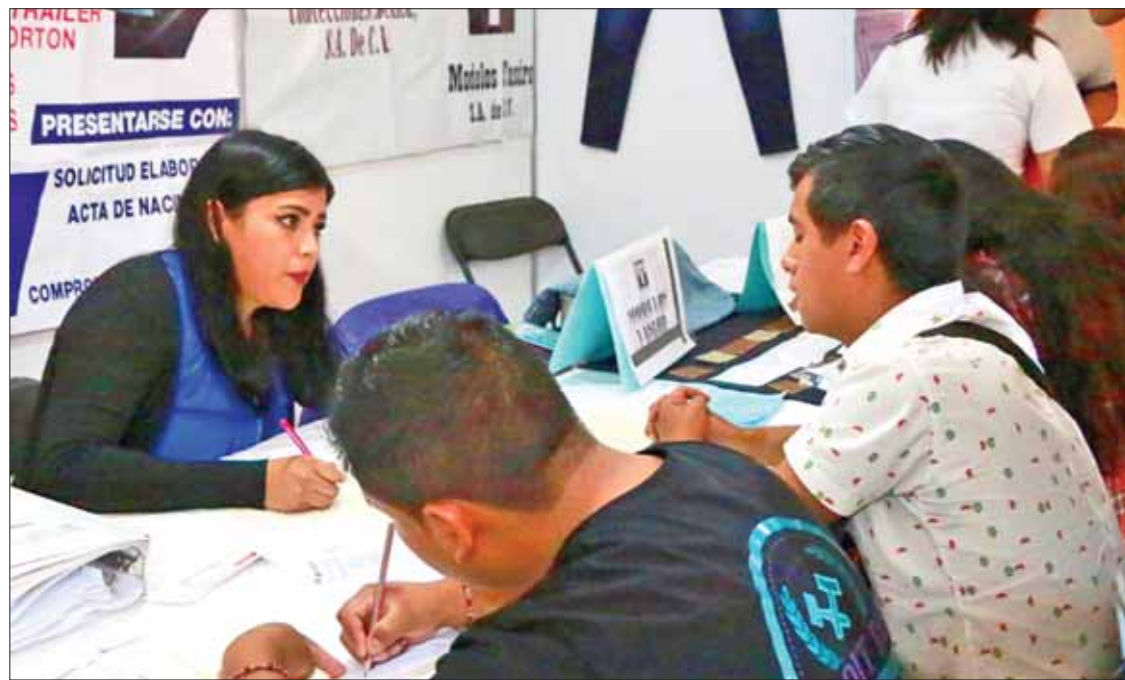
NORMATIVAS. No pueden exceder el 30 por ciento del salario del empleado ni generar intereses.

La LFT contempla en su artículo 110 descuentos por concepto de "deudas", en cuyo caso no podrán exceder el 30 por