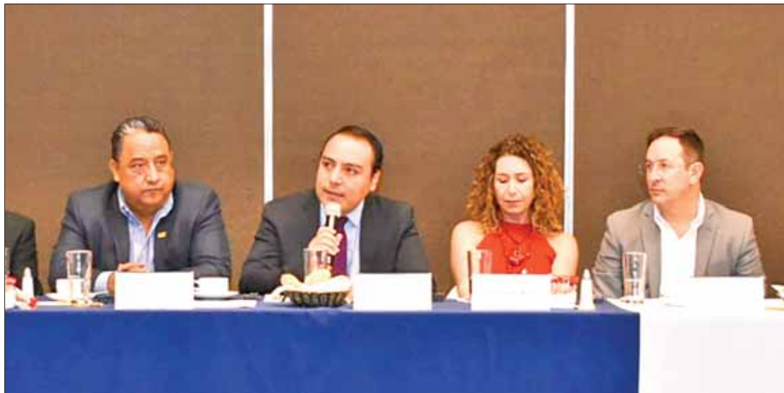
COMPLEMENTOS. Contempla el gobernador programas para permitir la competitividad y el ingreso de jóvenes al mercado laboral.

Además son rubros que pagan más económicamente; es decir, que son salarios 50 por ciento mayores si se comparan con los anteriores.