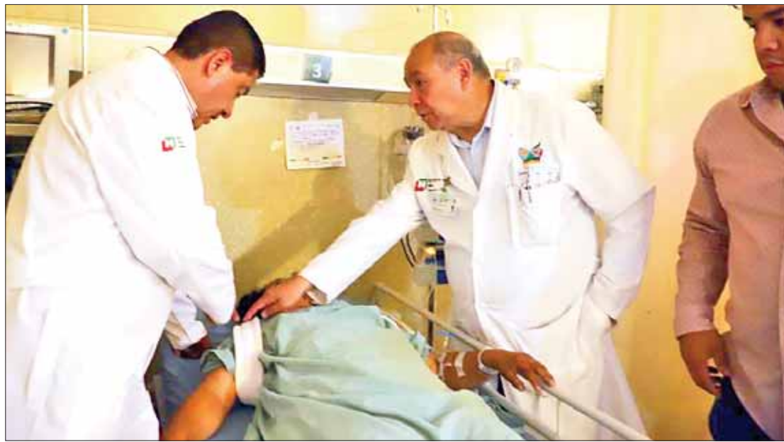
TRASLADO. Rápido actuar de autoridades estatales permitió llegada oportuna de personas que sufrieron percance.