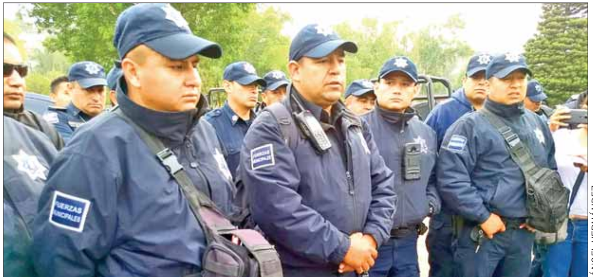
ARMAS. Detalló jefe de policía la implementación de dispositivos a favor de los pobladores.

A pesar de los operativos que se hacen en puntos aleatorios de la región Tula-Tepeji, en lo que va de agosto se han sufrido cinco asaltos al transporte público, donde los pasajeros son amagados con armas de fuego para ser despojados de sus pertenencias, concluyó el funcionario.