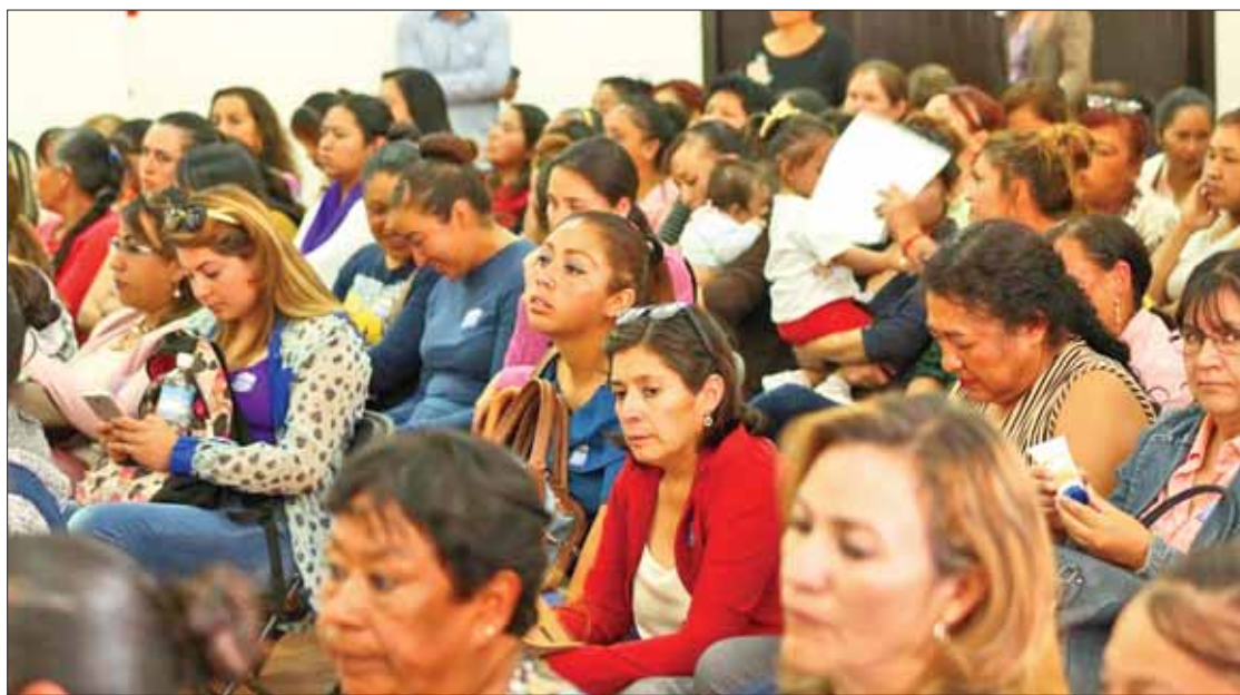
TRANQUILIDAD. Expusieron que cada agrupación está en su derecho de manifestarse como quiera o pueda.

Determinaron que en Pachuca, para fortuna, son pocos los grupos de feministas radicales y