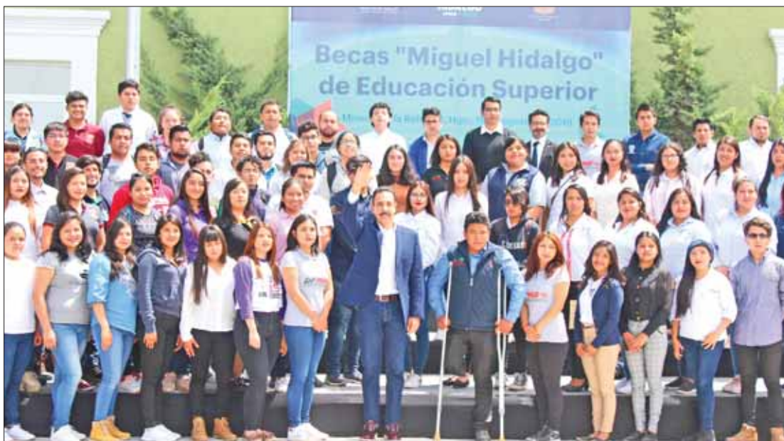
Destacó Omar Fayad esfuerzos de su administración para apoyar a la juventud hidalguense, con recursos propios.

Recordó que hace unos meses, jóvenes estudiantes de los Organismos Públicos Descentralizados y Desconcentrados en la entidad, en esa transición del sistema de becas federales, quedaron sin recibir el apoyo que necesitaban.