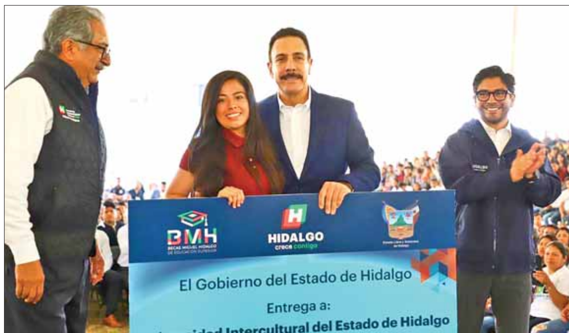
INSTRUCCIÓN. Recordó Fayad que muchos estudiantes quedaron sin apoyo, derivado de transición en federación.

Destacó que este programa de becas es posible gracias a las buenas prácticas en el manejo de las finanzas públicas, pues