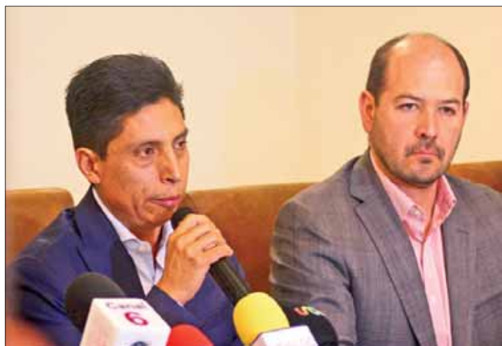
CONFIRMA. Indicó que la camioneta fue rentada por el ayuntamiento.

Reiteró su agradecimiento al gobernador Omar Fayad, así como a otros alcaldes e instancias del Poder Ejecutivo para apoyar a los afectados, además aclaró que todas las pesquisas del per-