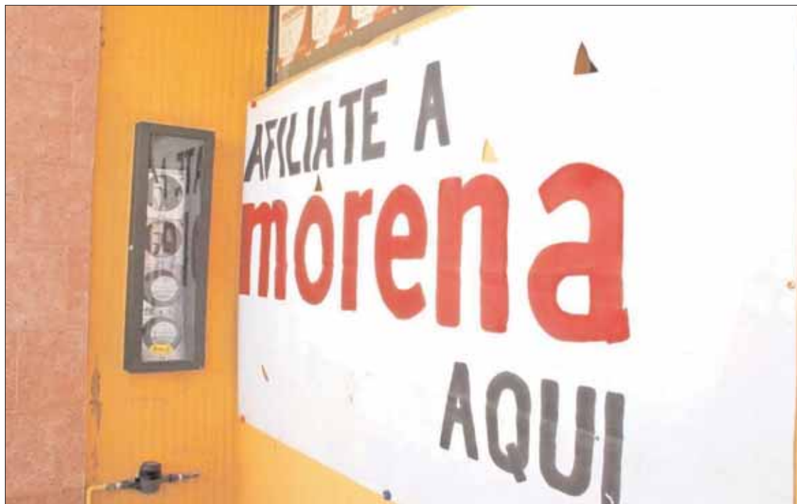
REQUISITO. Acudirían sólo aquellos que comprueben militancia dentro de padrones aprobados por el organismo.

En dicho oficio establecieron las fechas para los Congresos Dis-