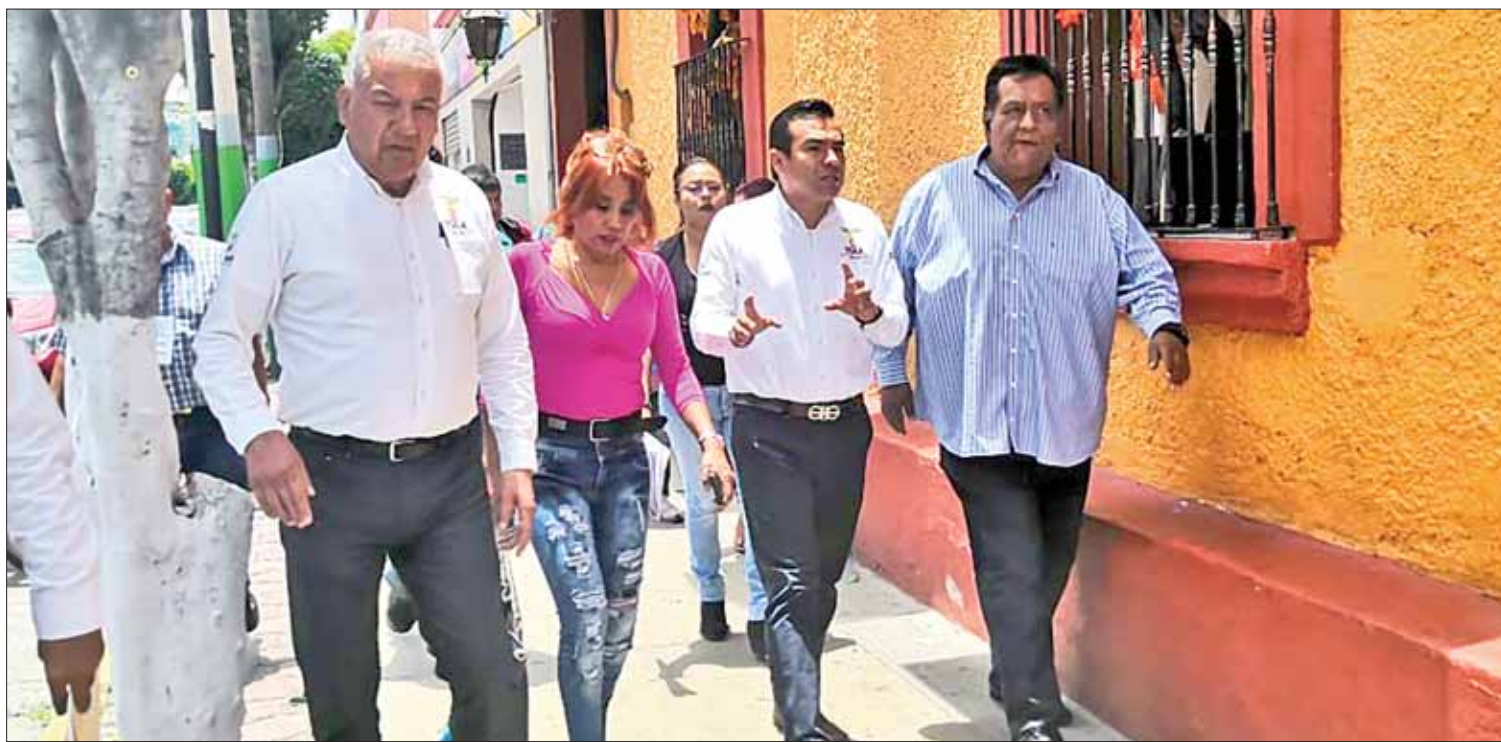
NEGATIVAS Personal del ayuntamiento escuchó algunas quejas en contra de la Dirección de Reglamentos, debido a su actuación.