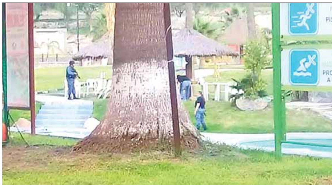
TRASCENDIDOS. También fue desmentido que hubiera cierres en algunas carreteras de estas demarcaciones.

Otro de los rumores que se presentó fue el del cierre de vías de comunicación estatal, por lo cual habitantes de estos dos municipios tomaron medidas y buscaron carreteras alternas; sin