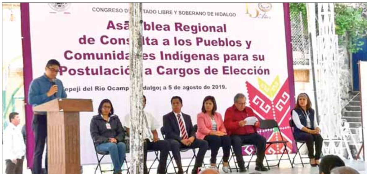
PARTICIPACIÓN. Además acudieron los presidentes municipales de varias demarcaciones al encuentro.

Las propuestas se recibieron en tres mesas de trabajo, las cuales tomaron en cuenta posturas para la elección de ayuntamientos por usos y costumbres, mediante partidos políticos y relacionados con el hombre y la mujer indígenas, con la igualdad y la paridad de género respecto a los cargos públicos.