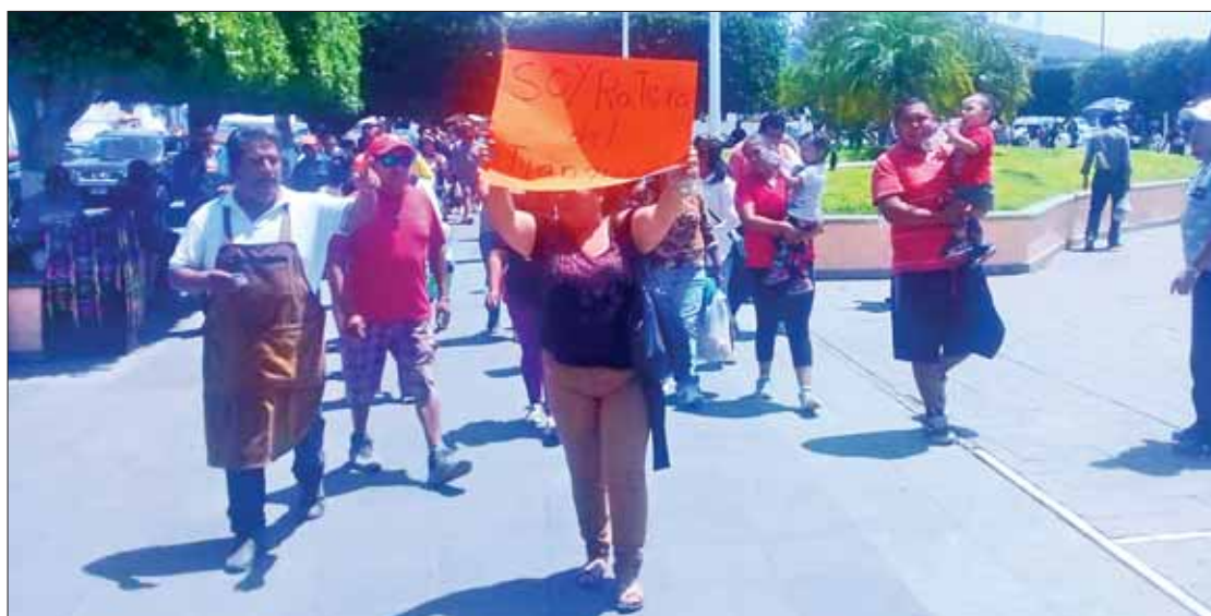
Presunta ladrona en tianguis de Ixmiquilpan fue sorprendida y detenida por vecinos, quienes le colocaron una cartulina con la leyenda soy ratera para exhibirla.

Al consultar enlaces de transparencia del portal de internet del Poder Legislativo, pormenorizan tablas relativas a contratación de proveedores, personas físicas o morales nacionales que enajenan, arrendan o proporcionan bienes o servicios, que incluyen diversos aspectos como publicidad, limpieza. 3