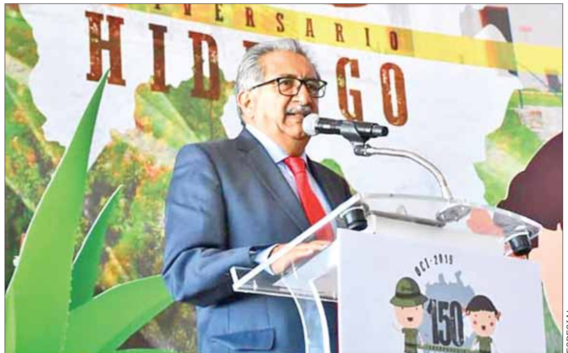
SITIOS. Indicó Rodríguez que estos jóvenes son ejemplo del esfuerzo y el talento de la entidad.

Subrayó que la actual administración brinda especial énfasis a la educación, articulándola con otros sectores del desarrollo y dotándola de insumos ne-