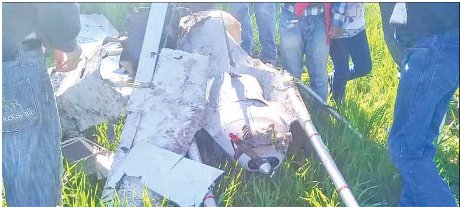
SEGUIMIENTO. Al sitio llegó personal de la alcaldía de Almoloya, reportando que era un objeto con características de probable drone o modelo escala, mismo que cayó en tierra de labor a un costado de la carretera a Santiago Tetlapayac y San Graciano Sánchez.

Asimismo, consideraron que la compañía pudo obtener escrituras de manera "ilegal", para reclamar las tierras; no obstante acusan que lo haga hasta ahora, si durante años son ellos quienes habitan en dicho lugar y pagan sus impuestos. (Jocelyn Andrade)