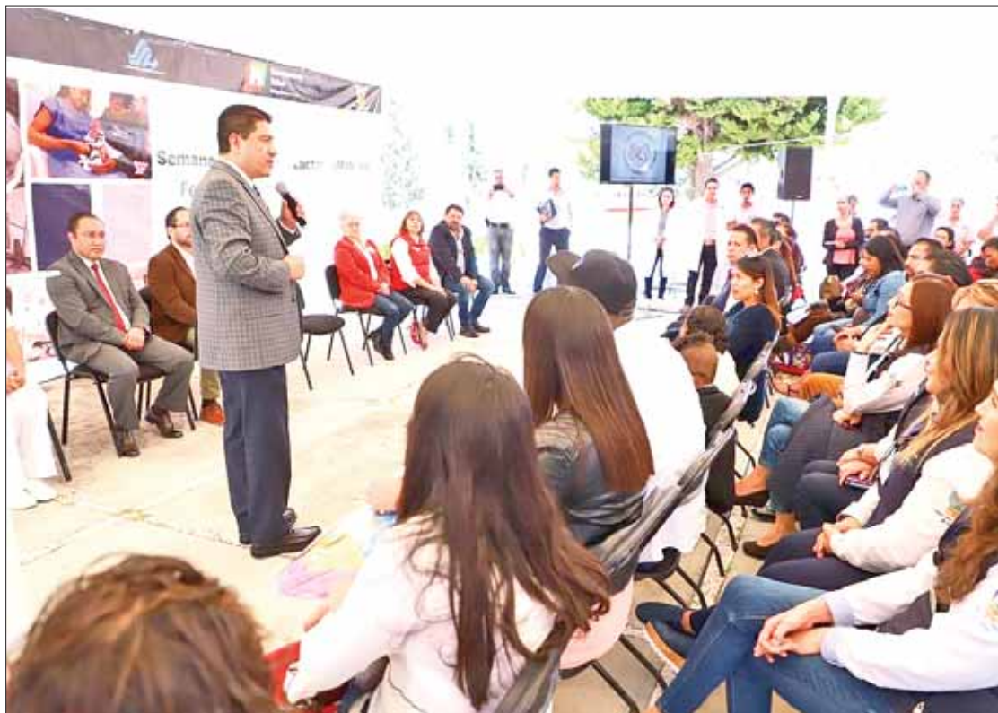
PUNENTES. Esta semana en el Hospital Obstétrico de Pachuca realizan el Festival de la Lactancia Materna.