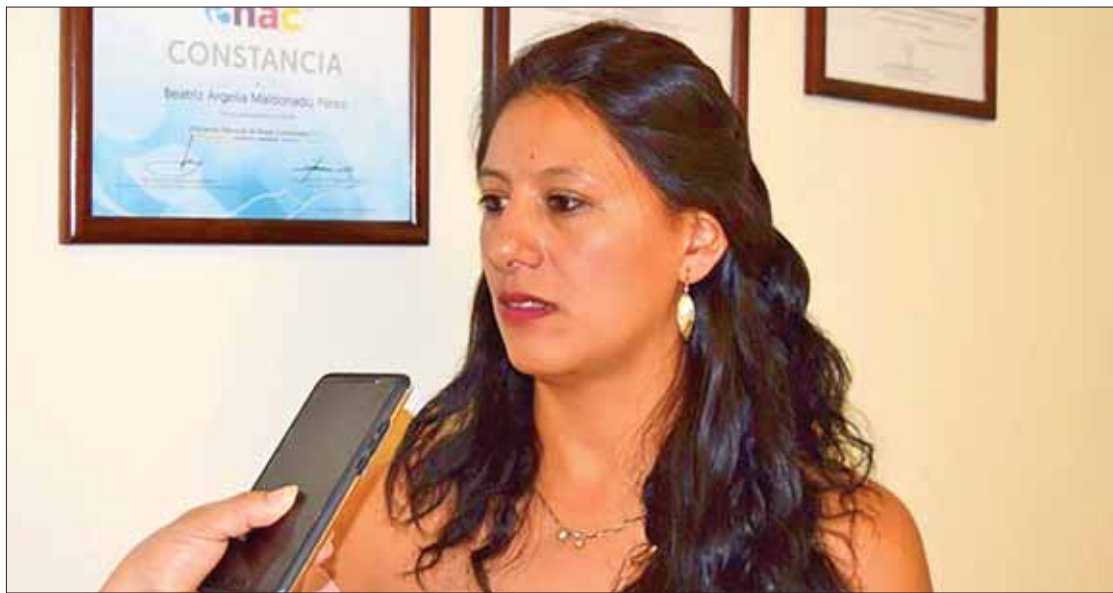
SEGUIMIENTO. En agosto realizarán el mismo proceso, desde la invitación al pago, hasta la colocación de una caja móvil de cobro como una facilidad más de que el ciudadano pueda acudir sin originarle gastos en su traslado.

Puntualizó que en lo referente a agosto se llevará a cabo el mismo proceso, desde la invitación al pago (2 mil 891 notifica-