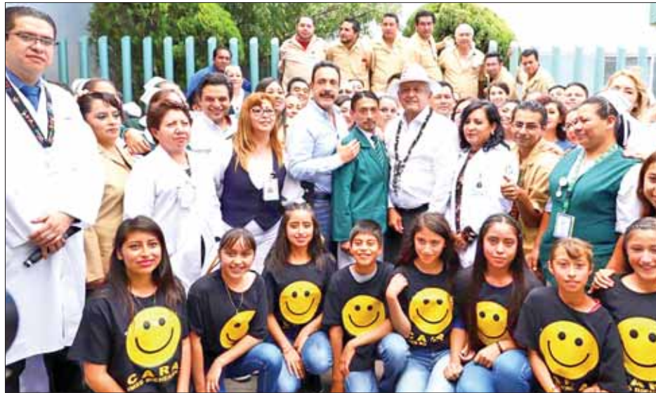
CERCANÍA. Durante los primeros seis meses de la administración federal el primer mandatario de la nación ha visitado en ocho ocasiones al estado.