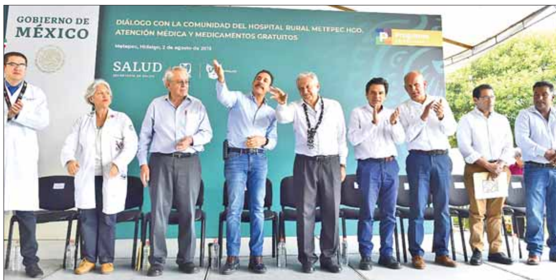
PLATAFORMAS. La universalización del sistema de salud no es un reto fácil, pero en esta tarea el Presidente López no está solo, estamos juntos en este proceso de cambio y transformación para articular uno nuevo: gobernador de Hidalgo.