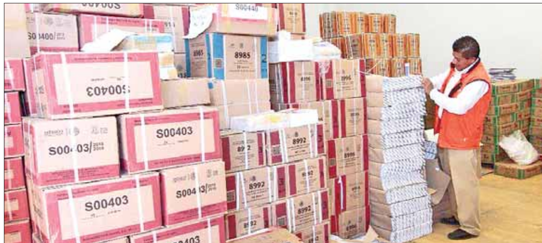
REGIONALES. Material que ya llegó es resguardado en las bodegas dispuestas para ello por la SEPH.

La tarea de los comités se inscribe en la búsqueda de modelos de educación superior que respondan no sólo a la evaluación del conocimiento y la cultura, sino a las exigencias y necesidades sociales del país. (Adalid Vera)