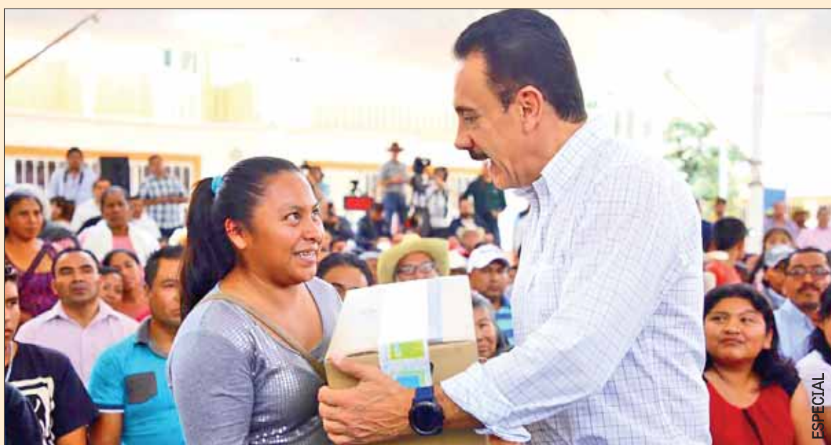
Atendió el gobernador Omar Fayad a más de 2 mil personas durante audiencia pública este jueves.