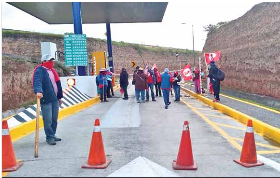
PROTESTAS. Bloquearon los liderazgos, acompañados por sus huestes, distintas vías en esta entidad.

En entrevista indicó que el bloqueo ya se anunciaba desde