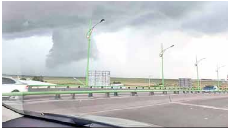
ANTECEDENTES. Recordaron que no es la primera vez que sucede.

"Esta es la primera conformación de un embudo con estas condiciones, pero recordamos