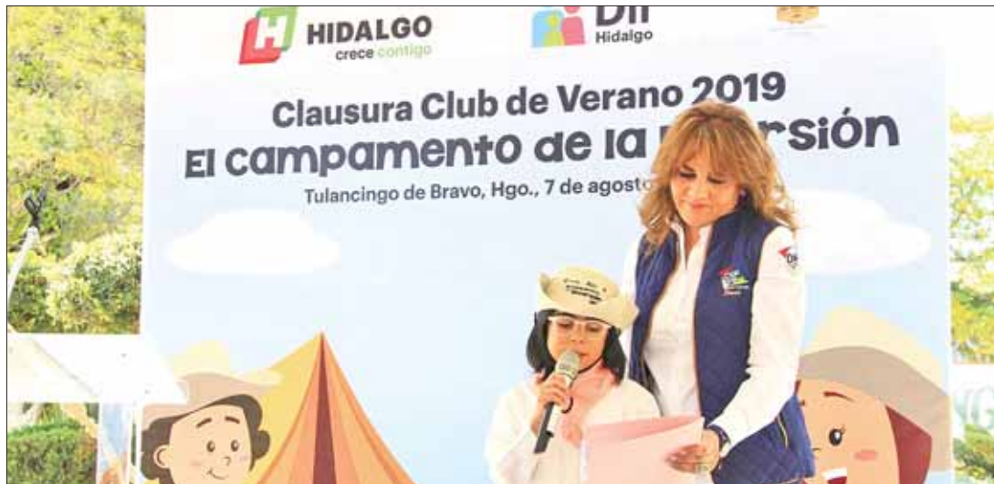
EXTENSIÓN. Fueron 49 municipios hidalguenses que participaron en este curso de verano.