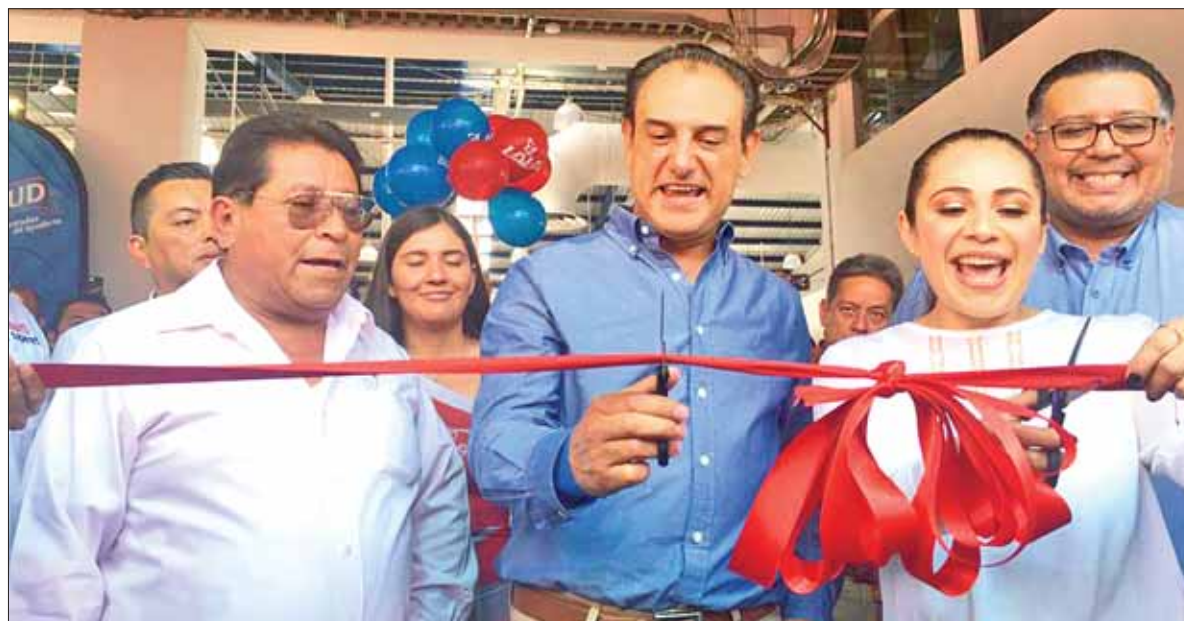
EVIDENCIAS. Refirió el Ejecutivo local que recientemente se ha participado en eventos de inauguración de cuatro unidades económicas.

La organización de esta jornada es interinstitucional con la suma de diversas corporaciones. (Redacción)