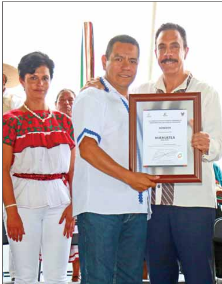
EN ACAXOCHITLÁN. Conmemora Omar Fayad el Día Internacional de los Pueblos Indígenas, con la entrega de apoyos.

"Hace Hidalgo un esfuerzo y por eso entregamos aquí los cer-