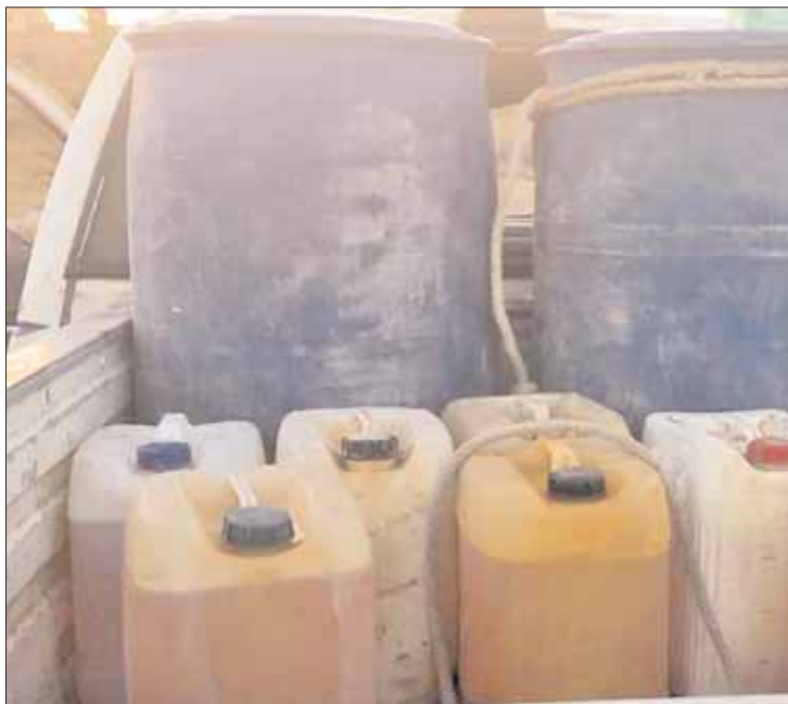
SÍNTESIS. La fuga por toma clandestina, que posteriormente se supo fue de gasolina, fue controlada cerca de las 3:30 horas de acuerdo con reportes de Pemex, aunque la toma fue sellada a las 9:20 de la mañana.

La alarma generó que al menos cinco familias abandonaran sus hogares por sus propios medios y otras asistidas por personal de Protección Civil de municipios adyacentes como Tlahuelilpan.