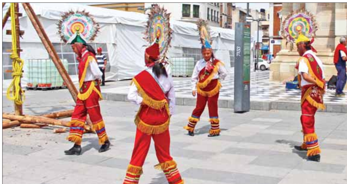
ENTIDAD. Segregación, falta de acceso al empleo y discriminación son sólo tres de los factores que afectan a los integrantes de los grupos indígenas.

bo de mencionar. Desafortunadamente no todos tienen el carácter para lograr sobresalir siendo indígena, pero si la vida me permite acercarme con personas