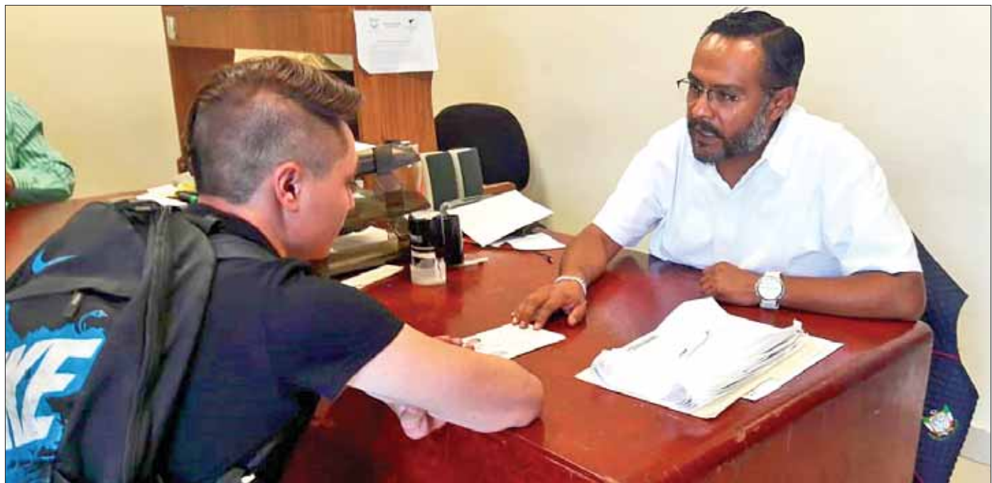
CLÁUSULAS. La participación de la ciudadanía es vital: exhortó a la población -víctima de algún delito- a iniciar la carpeta de investigación correspondiente.

Advirtió que los operativos continuarán indefinidamente.