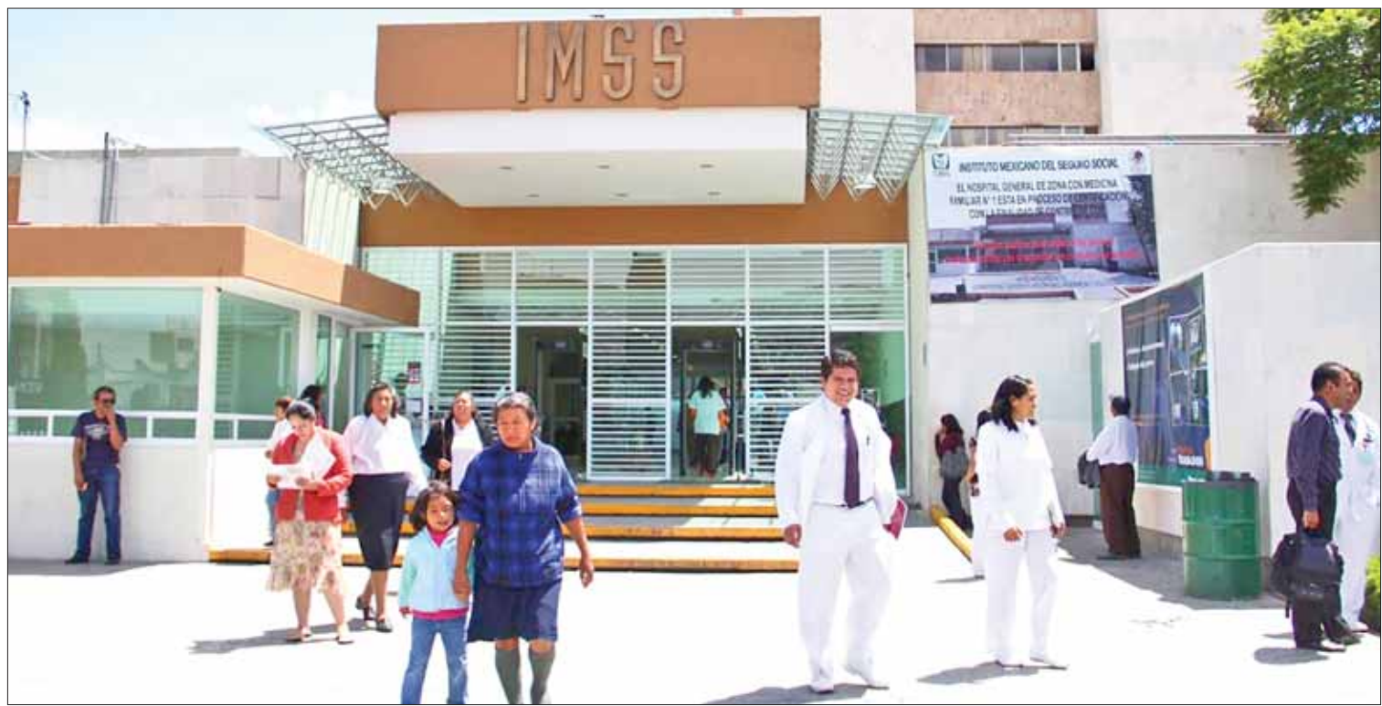
CALIDAD. Permitirán estas visitas identificar puntos débiles del organismo, así como a personal que no cumple con los requerimientos.

Estos datos están a disposición en el organismo empresarial para que sean verificados de manera oportuna.