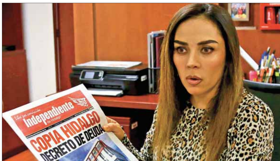
Respondió titular de Finanzas a publicación sobre supuesto plagio de un decreto de deuda para Hidalgo.