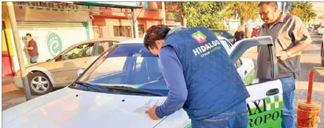
VIGILANCIA. Desplegó el STCH a personal de varias áreas en dos municipalidades.