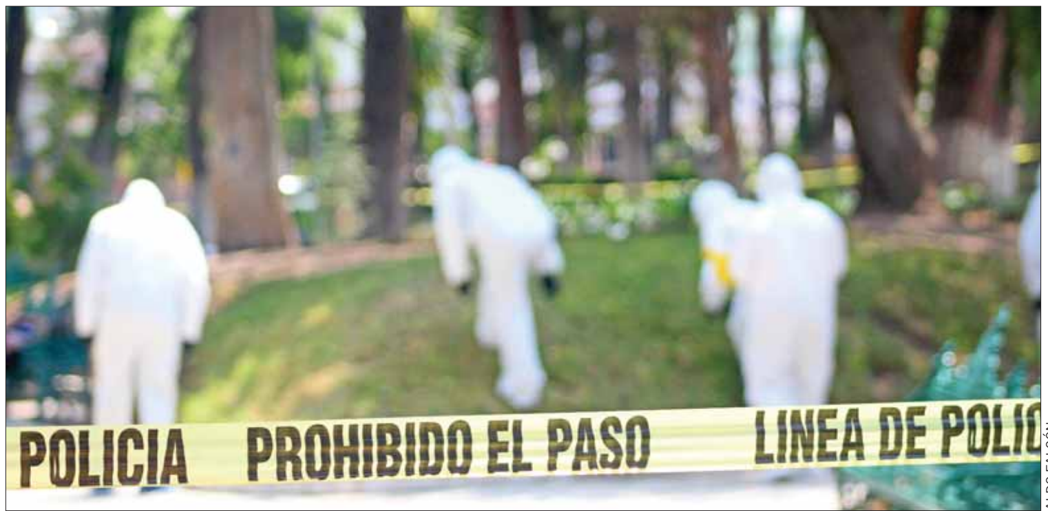
PAUTAS. Hallaron los cadáveres este miércoles; explican manera en que fueron encontrados.

Liderazgos en el PRD exhiben un desfase de casi dos años, pues desde 2017, militantes interpusieron diversos juicios para iniciar con la etapa de renovación conforme los estatutos "amarillos", incluso la Sala Superior apremió a la cúpula para efectuar este procedimiento.