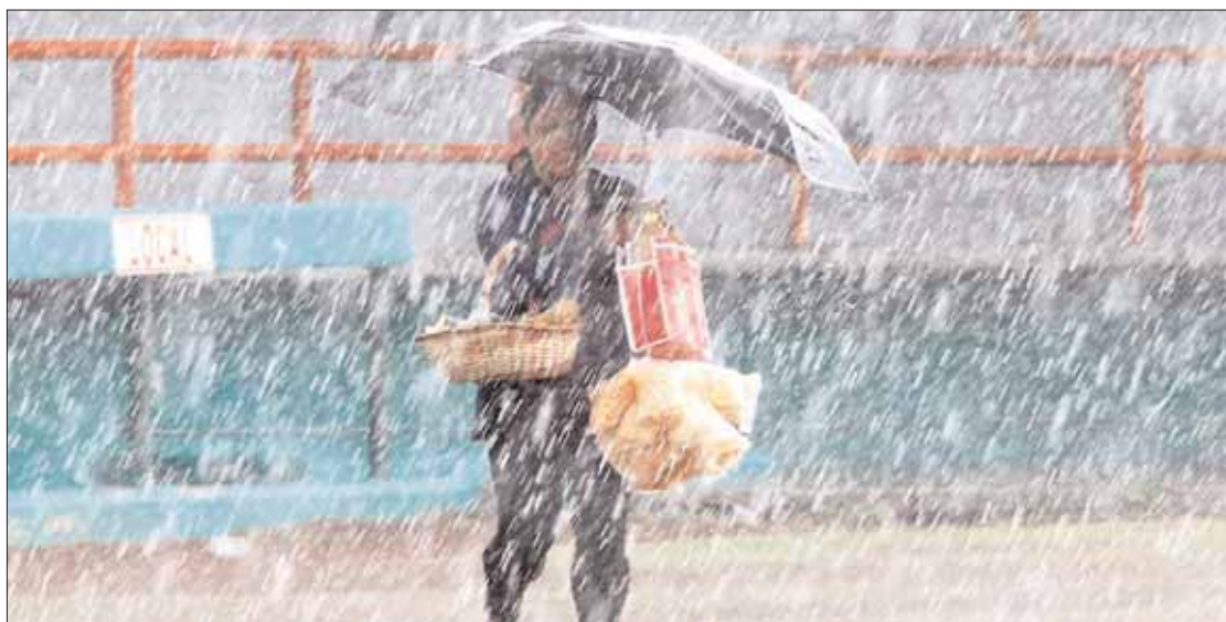
CUIDADO. Durante próximas horas podrían desatarse tormentas para buena parte del territorio estatal.

Por lo anterior se exhortó a la población a tomar todas las medidas preventivas y de autoprotección, así como mantenerse bien informada sobre las actualizaciones de las condiciones del tiempo a través de fuentes