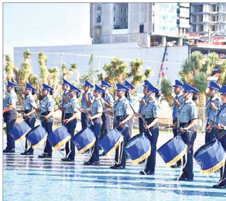
PASOS. Seleccionará la autoridad local a un jurado especializado en la materia, conformado por presidente, secretario y vocal.

Participarán en la etapa estatal tres bandas por modalidad educativa. Podrán hacerlo las bandas de guerra de escuelas de educación secundaria general, técnica y telesecundaria pública y privada. La banda de guerra de la escuela ganadora en el onceavo concurso no podrá participar en esa edición.