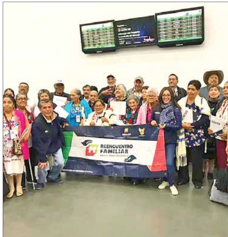
PRÓXIMAS. Organizó la dependencia tres nuevas salidas.

Reconoció el trabajo y colaboración en esta ocasión de la Asociación de Mexicanos en Carolina del Norte (Amexcan), la Federación de Hidalguenses Eloxochitl en Nueva York, el Club Hidalguenses en California "El Apapachó", para la organización y re-