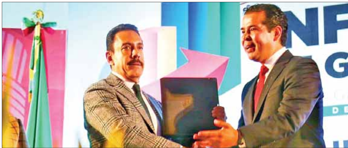
MENSAJES. Indicó municipal que a tres años de gobierno recuperó la confianza de la ciudadanía.

Indicó también que se han hecho brigadas de limpieza en calles y también de aplicación de pintura a guarniciones, para mejorar su imagen y adelantó que existe un proyecto para mejorar la imagen de La Olla que se encuentra en el jardín principal, sello distintivo del municipio "en donde el agua hierve". (Ángel Hernández)