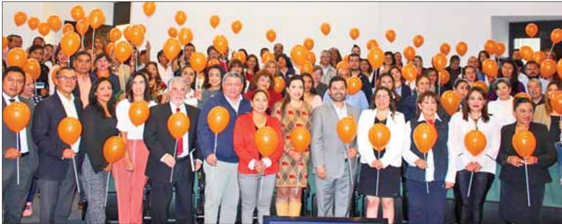
TRASCENDENCIA. Conoció personal diferentes herramientas que coadyuvan en la lucha por la equidad desde distintos ámbitos de acción.