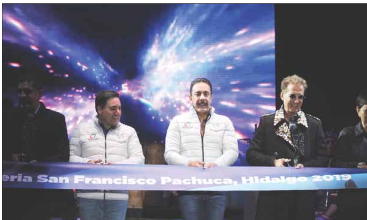
Inauguró ayer el gobernador Fayad tradicional festejo, en la capital del estado, ante miles de hidalguenses.

■ Comienza actividades uno de los festejos más grandes de la entidad ■ Es ya la quinta más importante de México, expone gobernador Fayad