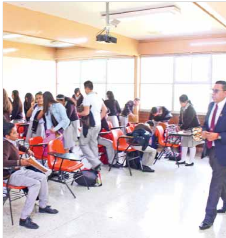
PROHIBICIÓN. Ya no podrá condicionarse la inscripción a planteles.

Con 79 votos a favor, 24 en contra y cuatro abstenciones, se aprobó la Ley en Materia de la Mejora Continua de la Educación. Se creará la Comisión Nacional para la Mejora Continua de la Educación y el Sistema