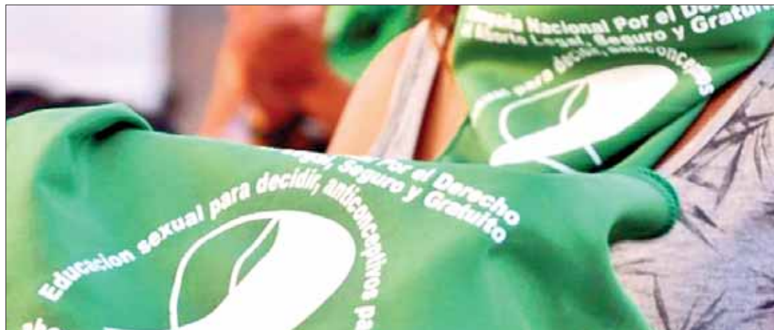
DISCUSIÓN. Indicaron representantes que la entidad debe dar el paso, desde la legislación, para aprobar posibilidad.

La nueva administración implementó la escrituración continua de los créditos con el objetivo de beneficiar a los trabajadores al servicio del estado y a sus familias y para que el "tren de vivienda" no se detuviera. (Jocelyn Andrade)