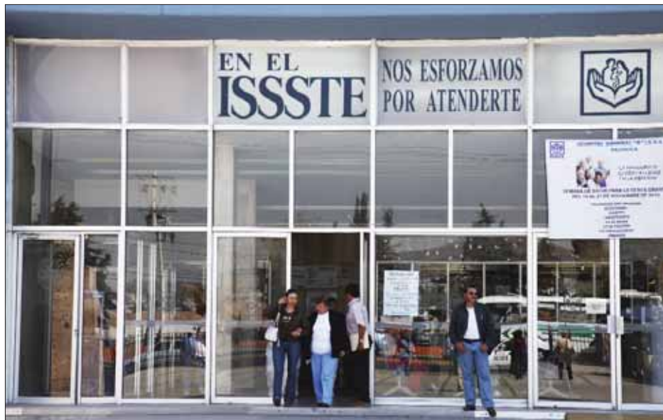
PAUTAS. Una asistencia personalizada en eventos de infarto agudo al miocardio, y fue implementado desde el año pasado en esta entidad.