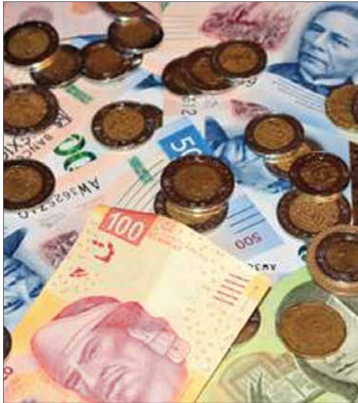
VALORES. Segundo trimestre 2019: informe publicado en la página de la Auditoría Superior del Estado de Hidalgo.

PERIODO Cada trimestre publica un índice de rendición de cuentas para los entes fiscalizados