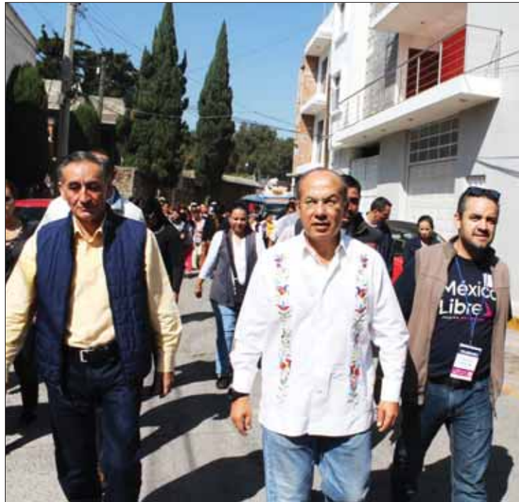
VOCES. A Calderón no le ofenden comentarios de AMLO; me divierten también sus puntadas.

de asumir el Ejecutivo federal, todavía hay muchos pendientes en materia económica y principalmente de inseguridad, de igual forma, opinó referente a ciertas actitudes de los representantes de Movimiento Regeneración Nacional (Morena) en el Congreso de la Unión o locales, situaciones que calificó como "instintos y reflejos del DNA priista".