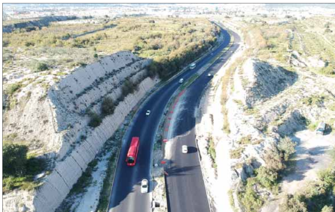
Reabrió la Secretaría de Obras Públicas del estado el bulevar Nuevo Hidalgo, esto como parte de los compromisos del gobernador Omar Fayad: "hoy ya puedes transitar de forma más rápida y segura junto a tu familia".