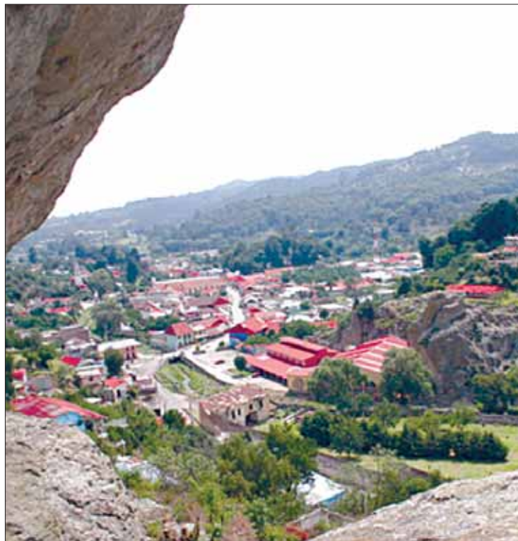
ÚLTIMAS VACACIONES. En parajes naturales y pueblos mágicos tuvieron balances positivos.

"Es importante señalar que este corredor, pese a las carencias y necesidades que pueda tener es de los más seguros del estado, cuenta con una infraestructura turística de primera y eso permite que cada vez más personas busquen algunas de