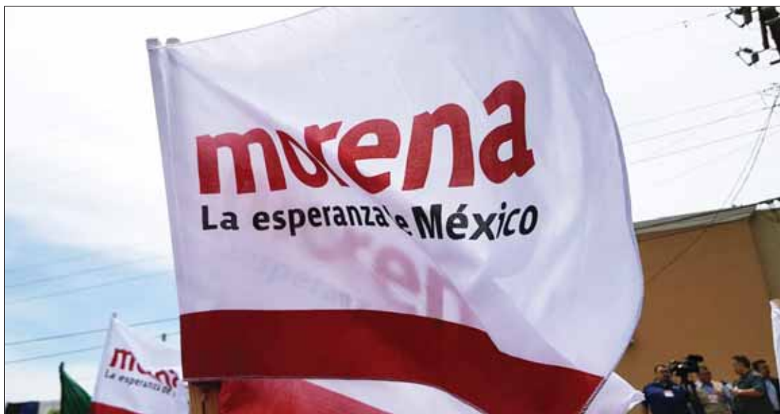
SELECCIÓN. Subrayó CNHJ la importancia de que interesados cuenten con un piso parejo para contender.

Asimismo prohibió ocupar cargo ejecutivo a servidores públicos de la administración en los tres órdenes que tengan mandos medios o superiores, adjuntos y homólogos, que dispongan de recursos humanos, materiales y/o