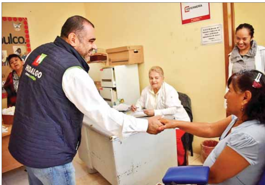
OPCIONES. Recorrió encargado del rubro varios CGI con la meta de cumplir objetivos del gobierno estatal.