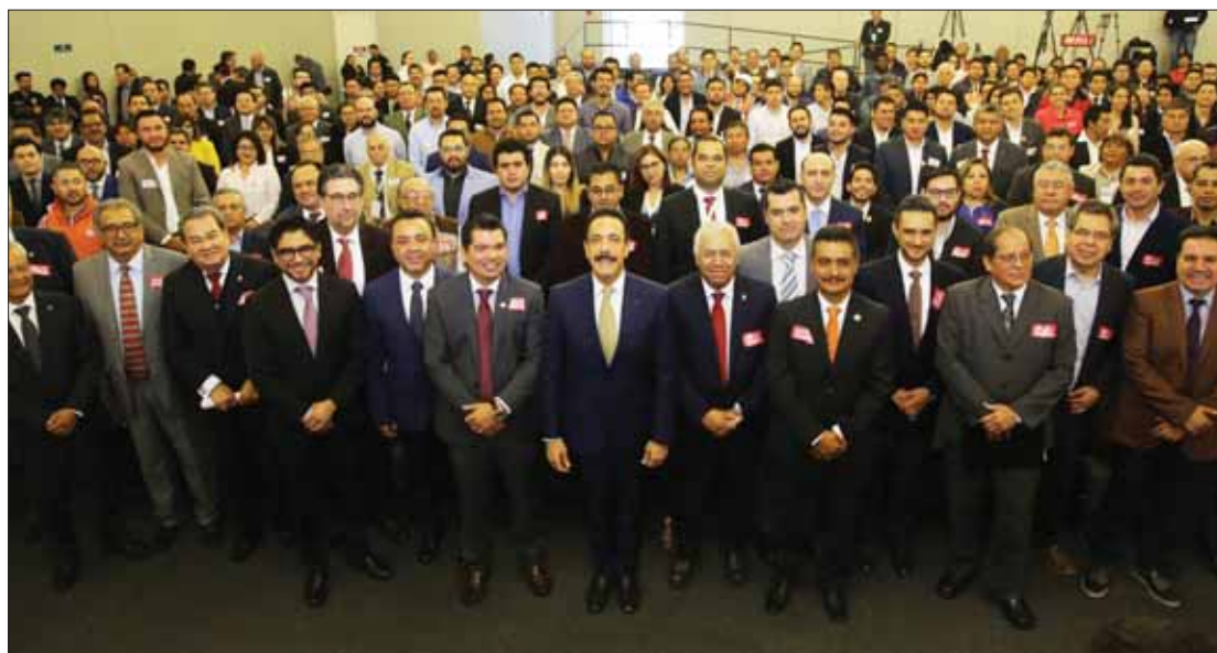
Subrayó Omar Fayad importancia del trabajo realizado por ingenieros civiles de México, durante encuentro con gremio del estado.

En instalaciones del C5i, Fayad compartió con los asistentes al encuentro que 6 mil 500 cámaras de videovigilancia, botones de pánico y alarmas vecinales, están conectadas al centro, entre otros instrumentos tecnológicos que inciden en niveles de paz y seguridad registrados en Hidalgo. .3