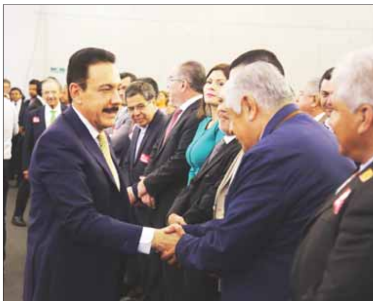
CONEXIÓN. Indicó el gobernador que dicha carretera fortalecerá a la entidad.

La infraestructura carretera realizada en los tres últimos años, entre ella la primera etapa de la Supervía Colosio, incide en la movilidad de habitantes de la capital hidalguense y su zona metropolitana, construida en tiempo récord gracias al profesionalis-