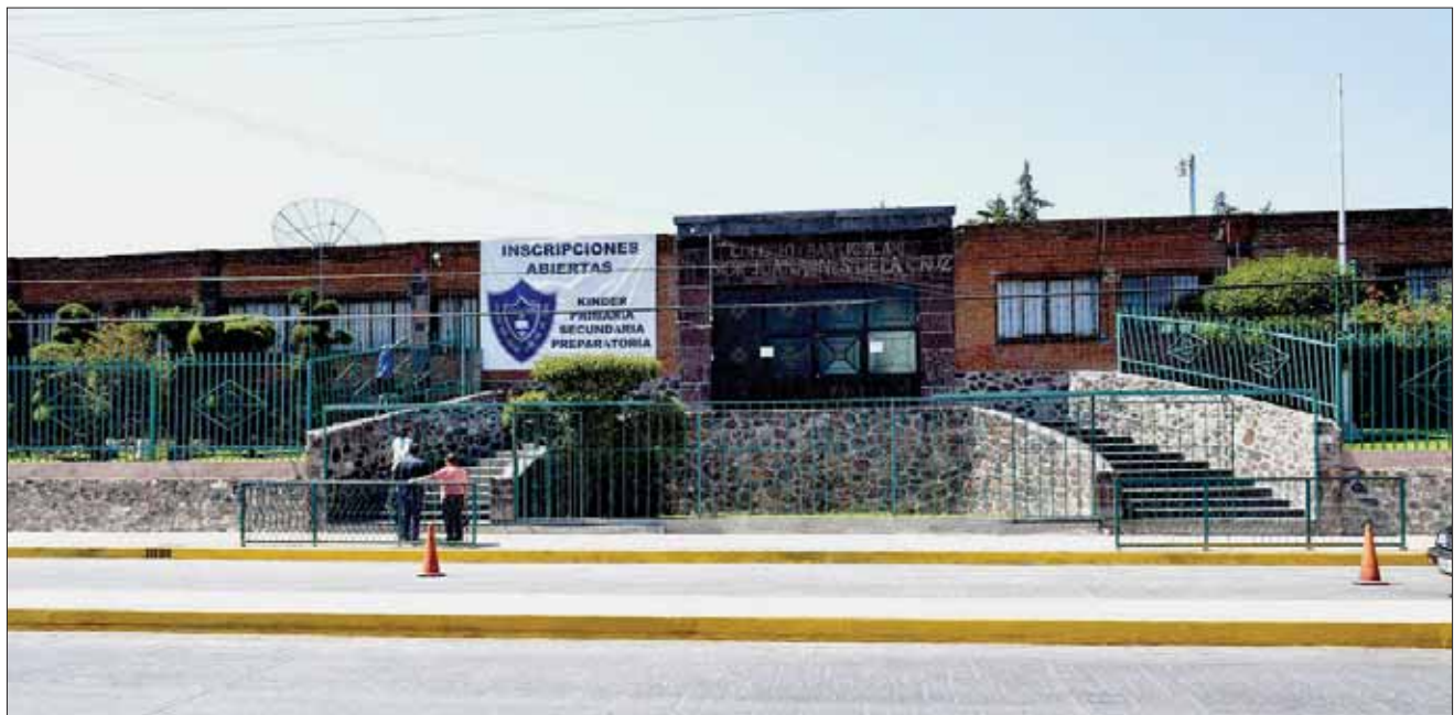
ESPERA. Pese a todo aún no se sabe qué modelo educativo será el que siga este plantel en Tepeji.

Abundó que aún no se sabe el modelo educativo de la nueva secundaria, "si será general o técnica".