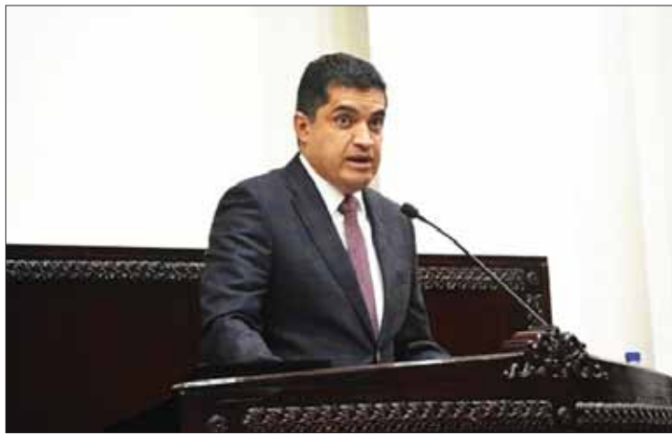
PUGNAS. Confió el legislador en que los morenistas tomen en cuenta dicho exhorto y al derecho.

El próximo 16 de octubre es la fecha en que cambiará la Junta de Gobierno, según acuerdos políticos del año pasado correspondería al PRI asumir la presidencia por un año.