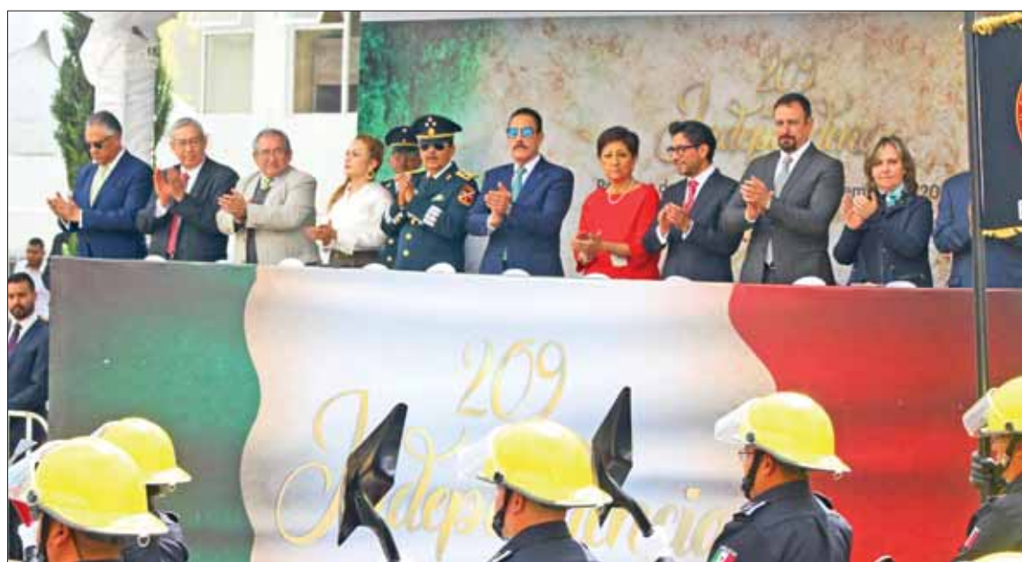
Transcurrieron en completa calma los festejos y el tradicional desfile relativos al inicio de la Independencia, en Hidalgo.