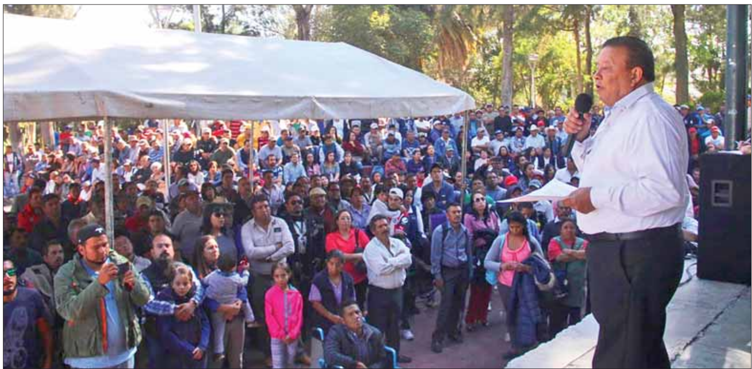
HECHOS. Indicó el dirigente que el panorama resulta bastante complicado para la alcaldesa Tellería y deberá refrendar su palabra.

Recordaron que esta situación es parte fundamental del propósito que se han fijado las autoridades de la entidad, con la finalidad de garantizar la seguridad de las personas. (Milton Cortés)