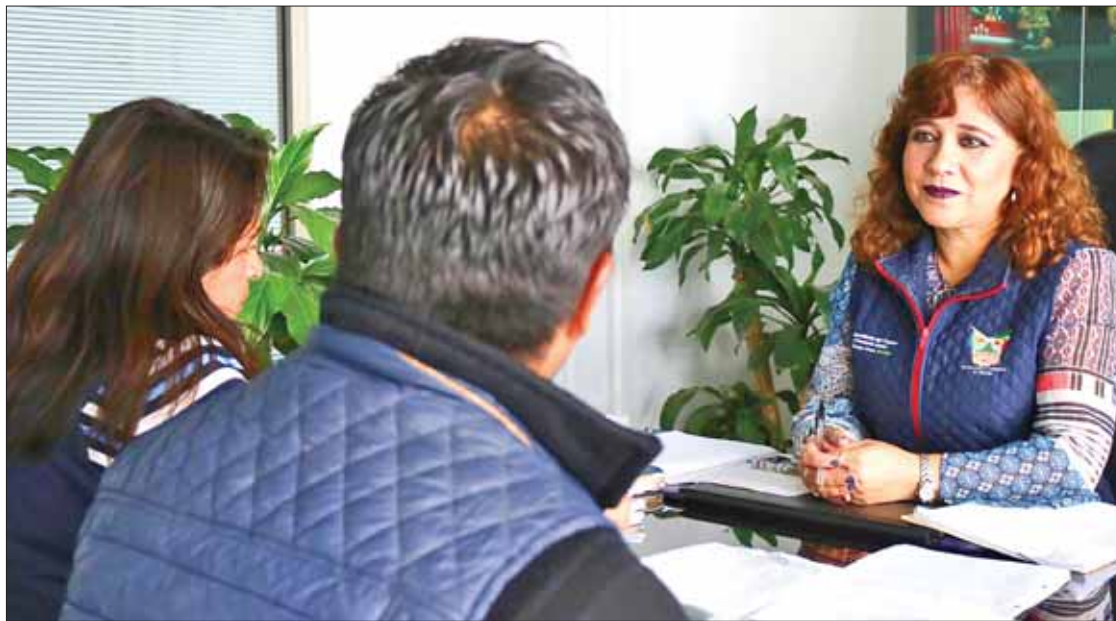
ORIENTACIÓN. Destacó asesoría con el objetivo de agilizar y encontrar soluciones amistosas para cada caso.

Desde inicios de la administración del gobernador Omar Fayad, hasta el mes de agosto del presente año, se alcanzaron 10 mil 48 conciliaciones, de las cuales 2 mil 556 se concretaron en lo que va de 2019, pues con dicha jornada se ofrece la posibilidad de con-