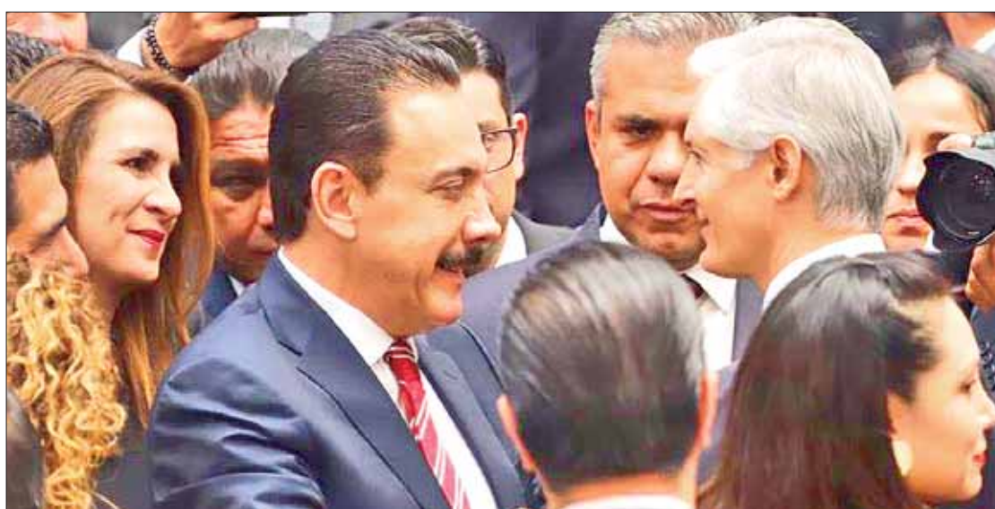
Acudió el gobernador Omar Fayad al Segundo Informe de Labores de su homólogo del Estado de México, Alfredo del Mazo, a quien reconoció este ejercicio para rendirle cuentas a los mexiquenses.