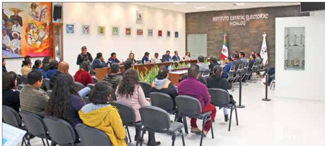
CONTEOS. Hubo mayor cantidad de aspirantes en los municipios más grandes, expuso consejera.

► Detalló Tolentino la participación de los perfiles que buscan nuevo cargo en IEEH, ahora falta entrevista