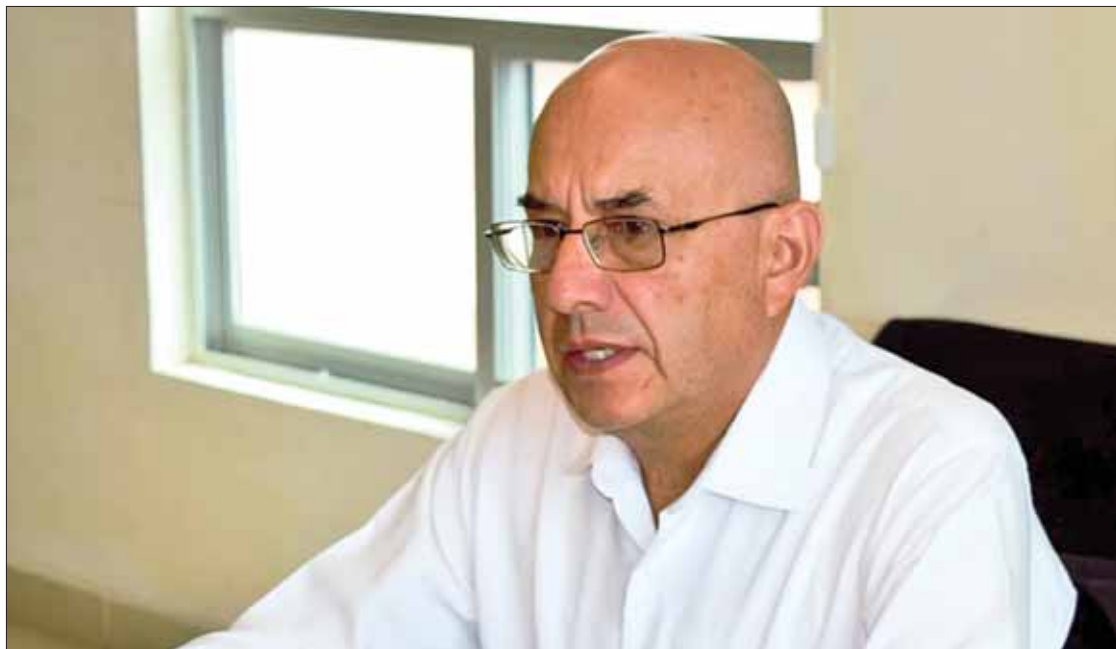
ENERGÍA. Composturas tienen que ver incluso con descargas y variaciones de voltaje, sostuvo el funcionario.