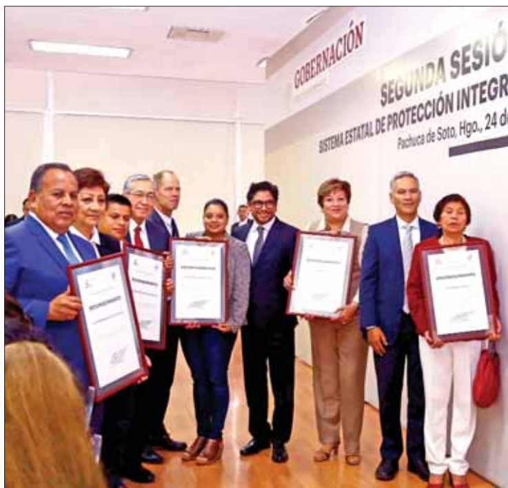
INDICES. Destacó secretario ejecutivo la reducción de embarazos.