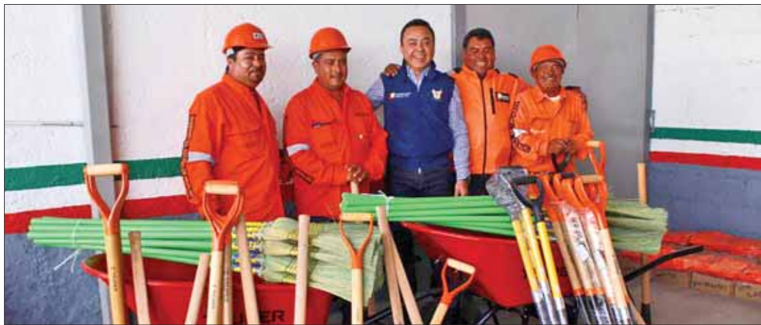
COMPLEMENTOS. Recibió el personal de la dependencia uniformes nuevos, así como diversos materiales de trabajo.

"Mientras eso sucede, la fracción de Maestros por México sigue exigiendo que se congelen las cuentas bancarias del sindicato". (Adalid Vera)