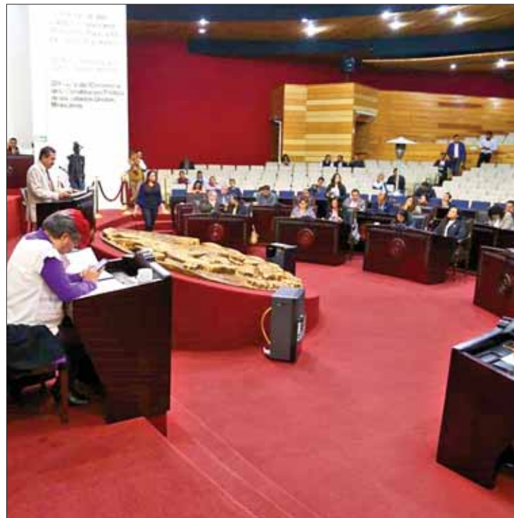
ESQUEMA. Quitaría posibilidad de rotación si cuenta con más de la mitad de representantes.

En caso de no existir esa mayoría absoluta será mediante consenso la definición del presidente, si descartan los acuer-