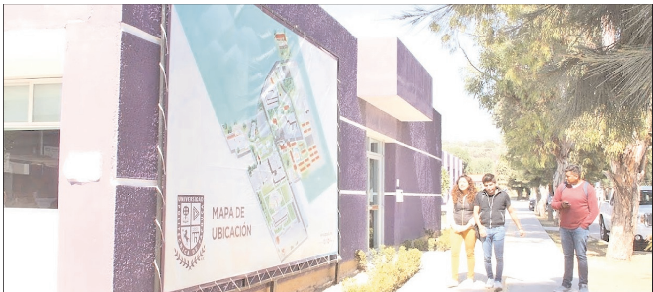
PLATAFORMA. Son varias fases las que deberán cubrir quienes estén interesados en la convocatoria universitaria.

Los desafíos a resolver en la competencia consistirán en problemas reales que requieran de una solución creativa, no estando limitados únicamente al ámbito tecnológico, pues pueden considerar varios sectores o temas sociales.