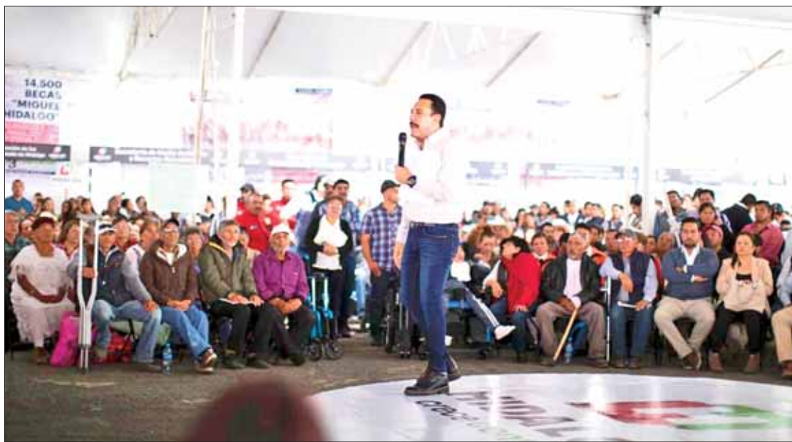
FORTALEZAS. Despuntó la entidad, de acuerdo con calificadoras internacionales, expuso el mandatario estatal.

Recordó que durante su administración se triplicó el abasto de medicamentos, actualmente cuatro de cada cinco medicinas recetadas para enfermedades crónicas degenerativas, dentales y otras, están garantizadas.