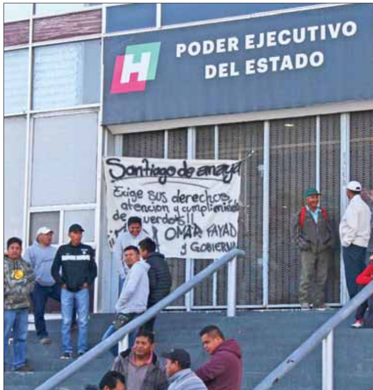
HOMICIDIO. Esperaban además la audiencia del exdiputado.