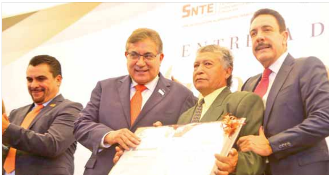
SINERGIAS. Entregó mandatario estatal apoyos económicos y de basificación a los agremiados del SNTE.