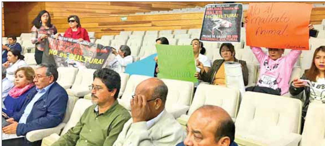
GALLITO. Sintió el legislador la presión de los representantes de grupos defensores de animales.

Otro aspecto a destacar es que concede la posibilidad de promover una oferta anticonceptiva que responda los intereses de cada ciudadano. (Rosa Gabriela Porter)