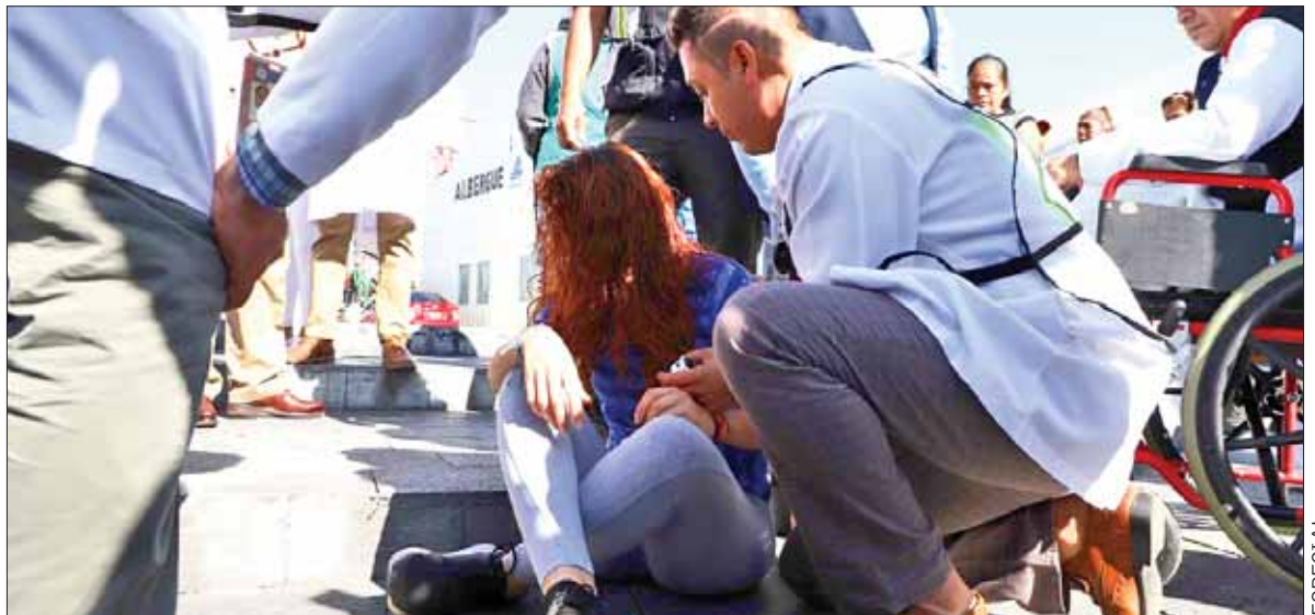
RESPALDO. Recordó que en este tipo de tragedias se dan muestras de solidaridad y cooperación entre entidades.

Es de destacar que al final del simulacro se procedió al pase de lista y detalle de las incidencias, en donde se determinó que todo había transcurrido con normalidad y se implementó la etapa de valoración de daños de la infraestructura para el ingreso nuevamente al edificio de todos los participantes.