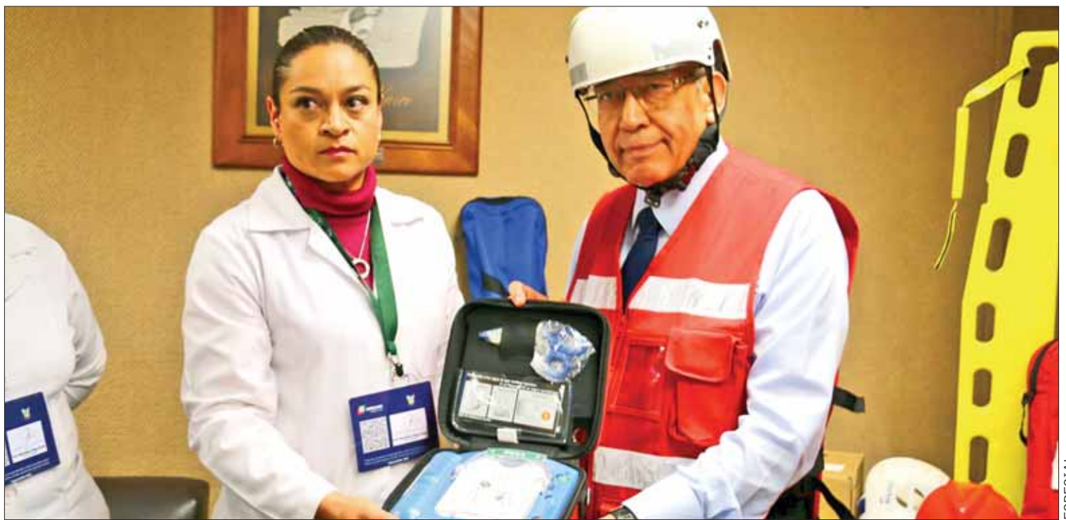
INSISTENCIA. Subrayó la preocupación del gobernador Omar Fayad hacia la prevención, ya que se trata de vidas de seres humanos.

La Unidad de Planeación y Prospectiva y la Secretaría de Educación Pública participan en la promoción de este programa.