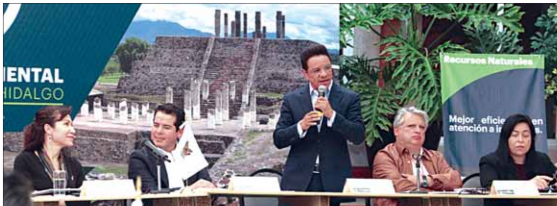
APORTES. Inversión superará los 22 mil millones de pesos, expuso el titular de la dependencia estatal.

En Hidalgo, para 2018 aprobaron un monto de 132 millones 489 mil pesos, mientras que este año 214 millones 893 mil 541 pesos; es decir, que cada diputado representa un presupuesto de 7 millones 163 mil pesos mientras el costo por habitante es de 70 pesos.