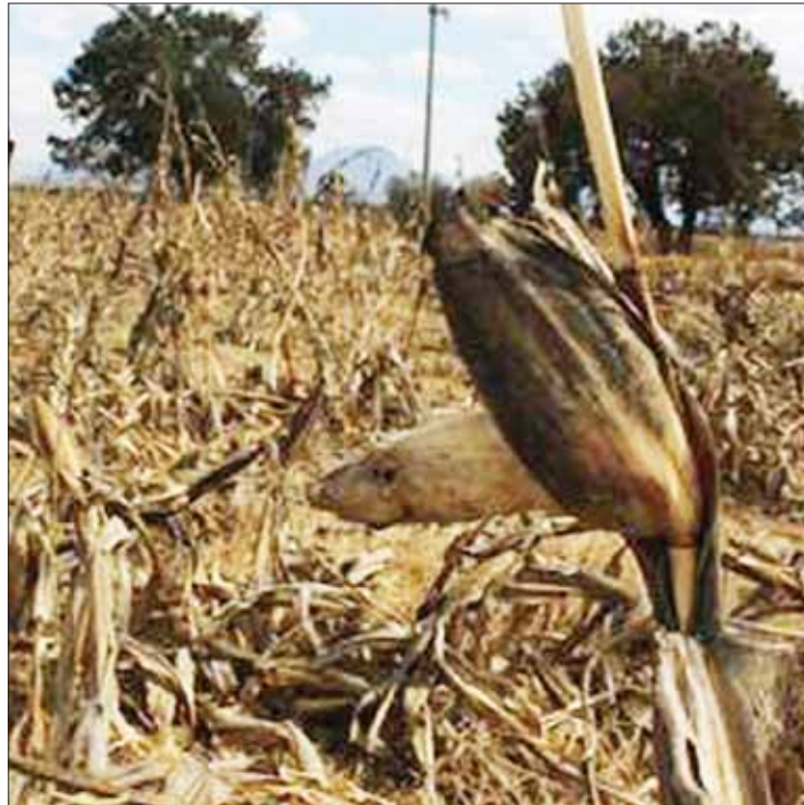
SITUACIÓN. Falta de lluvias puso en riesgo actividad económica en región Huasteca.

Además a la Secretaría de Agricultura y Desarrollo Rural (Sader), mediante la Dirección General de Atención al Cambio Climático en el sector agropecuario, para que realice estudios idóneos a fin de que gestione o implemente medidas, acciones y