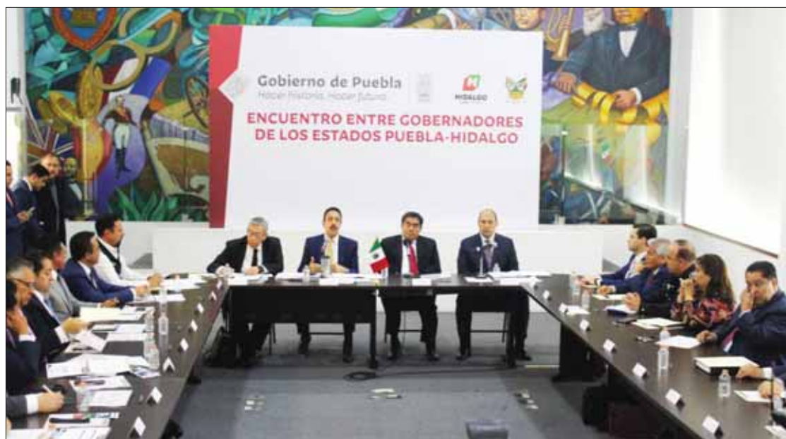
PROXIMIDAD. Acudió el gobernador hidalguense con su homólogo para tratar temas en beneficio de poblaciones.

"Deben enfrentarse juntos los retos, a los fenómenos naturales, la violencia y delincuencia organizada, no les importa ni respetan la división política entre enti-