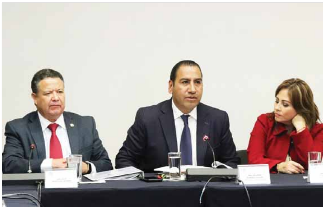
PAPEL DEL ESTADO. Con esa eliminación también pretenden erradicar las detenciones arbitrarias y la práctica de la tortura.

Este 2019 han efectuado diversas entregas de apoyo subsidiado (casi una por mes) lo cual refleja el compromiso de este gobierno en impulsar el desarrollo de las colonias y comunidades elevando su calidad de vida con viviendas más dignas. El apoyo será permanente durante la presente administración con el objetivo de beneficiar a la mayor población posible. (Redacción)