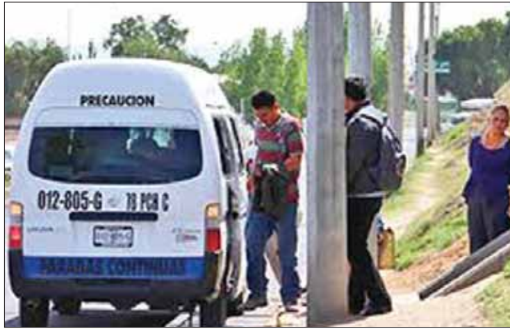
ADemás. Intensificará vigilancia para evitar los abusos.

El objetivo es verificar que los trabajadores del servicio público