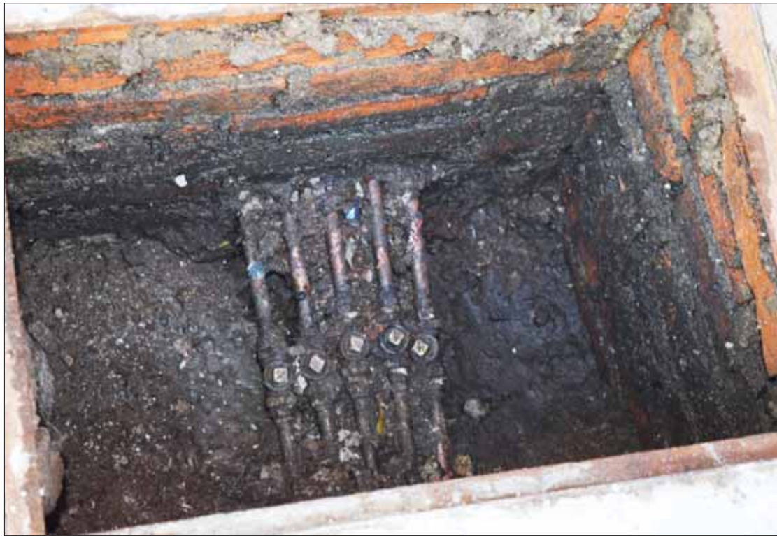
MEDIDA. Conexiones ilícitas localizadas en la calle Molino del Rey fueron canceladas y se levantó la infracción correspondiente.

De ahí que en el punto antes descrito se pudo observar que cuenta con 11 viviendas y se