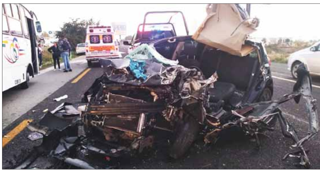
Exceso de velocidad provocó un percance vial sobre la carretera México-Pachuca, donde una persona resultó lesionada.

Los retos que se proyectan son el banco de leche humana, segundo robot de dispensación... .3