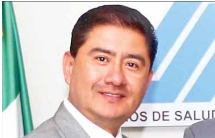
EXPECTATIVAS. Recordó Escamilla que esperan nuevos lineamientos de la federación para el Seguro Popular.

"Este programa lo solicitaron para personal de la Marina y diversas entidades del país, tiene un impacto positivo para Hidalgo a pesar de las situaciones y