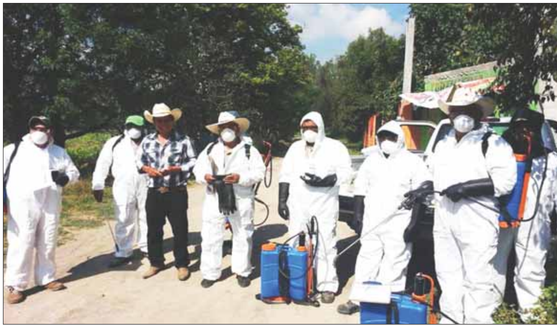
POLUCIÓN. Sostuvo la dependencia que utilizará una base de pimienta que resulta amigable con el medio ambiente.

Por otra parte, confirmaron que otro aspecto importante para cerrar este 2019 fue que muchas de las cosechas levantadas ya se encuentran comprometidas por parte de los labriegos, lo que también contribuye a mejorar las condiciones económicas.