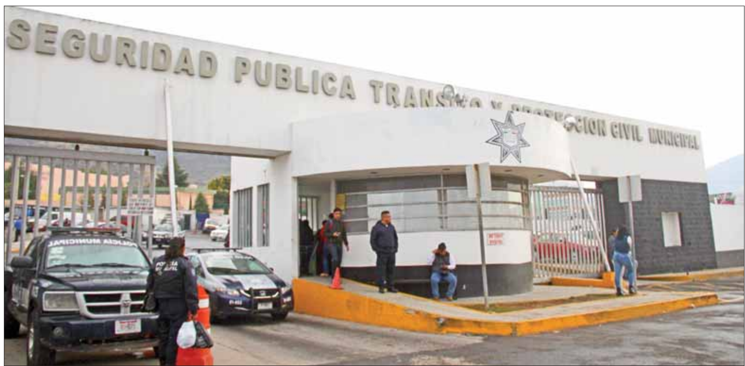
INSERVIBLE. Cuestionaron la pasividad de la Policía Municipal que, pese a la realidad vivida, ofrece distinciones a sus elementos destacados.

El arribo de los ciclistas a Ixmiquilpan fue este fin de semana en la parroquia de San Miguel Arcángel, en donde se celebró una misa luego del recorrido que se realizó para dar gracias por un regreso donde no tuvieron dificultades.