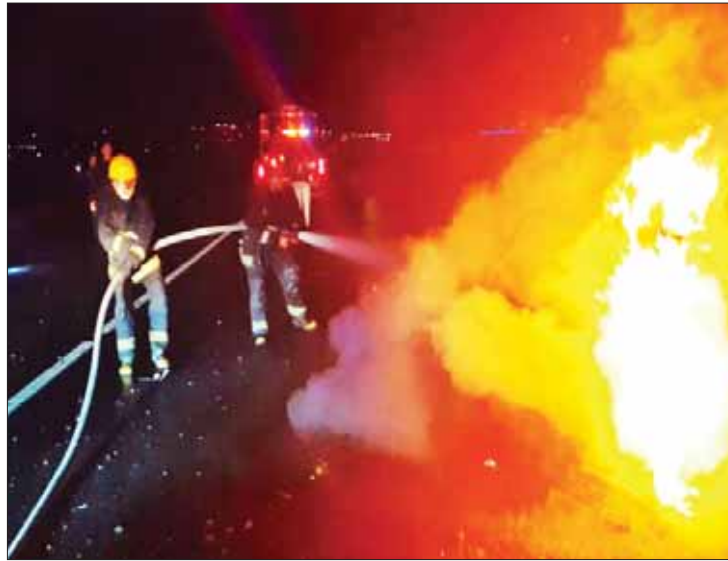
AFECTADO. El automóvil era conducido por una persona de 29 años de edad.

cha un operativo sobre la carretera México-Querétaro, a la altura de la comunidad de Cañada de Madero, lugar en donde la aseguradora Rielme reportó el robo de un tractocamión que transportaba tubos de acero.