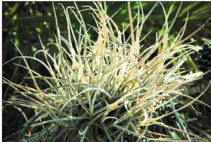
ESPÉCIMEN. Descubrieron que no sólo mata a las especies sino que además consume el dióxido de carbono del entorno.