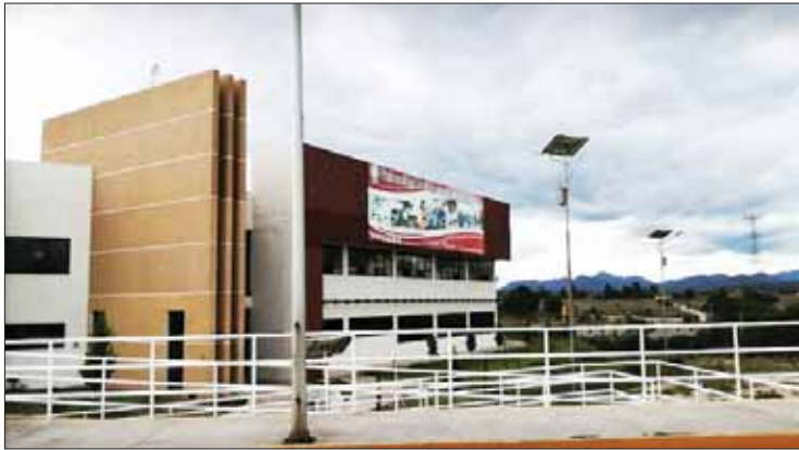
CONVOCANTES. Destacó el rector participación de Citnova y Conacyt.

Dicha jornada se llevó a cabo los días 17 y 18 de octubre, con actividades preparadas por docentes y estudiantes de la UPE, tanto para alumnos de las primarias "Ignacio Zaragoza" y "Josefa Ortíz de Domínguez", el CAM No. 7, los Cobaeh de San Miguel Vind-