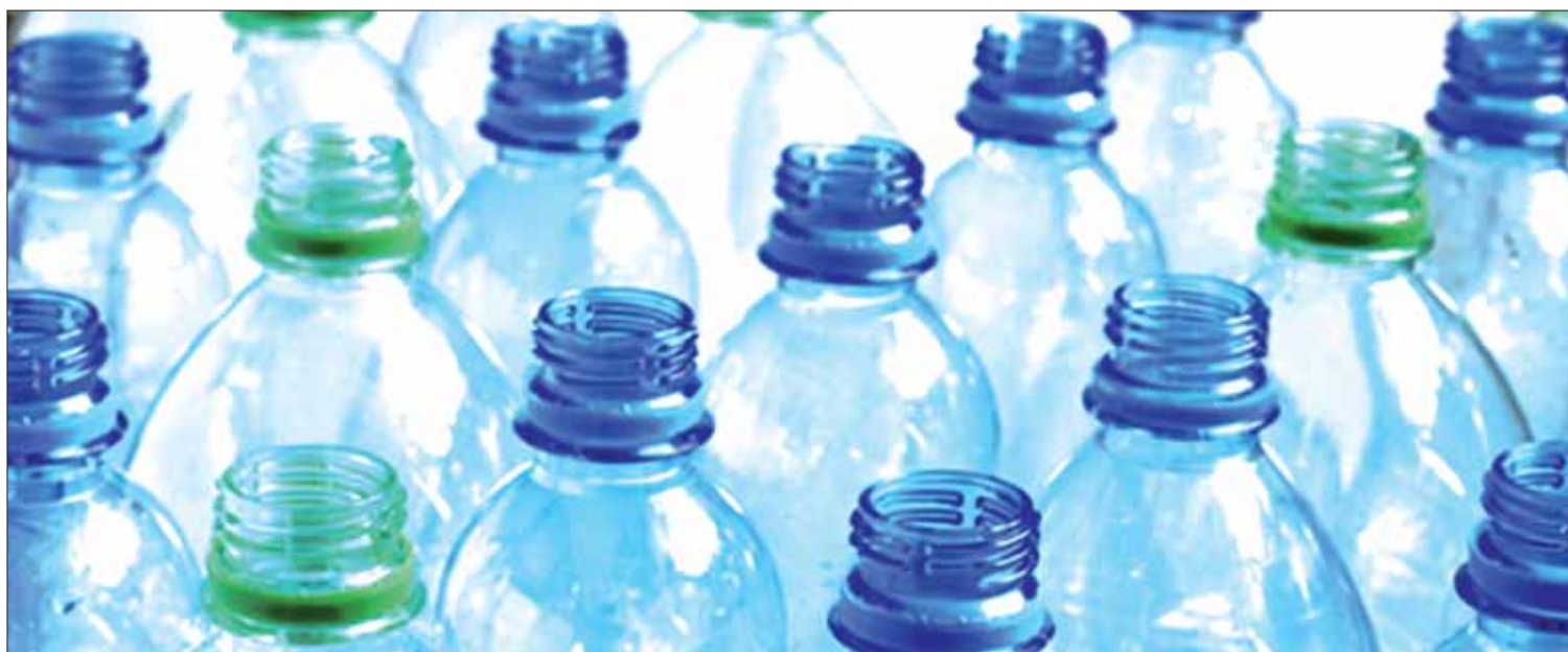
DESAFÍOS. Comunidad del IHEA contribuye a reducir la explotación de los recursos naturales.

El PET será donado a la empresa y ésta lo transformará y lo regresará en especie, con bancas para descanso de los visitantes.