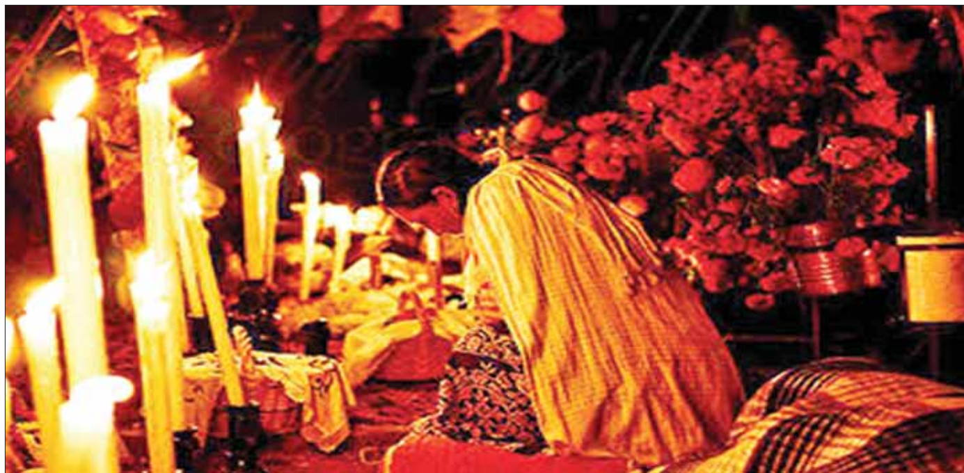
APRECIACIÓN. El destino que comúnmente busca la gente para vivir las fiestas del Xantolo es Huejutla: transportistas.

También se espera movimiento para algunos municipios de la Sierra, también tiene lugar importantemente la tradición de Fieles Difuntos.