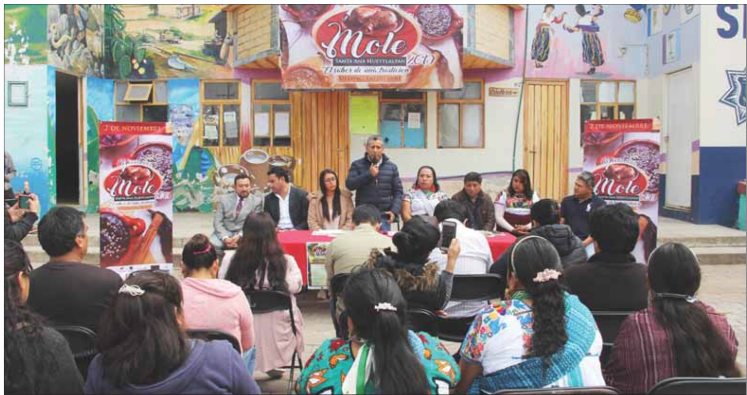
CARACTERÍSTICAS. Conforme las reglas del concurso, las participantes portarán indumentaria típica del lugar, presentarán su mole en cazuela acompañada de piezas de pollo o guajolote.

Con la realización de este tianguis, realizó la oficialía, el gobierno municipal extendiendo las opciones para que la población elija donde abastecer insumos que se destinarán para la colocación de ofrendas. (Redacción)