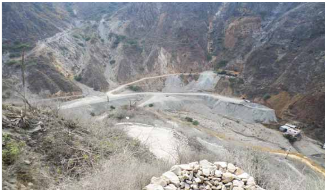
SECUELAS. El pasado 17 de octubre, la Comisión de Hacienda de la Cámara de Diputados aprobó reformas con las cuales desaparece el Fondo Minero; el tema generó molestia entre los alcaldes de esta entidad.

En el estado, este dictamen afecta directamente a las alcaldías de Zimapán, Molango, Tlanchinol, Pachuca, Agua Blanca, Xochicoatlán, Pacula, Mineral