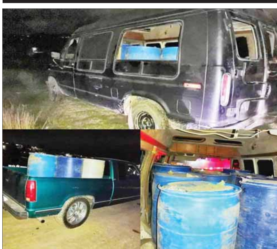
Aseguró personal de la Policía de Tulancingo a tres personas que presuntamente transportaban hidrocarburo de procedencia ilegal, a bordo de una camioneta Pickup y una Ecoline; llevaban 15 tambos abastecidos con 3 mil litros.