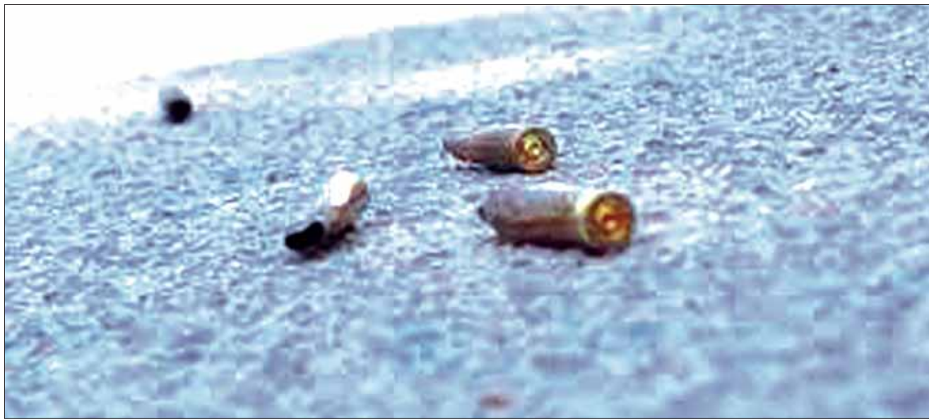
ÍNDICE. Registraron casos de muertes por disparo de arma de fuego y 24 de los casos fueron en espacios públicos, 22 en espacios privados y en seis casos no se tiene el registro de donde fueron localizados los cuerpos.

Puntualizó que las víctimas sufrieron de actos violentos como violaciones, estrangulaciones, golpes, fueron sepultadas, encobijadas, encostadas, y se localizaron cuerpos en descomposición.