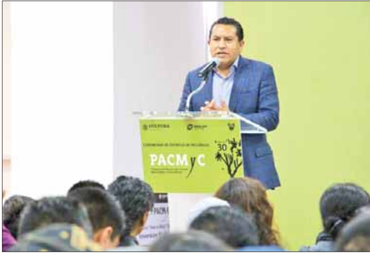
ESFERAS. Refuerza Gobierno de Hidalgo apoyo a Culturas Municipales y Comunitarias.

Durante su mensaje, Hernández Sánchez explicó que el Programa de Apoyo a las Culturas Municipales y Comunitarias (PACMYC) representa un esfuerzo que realiza el gobierno de Hidalgo en conjunto con la administración federal y estatal, con el ánimo de rescatar y promover la cultura popular