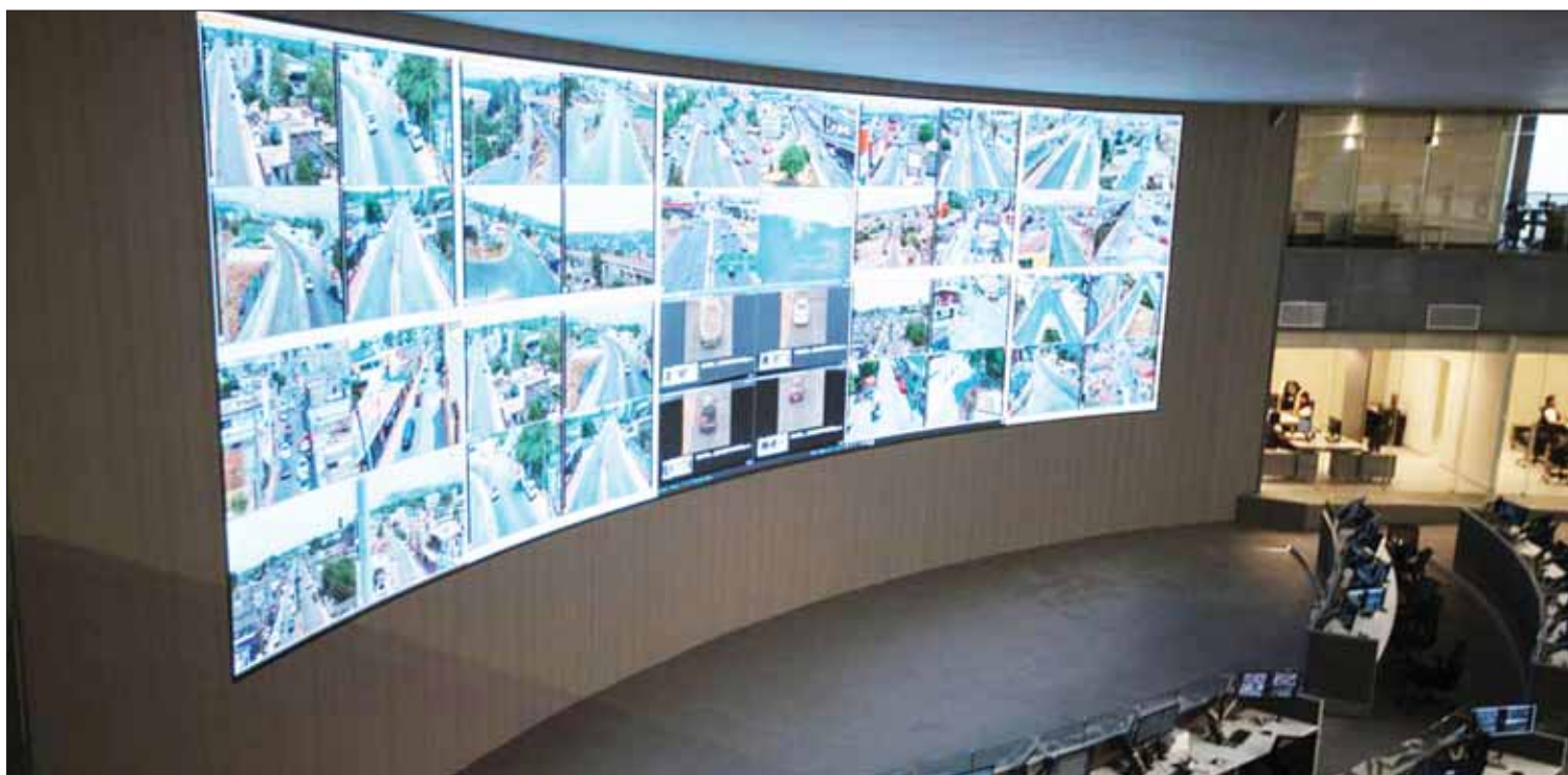
ATENCIÓN. Denuncias de robo a mano armada registradas en las últimas semanas, señalan que son cometidos por personas presuntamente provenientes del Estado de México.

Aunque explicó que representa a una modalidad diferente del transporte colectivo, mencionó que durante el sexenio del exgobernador, Miguel Osorio Chong, la Federación presentó un proyecto que proponía implementar "un piloto virtual", con la finalidad de colocar en cada unidad una cámara de video para inhibir la comisión de delitos.