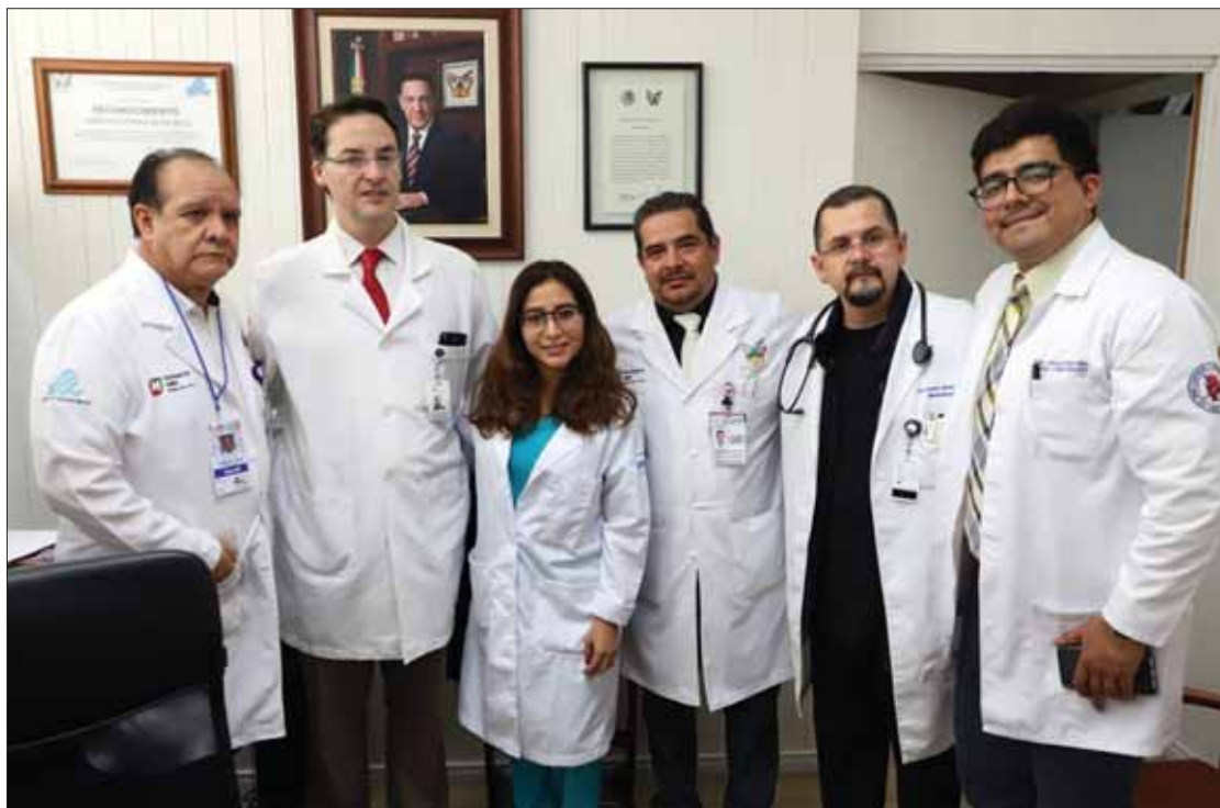
INNOVADORA TÉCNICA. Cirujanos con reconocimiento mundial realizan cirugía de tórax en el Hospital General de Pachuca.