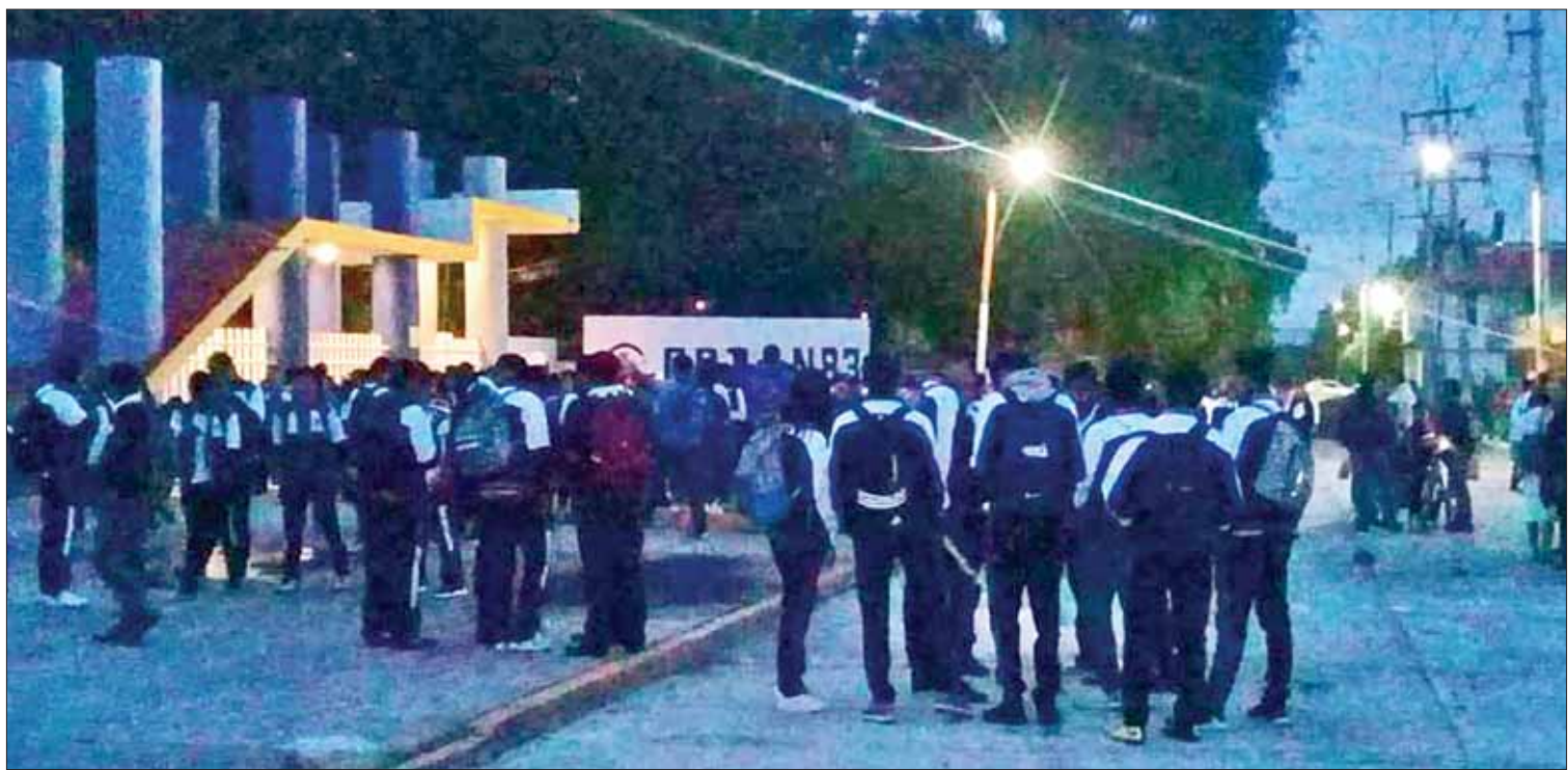
MÉTODO. Colocaron mantas y cartulinas con diferentes leyendas y obstruyeron el pasó.

Aun cuando han ingresado diversas solicitudes a instituciones no han tenido respuesta, de ahí que los trabajos que se han realizado dentro del inmueble han sido mínimos y con los propios recursos que se generan dentro del mercado. (Hugo Cardón)