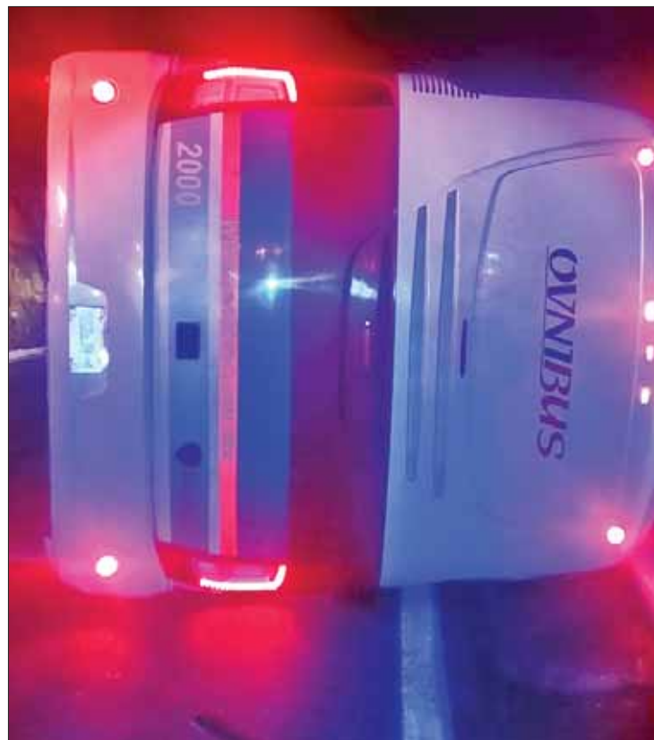
DESTINOS. Unidad, presuntamente, se dirigía hacia Jacala.

Este percance se registró a escasamente dos meses del accidente suscitado también en el kilómetro 97 sobre la carretera México-Laredo, donde