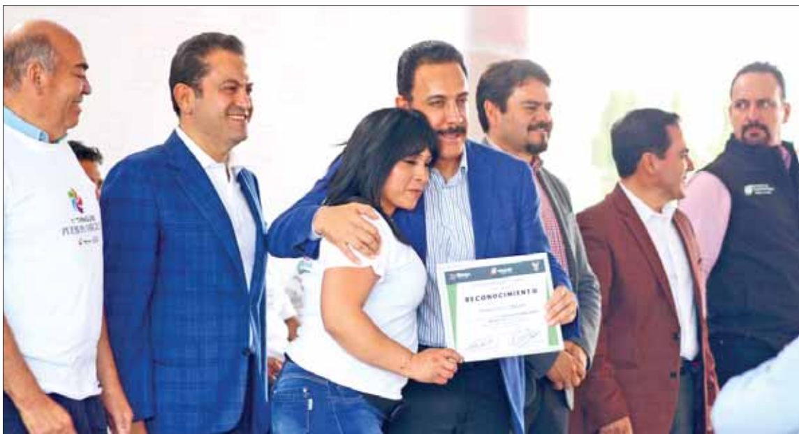
Los taxistas son la primera línea de contacto con los visitantes, con ello "se echa a andar el motor de la derrama económica", declaró ayer Omar Fayad durante la entrega de reconocimientos a los conductores.

"Antes de que concluya 2019 se puede dar la sorpresa del primer auto eléctrico que se construye en Ciudad Sahagún a bajo costo; la propuesta es cambiar las unidades de gasolina y gas, por estos modelos y que Hidalgo debe poner el ejemplo a escala nacional". .3