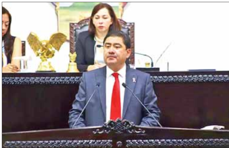
MARCO ESCAMILLA. Comparecencia del titular de la Secretaría de Salud de Hidalgo en el Congreso local.

Como parte de los compromisos prioritarios, el funcionario señaló que se instrumentaron acciones específicas para el cuidado de la mujer embarazada y su bebé, de ahí que con el compromiso de poner fin a las muertes evitables de recién nacidos, se impulsó la realización del tamiz metabólico con más de 31 mil pruebas realizadas, a las que se sumaron 13 mil 988 de tamiz auditivo y de manera innovadora, este año Hidalgo fue reconocido por la introducción del tamiz cardiaco, lo que permitió ampliar la cobertura a 20 cen-