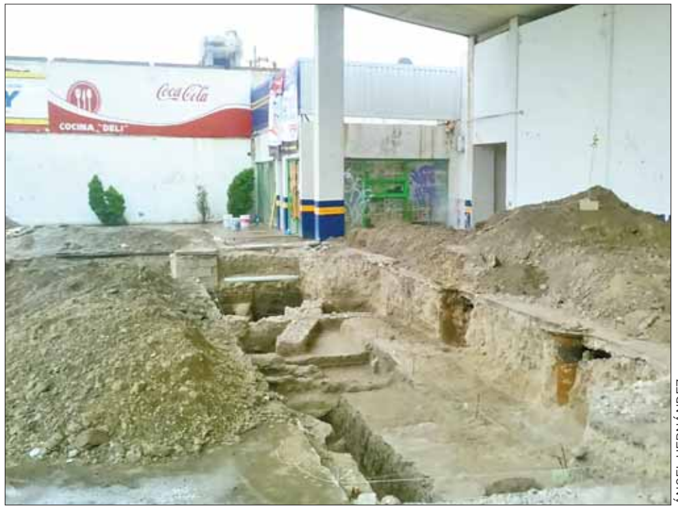
PLUS. En salvamento del bulevar también se localizaron templos de barrio, enterramientos humanos, unidades habitacionales y ofrendas.

sible realizar el salvamento arqueológico en lo que fue la primera excavación para construir un estacionamiento de una plaza comercial debido a que el gobierno municipal presionó al Instituto Nacional de Antropología e Historia y al propietario del predio para que taparan el lugar antes de que pudie-