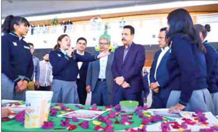
METAS. Señaló que este organismo brinda buenos resultados.

Por lo que se comprometió con el alumnado a continuar la entrega de becas, uniformes, libros, aulas digitales y útiles escolares