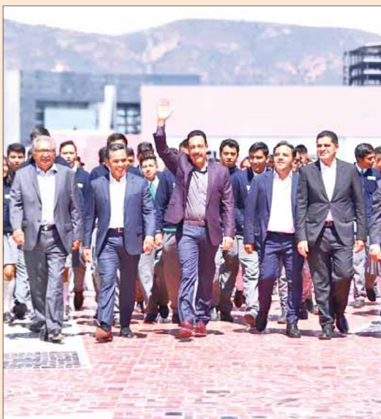
Subrayó gobernador Fayad posición que ocupa Hidalgo en materia de educación media superior, al conmemorar el 32º aniversario del Cobaeh.

■ Entrega titular herramientas para atender necesidades de población 8