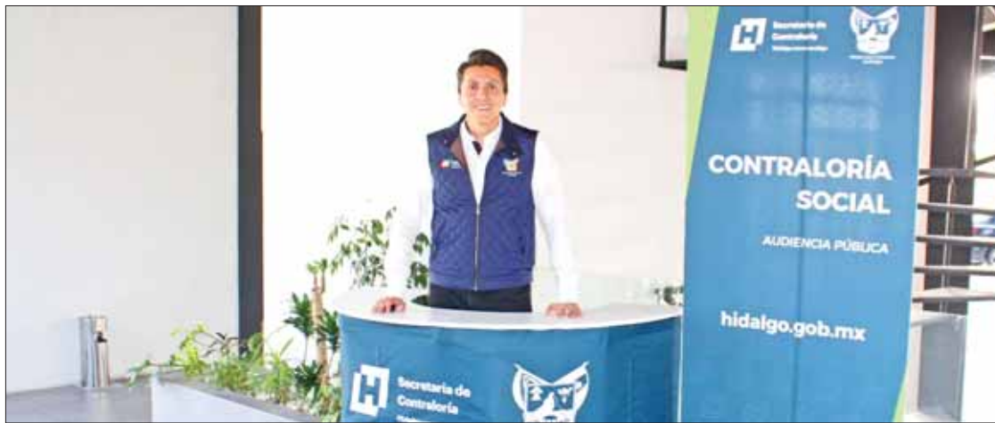
EJES. Subrayó visión e instrucciones del gobernador Omar Fayad para todas las dependencias del estado.

Exhortó a usuarios a que descarguen la aplicación para aprovechar al máximo todos los servicios. (Redacción)