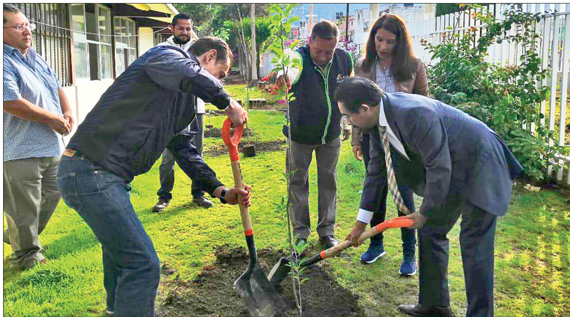
SOLUCIONES. Reiteró ayuntamiento importancia de crear bases sólidas relativas al entorno en el planeta.