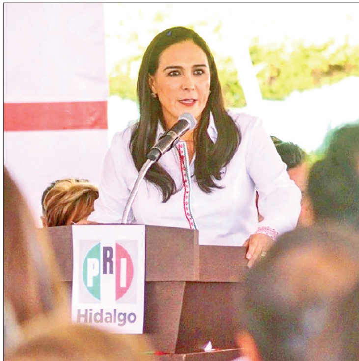
CERCANÍA. Recordó lideresa que sigue con reuniones y giras de trabajo para escuchar a población.