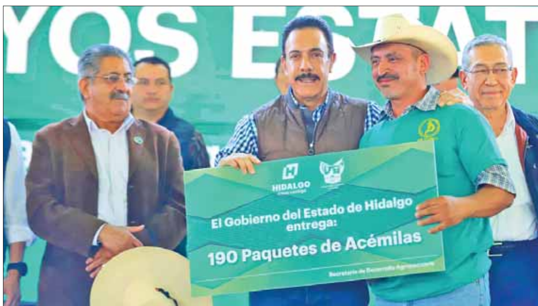
Entregó Omar Fayad diversos apoyos a favor de los productores del campo hidalguense.

Entregó cheques por 60 millones de pesos como parte del programa de plantas potabilizadoras y para fumigación, que aplicarán productores. .3