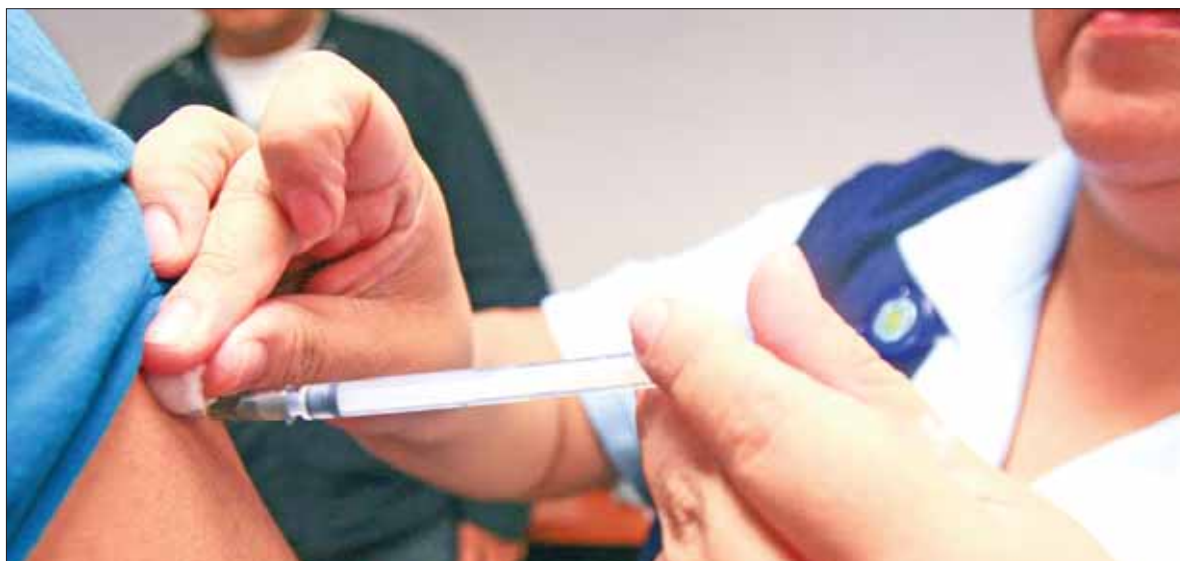
COORDINADOS. Expuso la dependencia estatal que también se cuenta con la inmunización en el IMSS e ISSSTE.

Genera inmunidad a casi 80 por ciento de los vacunados a partir de la tercera semana de su aplicación.