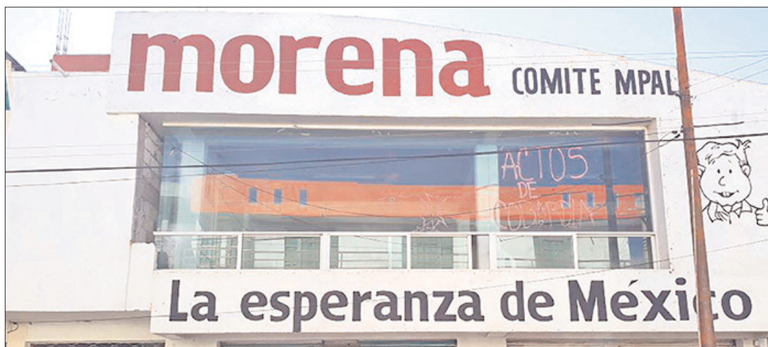
ASAMBLEA DISTRITAL. Será el próximo 27 de octubre: elegirán a los consejeros estatales.

► La dirigencia en Ixmiquilpan está fragmentada y tiene dos oficinas desde hace algunos meses