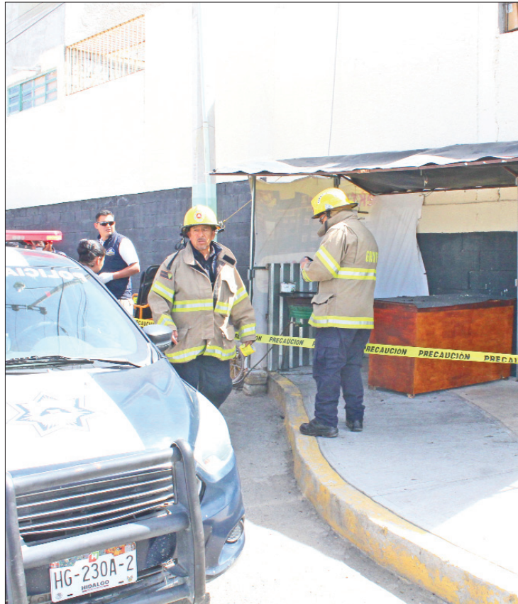
ATENCIÓN. Acudieron elementos de Protección Civil al lugar.

Los vecinos informaron que escucharon una pequeña explo-