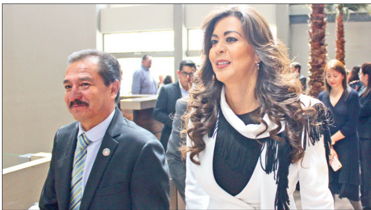
FÓRMULAS. Destacó posición de la entidad, así como programas y acciones en la materia.

sidera contratación de personal, capacitación, equipamiento y consolidación del Centro de Conciliación Estatal en su primera fase, operatividad de tri-