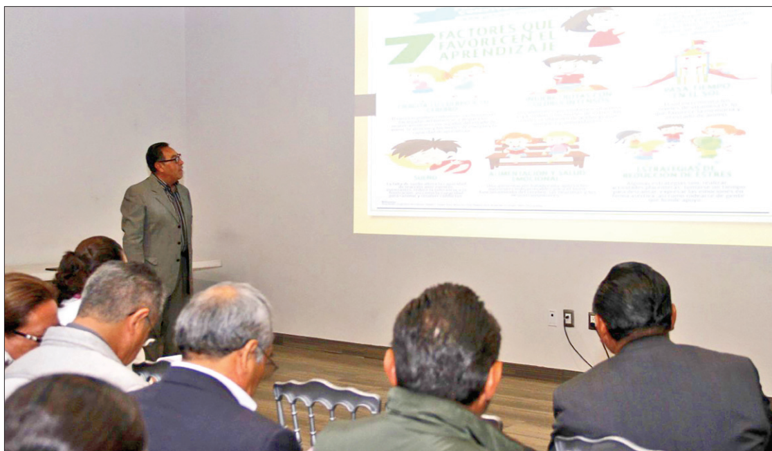
SEPH. Capacita a figuras educativas en el tema del programa nacional de convivencia escolar.

Con el propósito de que esta información llegue a la mayor cantidad de agremiados, la Casa XV del sindicato ha realizado reuniones en todas las regiones de Hidalgo. (Adalid Vera)