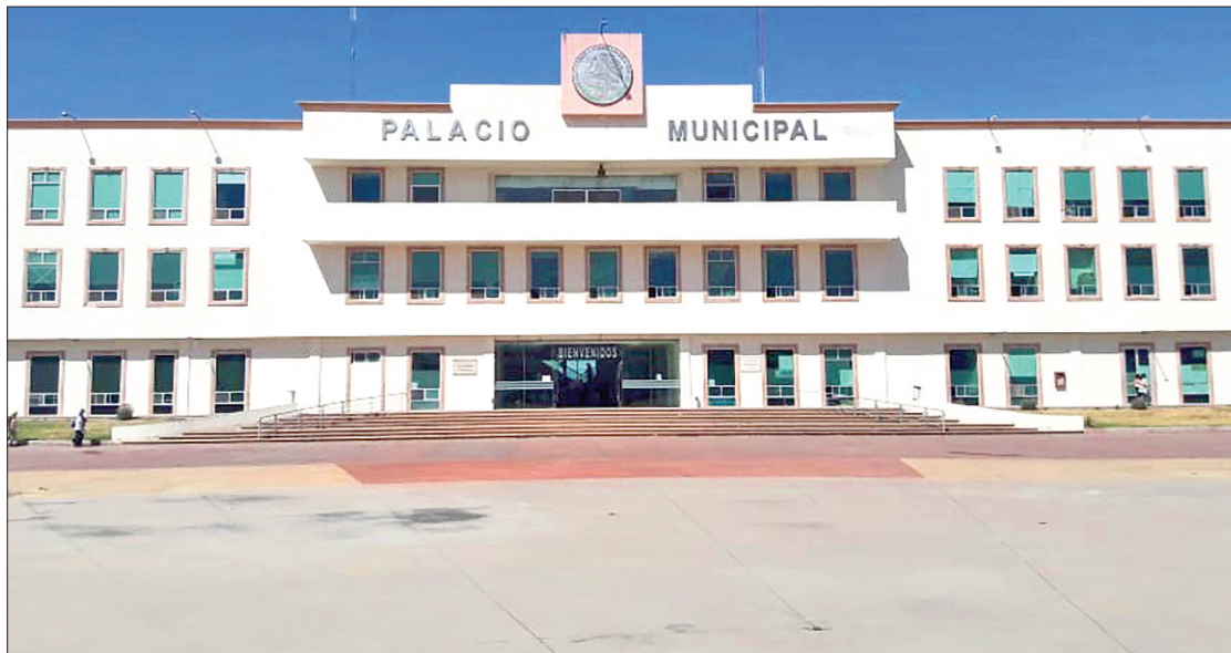
SEGUIMIENTO. El decreto formalizado entrará en vigor al día siguiente de su publicación en el Periódico Oficial del Estado de Hidalgo.