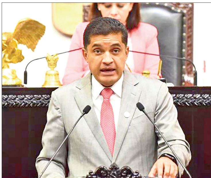
ANTES. Con aportaciones de los tres órdenes de gobierno la cantidad fue de más de 28 mil mdp.

Valera Piedras reiteró su preocupación por la eliminación de