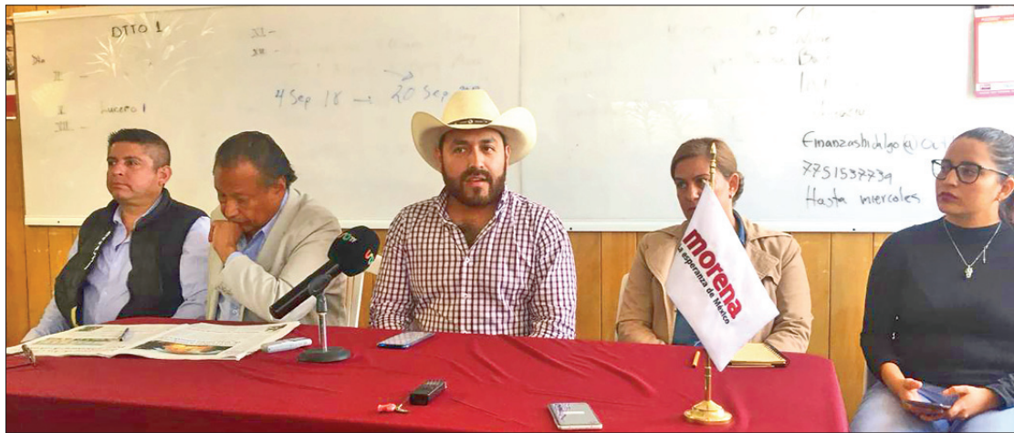
SERVIDORES. Denunció el secretario de Organización que preparan una queja formal al detectar anomalías.

El proyecto de la obra será por los próximos seis años, de acuerdo con la información que han proporcionado las autoridades de la Presidencia de la República.