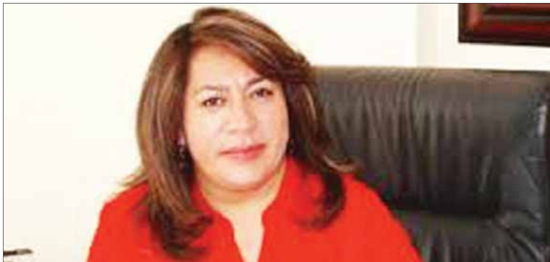
SOPORTES. Fortalecer las acciones que realicen las y los titulares de las instancias de mujeres en el estado.

Para lograr que al momento que las mujeres requieran ser atendidas ante una necesidad relacionada con estos aspectos, se difunde por medio de talleres temas como la información no sexista y mediante un lenguaje incluyente, participación política y liderazgo.