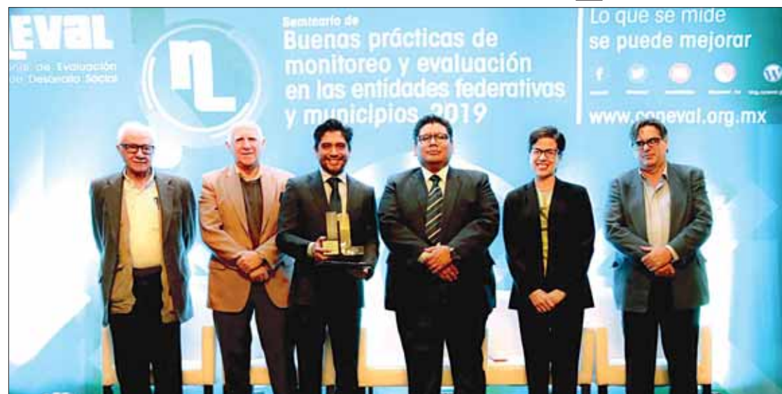
También recibió el reconocimiento al Diagnóstico de implementación del presupuesto basado en resultados por el sistema de evaluación de desempeño.