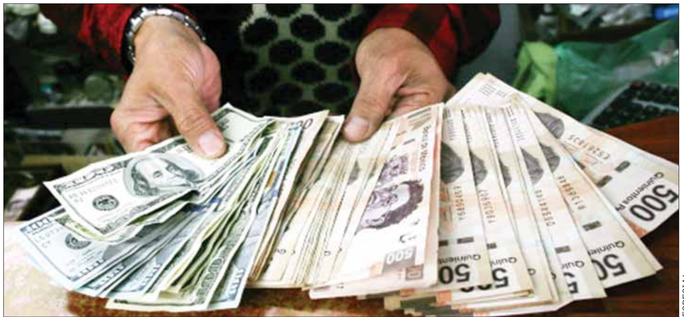
PROYECCIÓN. Será en los primeros días de noviembre próximo cuando informe de los resultados del tercer trimestre del año y las variables para finalizarlo.

REFERENTE. Durante 2018 las remesas de los mexicanos en el exterior sumaron 33 mil 480.55 millones de dólares, lo que representó un crecimiento de 10.52 %, respecto a 2017.