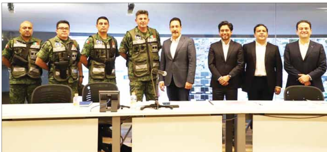
Encabezó Omar Fayad reunión de trabajo en el C5i Hidalgo con el general Gustavo Ricardo Vallejo Suárez, arquitecto constructor del Aeropuerto Felipe Angeles. Acudieron secretarios del gabinete estatal.

MECIÓN. Hidalgo obtuvo el mayor avance en la Generación de elementos de monitoreo y evaluación, así como el reconocimiento al Diagnóstico de Implementación del Presupuesto Basado en Resultados (PBR) de acuerdo con el Sistema de Evaluación de Desempeño (SED). 3