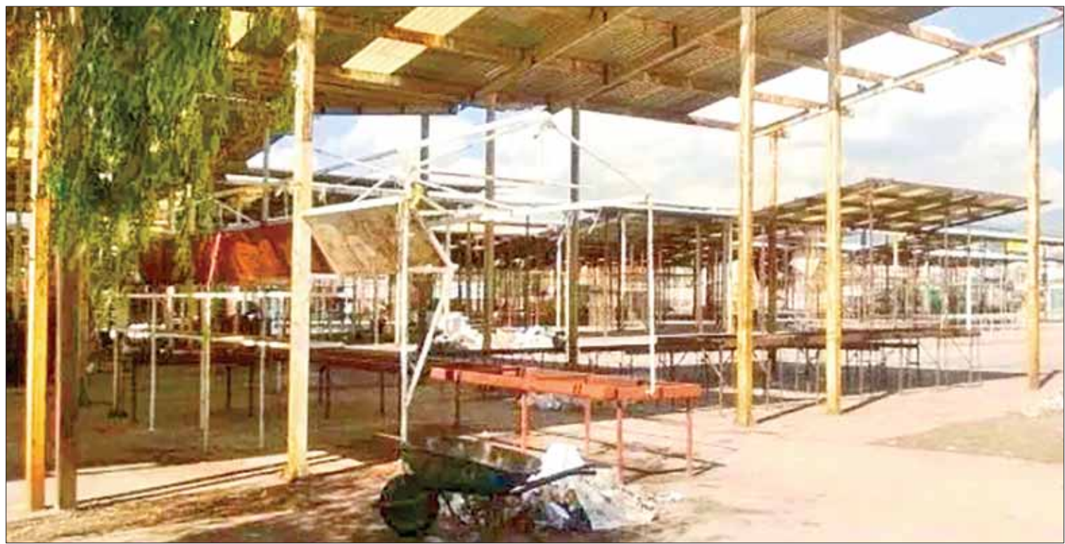
VIVALES. Mencionó el nuevo dirigente que hace tiempo la problemática creció con presidencias espurias que cobraban en nombre de organismo.

Agregó que no le quedaba más que instruir a la síndica procuradora jurídica de iniciar la querrela correspondiente. (Ángel Hernández)