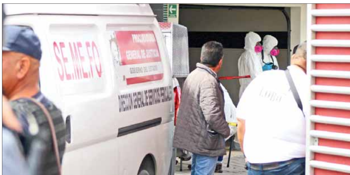
Confirmaron este viernes autoridades estatales fallecimiento de cuatro personas al interior de un motel.