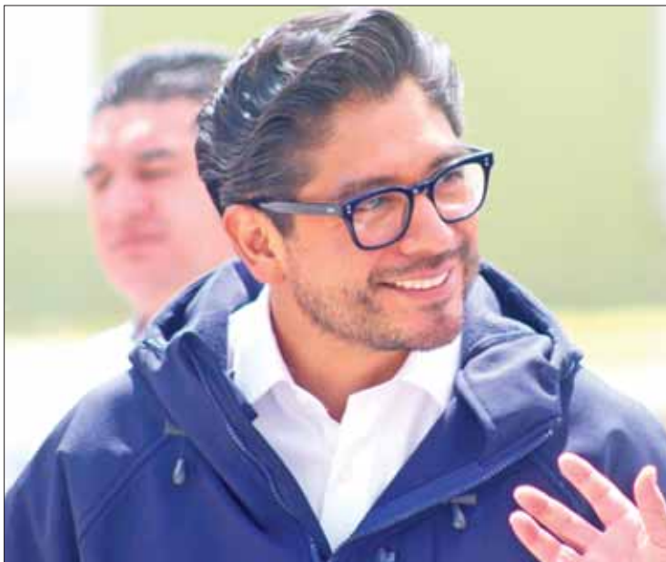
RUTAS. Recordó las acciones implementadas por el gobernador Fayad.

El funcionario hidalguense habló ante la delegación de estadounidenses sobre la perspectiva de México y las oportunidades de cooperación entre California e Hidalgo, así como el trabajo llevado a cabo por el mandatario estatal, en su calidad