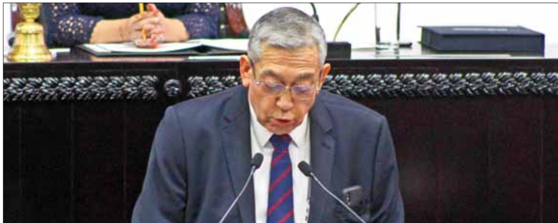
COPORTAMIENTO. Reconoció coordinador parlamentario del Morena que lo ocurrido durante la comparecencia del secretario de Gobierno no fue apropiado; solicita repetir ejercicio en condiciones adecuadas.

Algunas de las permutas refieren a la sustitución de los términos "medidas positivas y compensatorias" por "medidas de nivelación, medidas de inclusión y acciones afirmativas", considerar medidas afirmativas que promuevan la igualdad sustantiva de ciertos grupos o personas, entre otras. (Rosa Gabriela Porter)