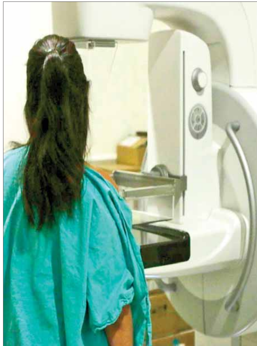
AL AÑO. Detectan 45 casos de cáncer de mama en la entidad.

Explicó que cuando existe sospecha realizan la mastografía correspondiente y si hay señales de alerta, inmediatamente llevan a cabo una biopsia para confirmar el diagnóstico.