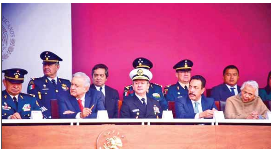
Acompañó el gobernador al presidente, Andrés Manuel López Obrador, al inicio de la construcción del Aeropuerto Internacional "General Felipe Ángeles", en la Base Aérea Militar de Santa Lucía.

■ Resalta Fayad que infraestructura aeroportuaria está a escasos kilómetros de Hidalgo, implicando beneficio de manera importante para esta entidad, así como para otros estados del centro de México