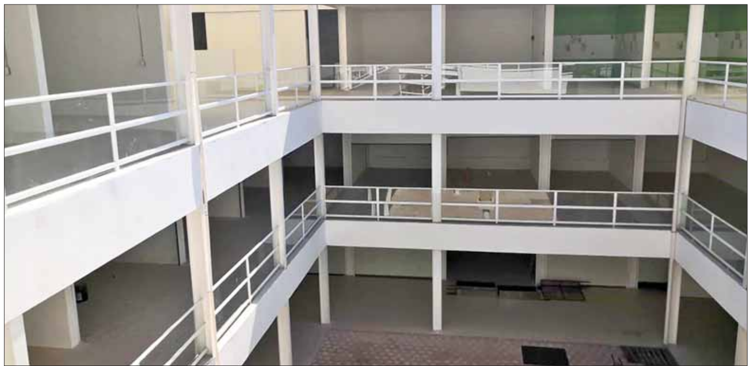
TLAXCOAPAN. Edil sólo dio de alta a 30 comerciantes, ante Instituto Nacional del Emprendedor. La situación es grave porque pidió una aportación de 65 mil pesos a más de 60 personas, a quienes ahora no responde.

Por otra parte denunció que ha sido víctima de amenazas de levantón por parte del exlíder petrolero, quien dijo intenta negociar con ella ante su inminente llegada a la dirigencia del sindicato. (Ángel Hernández)