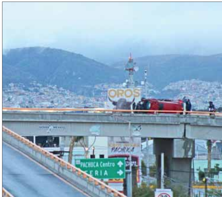
CONDICIONES. Reportan autoridades accidentes de este jueves, debido a la presencia de precipitación.

Una unidad de Policía Municipal reportó que el vehículo volcado se trató de Honda CRV, mo-