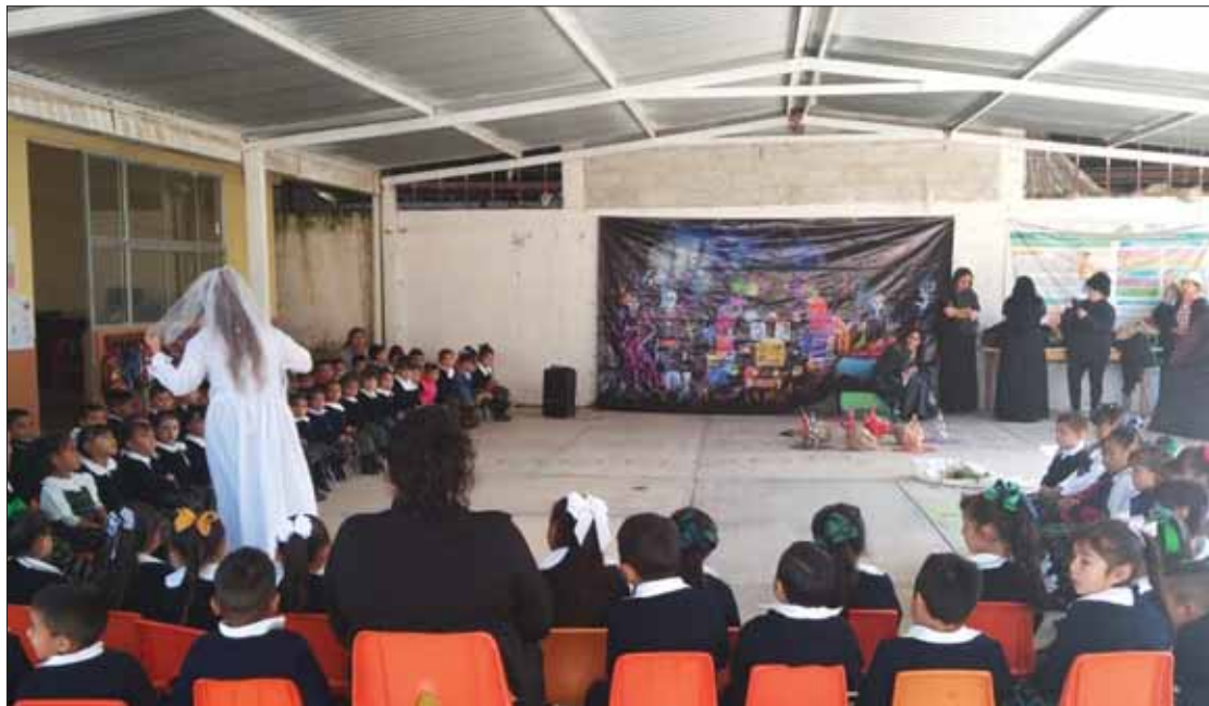
IDENTIDAD. Jefatura de Bibliotecas presentó principalmente: La Llorona y las Brujas del Cerro del Tezontle.

Los pequeños se mostraron fascinados en conocer más de su ciudad pero desde una perspectiva de riqueza cultural.