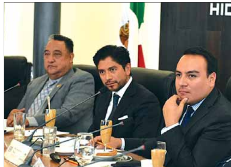
SEDECO. Hidalgo es una entidad con un gran potencial industrial, por esta razón el gobierno estatal trabaja con quienes deseen invertir.

tiene el mandatario Omar Fayad tiene resultados positivos, lo cual se prevé a través de las inversio-