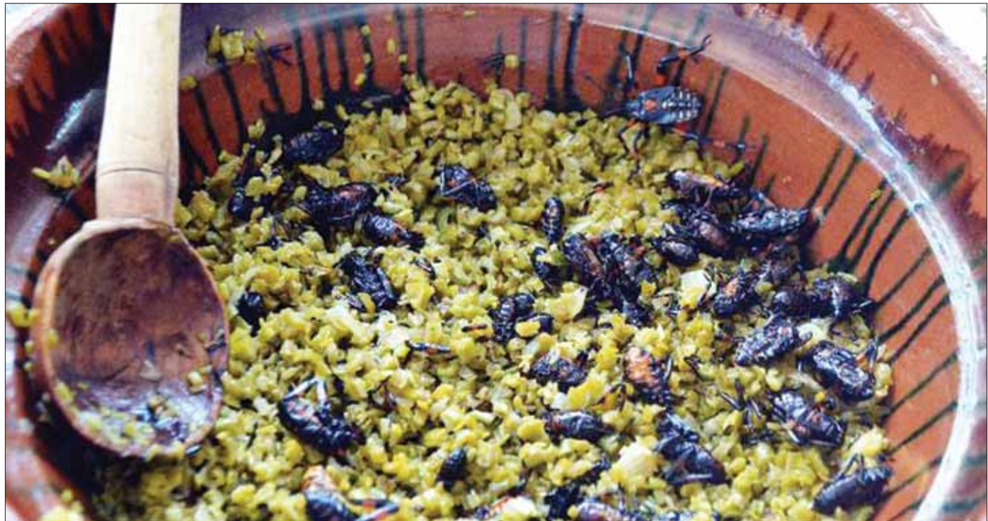
CLAVES. Por contexto histórico y cultural, es uno de los municipios que mayormente explota los recursos naturales como son la flora y fauna, esto por su gastronomía y artesanías.

Cabe mencionar que Santiago de Anaya por su contexto histórico y cultural, es uno de los municipios que mayormente explota los recursos naturales como son la flora y fauna, esto por su gastronomía y artesanías, lo que les ha permitido ser un referente a nivel nacional e internacional.