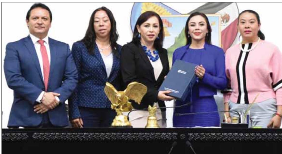
Este miércoles sesionó la LXIV Legislatura del Congreso estatal para recibir la comparecencia de Blancas Hidalgo, quien expuso los avances en materia fiscal y de gasto del estado durante el último año de ejercicio.

■ Destaca trabajo coordinado en la dependencia para incrementar así la recaudación, contener de manera responsable el gasto, destinar mayores recursos para la inversión y disminuir la deuda