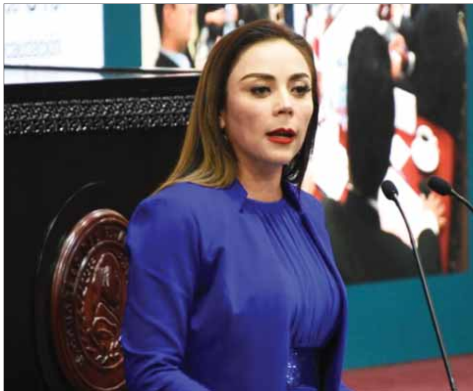
PAUTAS. Sesionó la LXIV Legislatura del Congreso estatal para recibir la comparecencia de esta funcionaria.