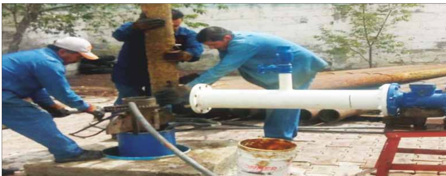
¡OJO! El servicio de agua será normalizando de forma paulatina, informan autoridades de la Comisión de Agua y Alcantarillado del Municipio de Tulancingo.