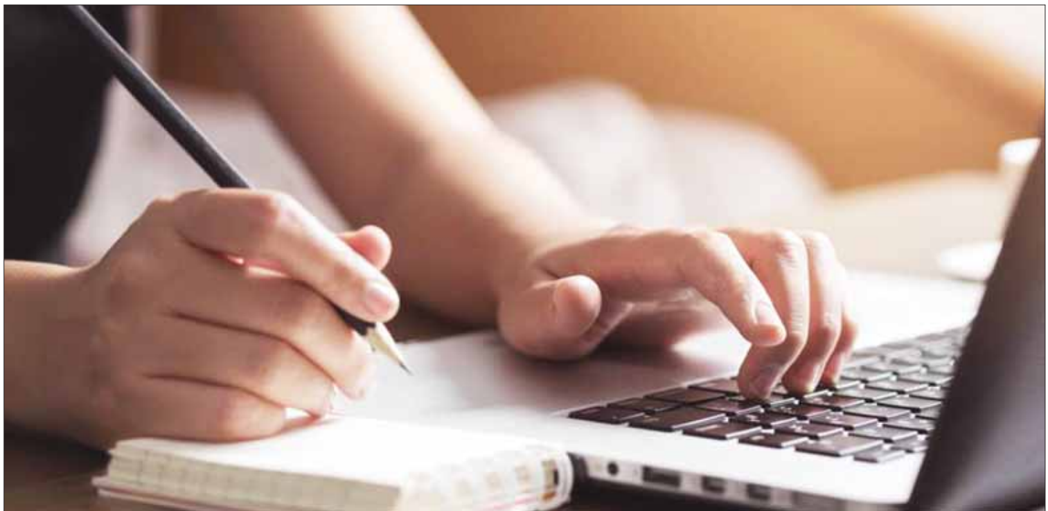
LAPSO. Permanecerá abierta hasta el 8 de noviembre, la preselección de connacionales será del 11 al 22 de noviembre.

La plataforma de este programa otorgará 400 becas anuales (100 por cada país), de las cuales se entregan 69 para estudiantes de pregrado, seis para estudiantes de carreras técnicas y tecnológicas, 25 para estudiantes de doctorado, investigadores y profesores invitados.