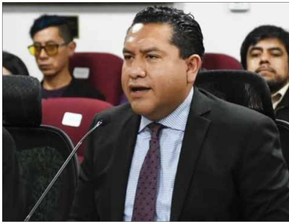
SOPORTES. Describe secretario que la red estatal de bibliotecas es un pilar muy importante para el impulso a la lectura en la entidad.

TEMA. Ayer por la tarde ante los diputados locales, trabajadoras de la dependencia se manifestaron para exigir salarios justos y regularización en las contrataciones, a lo cual también respondió.