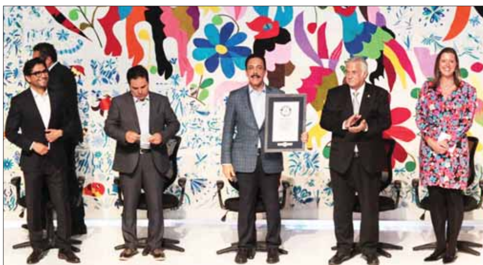
Destacó el secretario federal Miguel Torruco que, hace 18 años, fue Huasca el primer lugar que entró al Programa Pueblos Mágicos y que este 2019 fue Pachuca sede del primer tianguis nacional para estos. Remarcó la labor del gobernador para promover estas demarcaciones, así como el trabajo a favor del Turismo.

Adelantó que en 2020 la Secretaría de Turismo federal pondrá en marcha el programa "Disfruta México" para impulsar aún más el turismo a escala internacional. .3