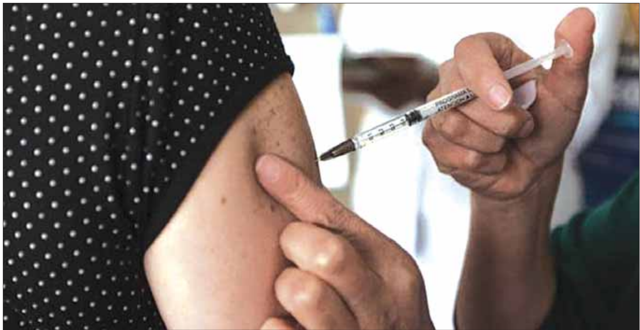
CLAVES. Vacuna la puede solicitar cualquier persona, aunque no sea derechohabiente.

Enfatizó que la vacuna la puede solicitar cualquier persona, aunque no sea derechohabiente del IMSS, en cualquier unidad de medicina familiar o en los hospitales pertenecientes a la institución, en donde colocarán módulos para su aplicación.