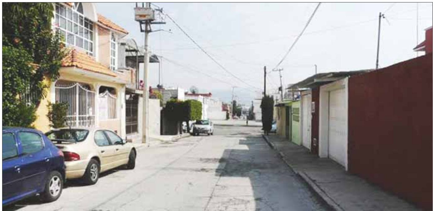
SENTIR. Resultados no han sido favorables y eso es lo que califica la población.

Añadió que el último año de ejercicio municipal debe representar un aviso y a su vez la oportunidad para enderezar el camino y garantizar seguridad a los pachuqueños que aún confían la administración que encabeza esta integrante de la familia Tellería Beltrán.