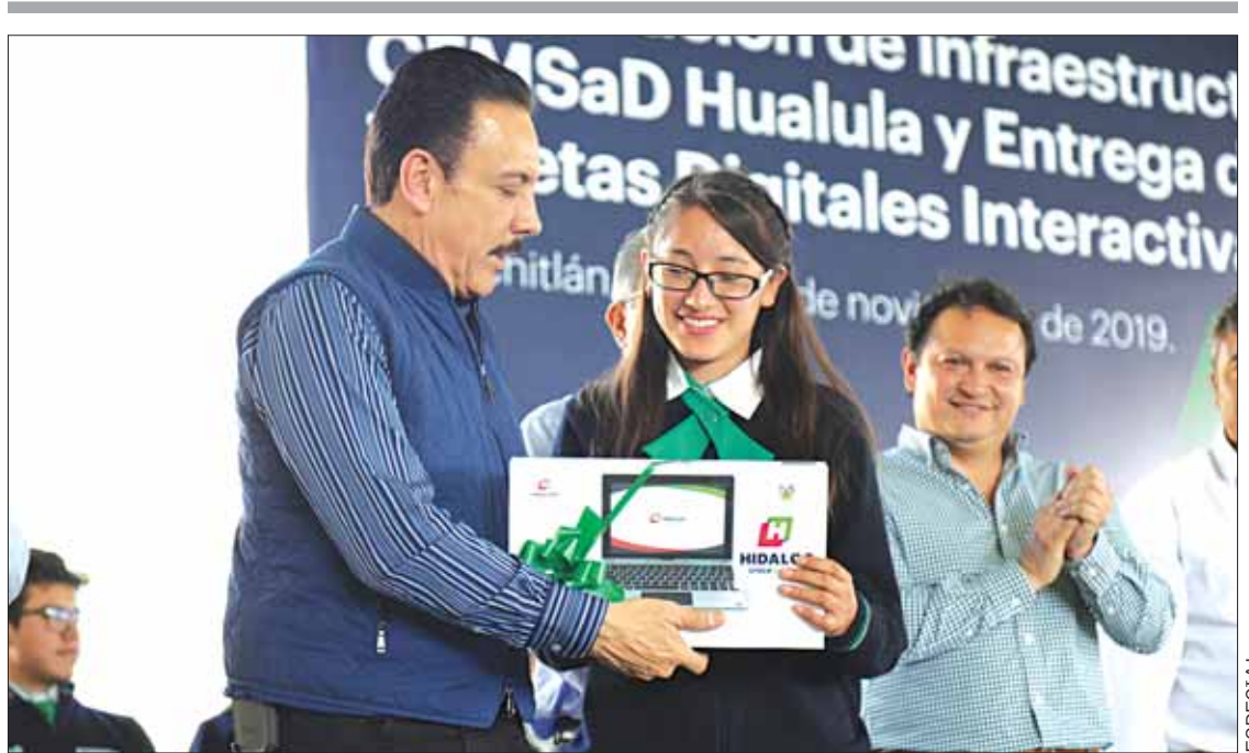
De manera simbólica, el gobernador entregó 2 mil 365 tabletas digitales para alumnos, en Eloxochitlán.

La iniciativa para respaldar a los estudiantes de institutos tecnológicos, universidades tecnológicas, politécnicas e intercultural, además de escuelas normales requiere el respaldo de las y los integrantes de la LXIV Legislatura local con la aprobación del paquete hacendario 2020, por lo que el titular del Ejecutivo estatal los exhortó a no recortar el presupuesto estimado para educación. .3