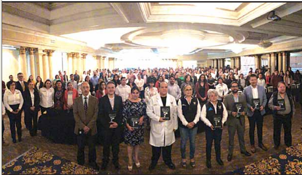
ARTÍFICES. Organizado por la Secretaría de Salud de Hidalgo, a través de la Comisión para la Protección contra Riesgos Sanitarios. ESPECIAL

Buscan autoridades mantener informada y protegida a la población de riesgos innecesarios relacionados con el uso de medicamentos; el exhortó a todos los profesionales de la salud, así como a población en general es comunicar a su médico o unidad hospitalaria las manifestaciones de cualquier sospecha de reacciones adversas.