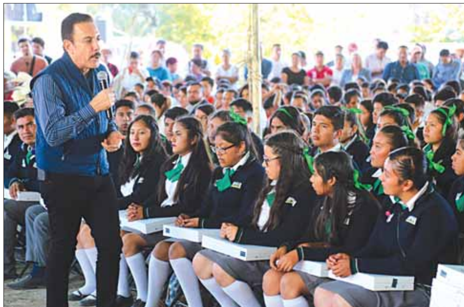
MUESTRAS. Inauguró jefe del Ejecutivo estatal infraestructura educativa en Eloxochitlán.