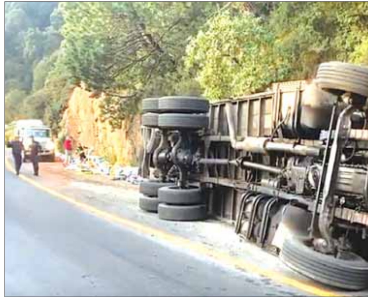
SECUELAS. Maniobras para el retiro de la unidad duraron algunas horas.

Por el hecho, el tránsito vehicular se vio afectado, pues las maniobras del retiro de la unidad duraron algunas horas.