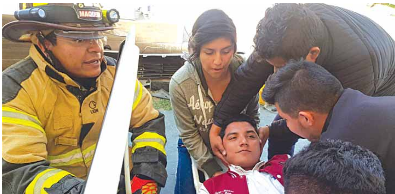
PAUTAS. Efectuaron talleres como "Ingreso, recuperación y rescate en espacios confinados" y "Protección respiratoria-protección auditiva", entre otros.

El rector destacó que gracias a la sinergia entre autoridades, industria y educación este tipo de trabajos benefician no sólo a los estudiantes de la Ingeniería en Seguridad para la Industria Energética.