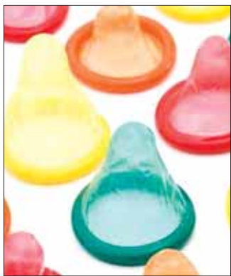
SENTIDOS. Formación integral para los universitarios.

► Actividades desarrolladas para la comunidad universitaria; participan diversas instituciones